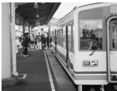
更なる利便性の向上が期待される関東鉄道常総線

の乗降客数の変化は、全体で1日6千95人、9・4%減少で、1日平均の乗降客数は5万9千80人である。その要因は、守谷駅前後の南守谷駅及び戸頭駅の利用者が約26%減少し、更に取手駅乗換への乗降客が減少したことである。反面、守谷駅では対前年比1日平均3・5倍の乗降客となった。また、常総北線と言われている北水海道駅から下館駅までの区間においては、前年比1日平均約360人、6・7%増の5千81人、特に下妻駅については約210人、18%増の千353人と大幅な乗降客の増加となった。快速列車についても、朝の上り列車について3本合わせて1日平均60名の乗車があり、非常に好調であると聞いている。12月からはダイヤ改正に伴い、日中の利用者のため快速列車が3往復増発されたこととなっているので、更なる利便性の向上が期待されている。(2)関東鉄道の北水海道駅から下館駅