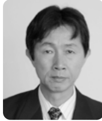
原部 司 加養834番地3 1期