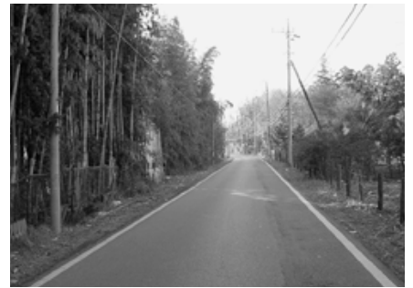
安全が求められている通学路

(1) 議員ご指摘の道路 の防犯灯については、 平成16年第1回市議会 定例会の一般質問の中で、下妻市 防犯灯設置及び管理要綱の基準で、 50m以上の距離を置くことと規定 されており基準を満たしているの で、今後も設置基準に基づき対応 して参りたいと答弁している。ま た、既存の防犯灯の照度を上げる ことについては、必要性や経費等 も考慮しながら検討していきたい が、児童・生徒の安全を確保する ことは非常に大切なことであるの で、現況を調査した上で適切に対 応したい。(2) 下校時の児童・生徒