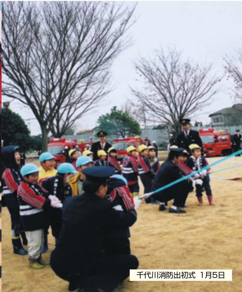
千代川消防出初式 1月5日