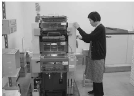
民間委託をしている庁内の印刷業務

現在の下妻市の経常収支比率は97・1%、財政力指数も0・574と非常に厳しい状況である。千代川村は、経常収支比率、財政力指数ともに下妻市より更に低い値である。このような状況下で、合併をしてから10年間に限って調達できる合併特例債や、10年間、合併前に受け取っていた金額が保証される地方交付税の特例があるが、今後10年間に地方自治体は、自主財源の確保、また費用削減などの大規模なリストラを行う必要がある。自主財源の確保は、景気低迷