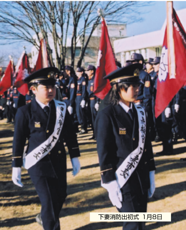
下妻消防出初式 1月8日