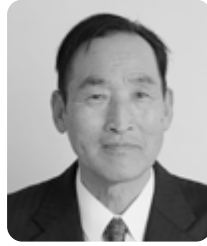
中山 力 別府875番地3 4 期