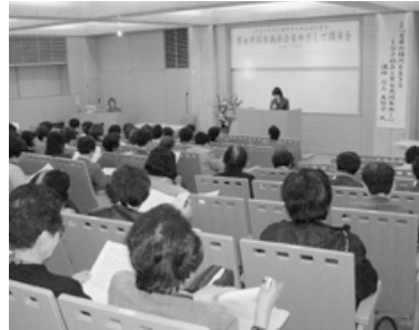
男女共同参画社会をめぐっての講演会が行われた様子

を掲げ、子育て支援に向けた事業を実施中であるが、女性が子供を生み育てる環境を更に高めていくためには、男女共同参画社会の実現は重要な要因となるので、男女共同参画の部門においても、できるところから取り組んで参りたいと考えている。また、少子化対策は福祉、教育、保健等、多岐多様な分野にわたるものであり、各分野での専門的な対応が必要であると考えているので、男女共同参画係に少子化対策の係を併設することとは、今後の研究課題とさせていただきます。(2)阪神・淡路大震災、