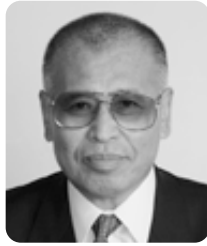
磯 晟 長塚186番地 7 期