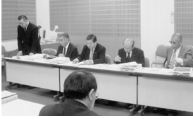
北海道根室市 明を受けて、意見交換が行われました。

根室市では、北方領土返還運動と現在の状況について視察を行いました。北方領土返還運動の拠点である北海道立北方四島交流センター「ニ・ホ・ロ」は、平成12年2月7日の北方領土の日に建設され、北方領土問題についての国内外の世論を一層盛り上げるとともに、北方四島に居住するロシア連邦国民との交流を図る拠点施設であるとのこと。