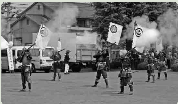
迫力満点の砲術演武

5日には、観桜苑と砂沼南岸の特設ステージを中心に、「砂沼桜まつり」が、開催されました。 少し肌寒い日にもかかわらずたくさんの人が訪れ、カラオケ大会・おはよしの演奏・ビンゴ大会・Eポーター体験など、様々なイベントを楽しんでいました。