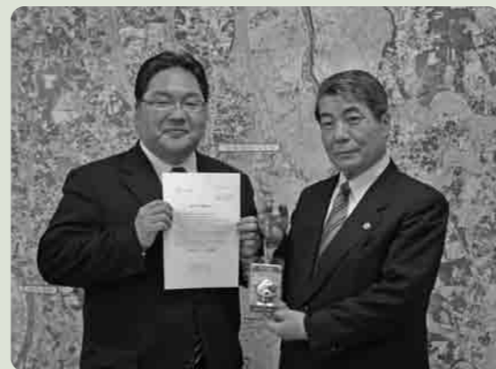
常陽銀行下妻市支店から防犯ブザーの寄贈