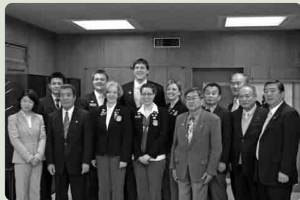
市役所を訪れたアメリカ視察団