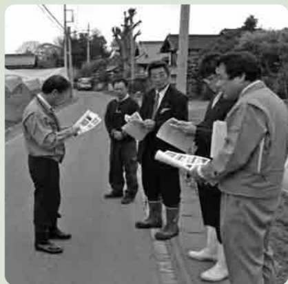
被害状況を調査する視察団