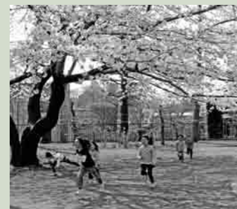
市役所・本庁舎地近くの多賀谷城跡公園で。満開の桜のなか子どもたちの笑顔も満開で、楽しい笑い声があちらこちら聞こえていました。