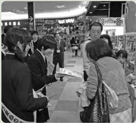
中学生も買い物客に防犯の呼びかけを

キャンペーンには、防犯ボランティア団体をはじめ21団体・約120名が参加し、下妻中学校生徒会代表により力強い決意表明も行われまし