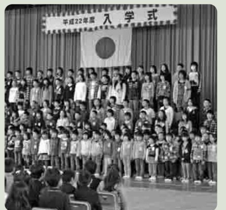
歓迎のうたを披露する上級生(下妻小学校)

4月6日、市内の各小・中学校で入学式が行われました。 今年市内で新しく1年生となったのは、小学校438人・中学校469人です。 小学生として、そして中学生としてそれぞれ元気なスタートを切った子どもたちに、保護者の皆さんも感激の様子でした。