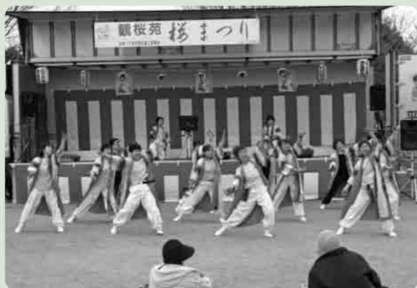
はなやかな踊りも披露されました

桜の花が咲き、草花が芽を吹き出す暖かな春がやってきました。4月に行われた、二つのおまつりを紹介します。