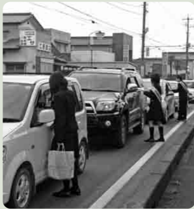
高校生も安全運転のお願いを

4月6日から15日まで、春の全国交通安全運動が行われました。 「子どもと高齢者の交通事故防止」を基本に、市内各地でいろいろな運動が展開されましたが、初日の街頭キャンペーンには下妻一高の生徒会も参加し、ドライバーに安全運転を呼びかけました。