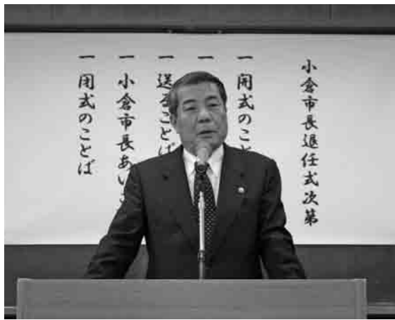
退任式で在任8年間を振り返る小倉市長