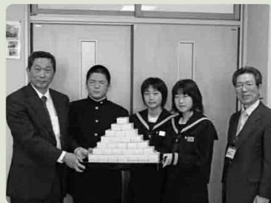
千代川建設業協会から防犯ブザーの寄贈

このほど、下妻市千代川建設業協会から千代川中学校の1年生に、常陽銀行下妻支店から市内各小学校の1年生に、防犯ブザーが寄贈されました。 ブザーの大音量は、もしものときに周囲に危険を知らせ、相手を威嚇し、連れ去りなどの犯罪を防ぐ効果があります。 登下校時やひとりで出かけるときに携帯し、犯罪被害の防止に役立ててほしいと寄贈されたものです。