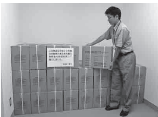
東部中学校体育館内の備蓄倉庫に保管

の備蓄を計画的に進めていますが、各家庭においても災害への備えとして備蓄に心がけ、防災について家族で話し合いたいしょう。