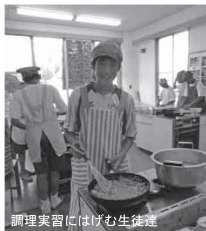
調理実習にはげむ生徒達

養教諭として常に考えていることは、「食育」の学習から、子ども達一人ひとりが「将来の健康を考えると『食』を選択できる力を身に付けてほしい」ということです。中学を卒業する時には、自分で簡単な料理が作れるようになってほしいと願っています。