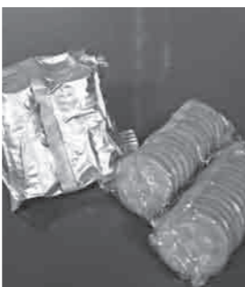
1袋は13枚組が2個入です

災害時には、水や食糧等をはじめとする備蓄物品が、1人あたり3日分は必要とされています。市では現在、水や食糧等