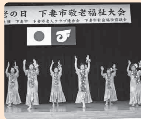
いきいきとした催し物を披露

をつけ、自分のことは自分で行っている。」など、長寿の秘訣を102歳とは思えぬ元氣ぶりで話してくれました。 また、9月17日の敬老の日には、市総合体育館で「第42回下妻市敬老福祉大会」が開催されました。当日は市内高齢者の方々400名が参加し、日頃から地域の中で練習してきた歌や踊り、体操等が披露され、楽しい一日を過ごしていました。踊りを披露した市内78歳の女性からは「踊りは、健康保持のためにやっていて、毎年、敬老福祉大会を楽しみにしている。」との声が聞けました。