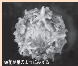
頭花が星のようにみえる

花茎10～15cmで、7月から9月に先端に白い花の集まりの頭花（6～7mm）をつける。