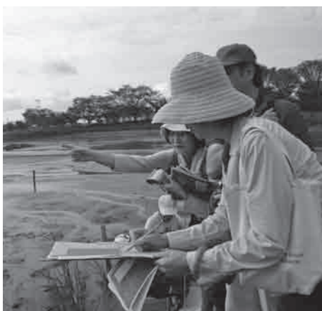
開花状況の記録を体験しました