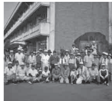
高道祖小学校で除草ボランティアをがんばりました

シルバー人材センターでは 会員を募集しています 市内にお住まいで、おおむね60歳以上の「健康で働く意欲のある方」ならどなたでも入会できます。 入会説明会があります。詳しくは、お問い合わせください。