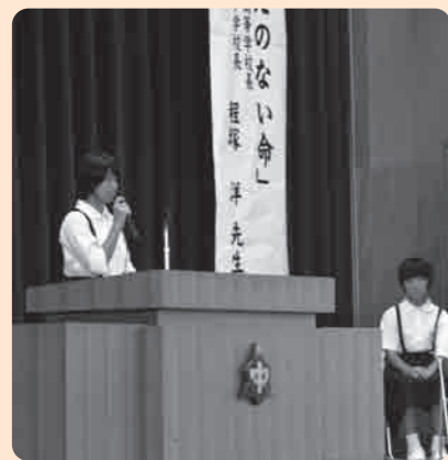
いじめのない学校づくりに取り組みます

9月21日の早朝、秋の全国交通安全運動(9月21日から30日の10日間)に伴う「秋の交通安全街頭キャンペーン」が行われました。 街頭キャンペーンでは、下妻警察署の協力のもと、市内交通安全団体等の関係者80名が参加し、本宿交差点と宗道交差点の2箇所、道路を通行中のドライバーの方々に啓発用品を直接手渡し、交通安全を呼び掛けました。 市内の交通事故発生件数は、昨年より減りましたが、9月に2件の死亡事故が発生するなど、ドライバーや保護者とともに交通安全の意識を持つことが重要となっています。