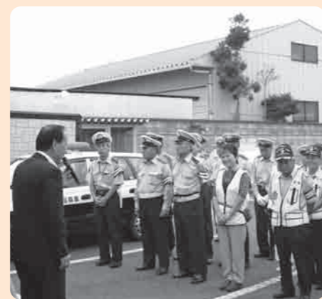
街頭キャンペーン開始式

9月21日の早朝、秋の全国交通安全運動(9月21日から30日の10日間)に伴う「秋の交通安全街頭キャンペーン」が行われました。 街頭キャンペーンでは、下妻警察署の協力のもと、市内交通安全団体等の関係者80名が参加し、本宿交差点と宗道交差点の2箇所、道路を通行中のドライバーの方々に啓発用品を直接手渡し、交通安全を呼び掛けました。 市内の交通事故発生件数は、昨年より減りましたが、9月に2件の死亡事故が発生するなど、ドライバーや保護者とともに交通安全の意識を持つことが重要となっています。