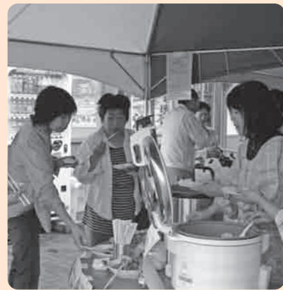
新米を試食する来客者達

「下妻産コシヒカリ」のPRと「地域ブランド米の確立」を目指して、9月22日・23日にやすらぎの里しもつま農産物直売所、9月24日には東京都北千住のアンテナショップ「シモンちゃんの家」を会場に「下妻産新米まつり」が開催されました。 イベントでは、新米の試食に合わせて、その場で希望量を精米する「つきたて米」の即売や抽選会が行われ、多くの来客者で賑わいました。 JA常総ひかり職員は「今年は好天に恵まれ、うまい米ができた。」と新米の味と品質に自信をみせ、試食した守谷市の60歳代夫婦からは「もちもち感があって美味しい。」とのコメントが聞けました。