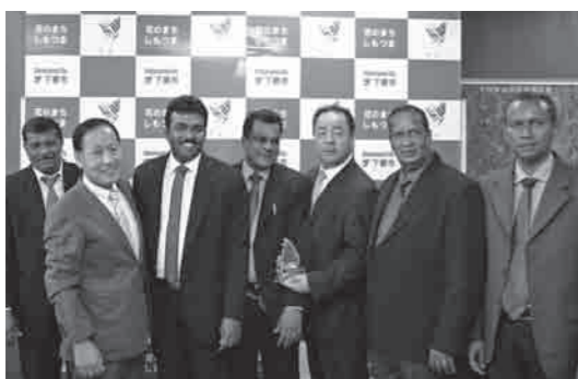
コッテ市長(左から3人目)より記念の盾が贈られました

9月11日、スリランカの首都であるスリ・ジャヤワルダナプラ・コッテ市の市長が下妻市役所を訪れ、稲葉市長と意見交換を行いました。