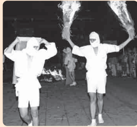
たいまつを持って駆け回る白装束の若者

9月12日と14日の夜、大宝八幡宮で、炎の奇祭「タバカ祭」が行われました。 その起源は、応安三年(西暦1370年)に敷地内で出火した際、畳と鍋蓋を使って火を消し止めたという故事から始まったとされ、「タバカ」の名は祭りの中で大たいまつ(たいまつ)の火を囲んで畳と鍋蓋を勢いよく石畳に叩きつけた時のバタンバタンという音から起こったと伝えられています。 たいまつ(たいまつ)の火の粉を浴びると火の災いを免れるといわれ、境内にはたいまつ(たいまつ)や畳を持った白装束の若者が駆け回る姿と舞い散る炎に参拝客の歓声が響いていました。