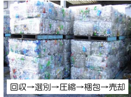
回収→選別→圧縮→梱包→売却

◆回収ボックスの設置場所は、各世帯に配布している「保存版下妻市のごみのことがわかる本」をご覧ください。