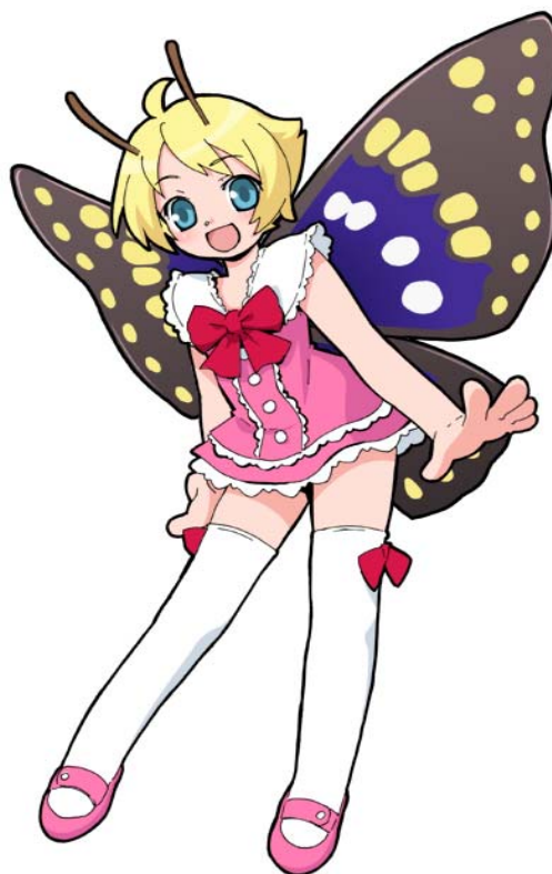
下妻市ホームページキャラクター（シモンちゃん）