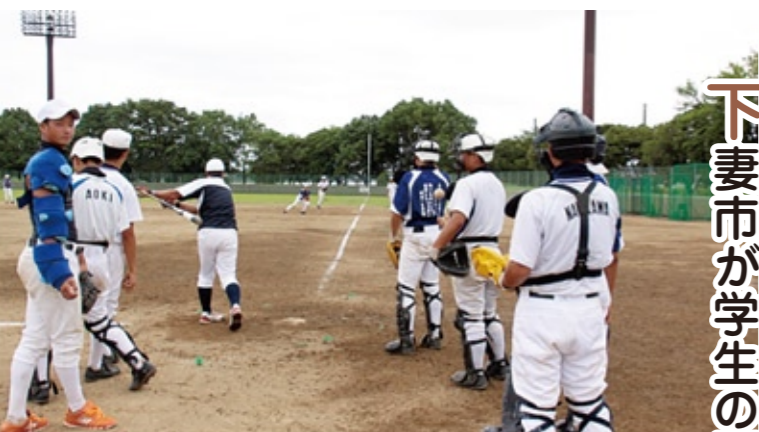
砂沼球場で練習に励む城西高校野球部の選手たち

収穫したの下妻完熟梨を試食した参加者は「今年初めて梨を食べたが、みずみずしくて美味しい」「初めて梨狩りを体験した。こんなに美味しい梨を食べたことがない。何個も食べられそう」と笑顔で話していました。