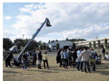
ロケ地：旧東部中学校 作品名：カロリーメイト(CM) 撮影年：平成24年

的な建物などが映像として全国に発信されています。これから映像作品やテレビ番組をご覧になった際には、作品の最後に流れる出演者の名前などと一緒に表示される「ロケ地」や「協力団体」にも注目してみてください。『下妻市』に関連する名前が出ているかも知れません。 これまでに市内で撮影された作品等の一例を紹介します。