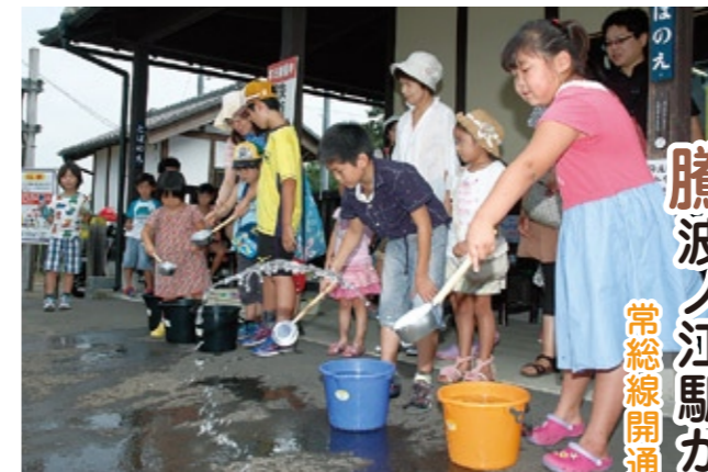
水打ちを楽しむ子どもたち

騰波ノ江駅から打ち水でクールダウン 常総線開通100周年イベント「打ち水大作戦」