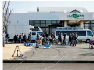
ロケ地：ほっとランド・きぬ 作品名：名探偵コナン(ドラマ) 撮影年：平成24年