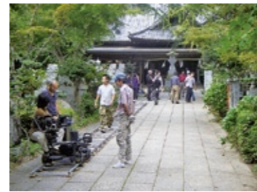
ロケ地：大宝八幡宮 作品名：歌舞伎町はいすくーる(映画) 撮影年：平成24年