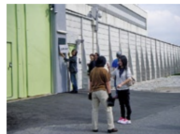
ロケ地：下妻拘置支所 作品名：歌舞伎町はいすくーる(映画) 撮影年：平成24年