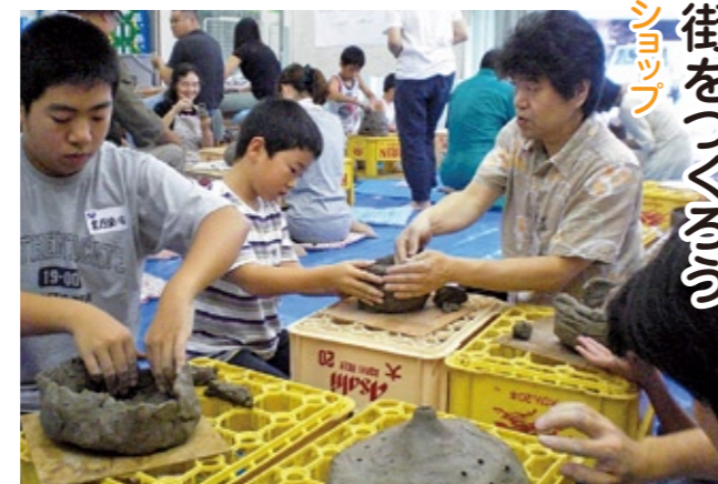
ランタンづくりに集中する参加者たち

今回制作した陶芸ランタンは、焼き上げてから10月13日に色塗りを施し、11月10日に予定されている下妻駅前のイルミネーション点灯式に併せて、栗山商店街の店先に飾られます。