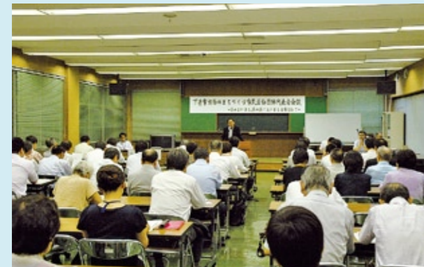
協働のまちづくりに向けての第一歩を踏み出しました