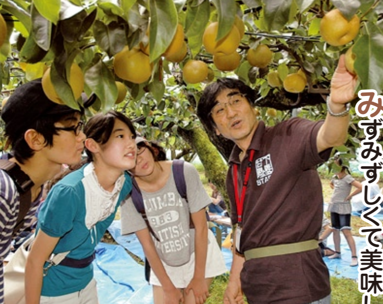
美味しい梨の見分け方の説明に真剣なツアー参加者たち

8月24日、今年7月に千葉県浦安市のショッピングプラザ新浦安にオープンした下妻市アンテナショップ「下妻ファーム」の常客を対象に企画した「いいな下ツアー! 梨狩り体験」に116名の応募の中から当選した浦安市民36名が下妻市を訪れ、下妻甘熟梨の収穫を体験しました。