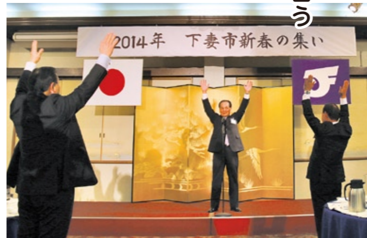
飛躍の年を祈念して万歳三唱