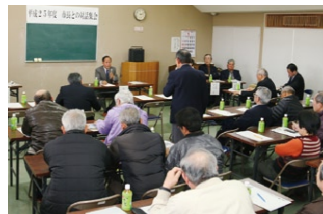
フリートーク方式で意見交換される対話集会

集会は、稲葉市長が最近の市の動きや財政状況などを報告した後、フリートーク方式で地域の要望や意見、質問に対して、稲葉市長がその場で回答するな