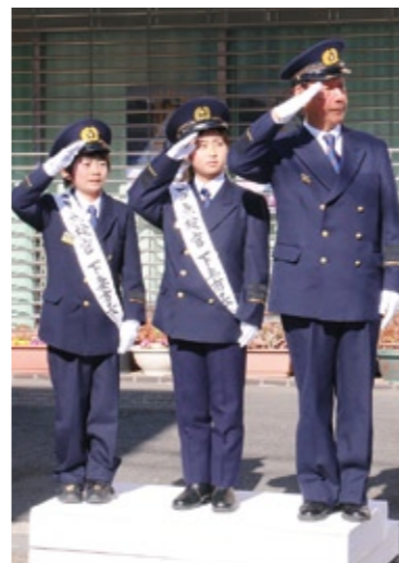
市長と一日点検官による車両観閲

新春を飾る「平成26年下妻市消防出初式」が1月12日、地元選出の国会議員等を来賓に迎えて行われ、消防職員と消防団員あわせて約400名が参集しました。