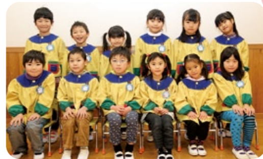
◀年長(ひまわり組)の皆さん