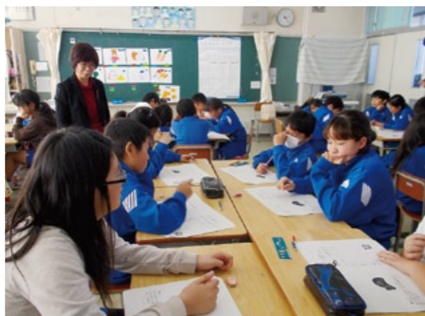
予算内での買い物を実験的に考える児童たち(豊加美小学校で12月3日)

今後も、学校での課外授業や市民講座などに取り組み、市民一人一人が自立した消費者として、安心安全で豊かな消費生活を営むために重要な役割を担う「消費者教育」を推進していきます。