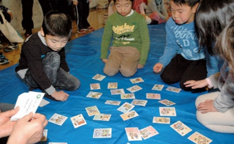
「絶対取るぞ」と意気込む子どもたち