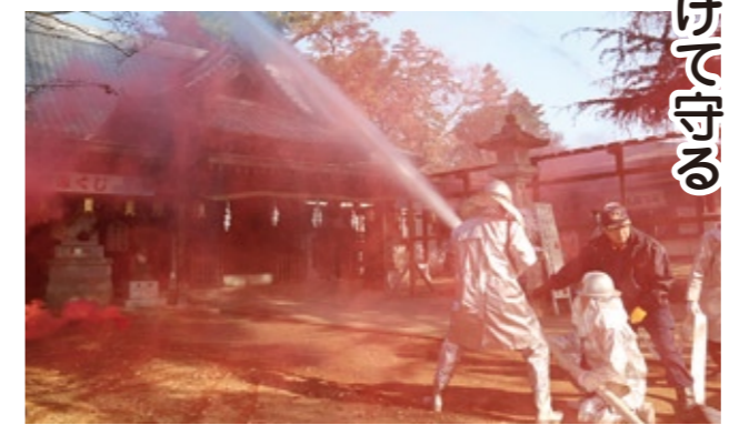
本番さながらの消火活動

また、強風による拝殿への延焼拡大を想定し消火訓練では消防団が本番さながらに放水し、迅速な消火活動が展開されました。