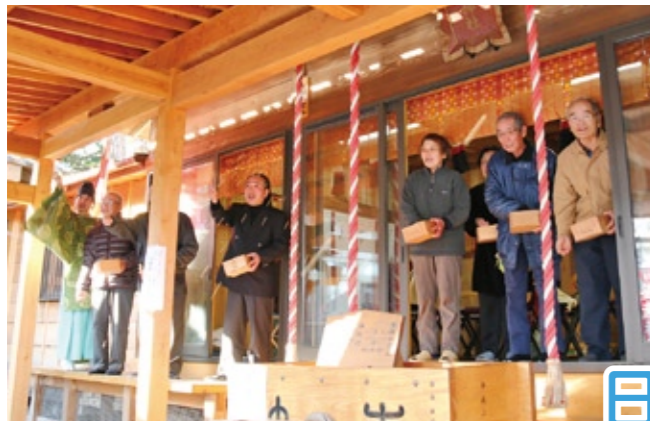
「鬼は外、福は内」と豆まきで厄払い

「日本一早い豆まき」が1月11日、市内本宗道の宗任神社で行われ、氏子などが豆まきで厄払いを行いました。