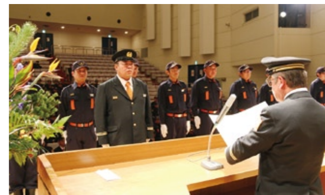
消防活動の功労者を称える表彰式