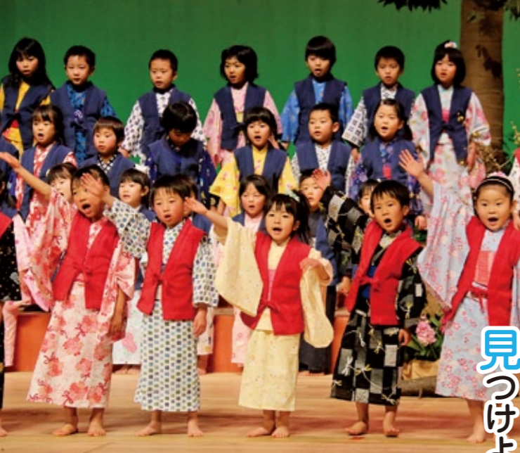
元気に歌やお遊戯を披露する子どもたち

幼少年の豊かな感性を育む活動に取り組む「わらべうた・あそびランド」が1月19日、市民文化会館で「第12回わらべうた・あそびランド大会」を開催し、市内の親子など約400名が集まりました。