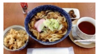
きのこうどんと鳥ごぼうの炊き込みごはん(飲み物付) 500円のランチ例

テーブル席は2人掛け2セットと4人掛け2セット、カウンター4席の計16席。100円でコーヒーや紅茶、ジュースなどがお替わり自由。火・土・日曜日の日替わりランチ500円は、カレーライスやきのこうどんなどが提供され、今後もメニューが増える予定です。