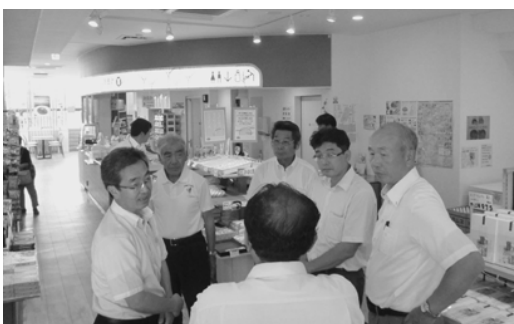
石川県かほく市での研修の様子

道の駅が東日本大震災時に円滑な応急活動を行うための重要な役割を果たしたことを踏まえ、この道の駅を地域防災計画の拠点施設として位置づけて整備しました。