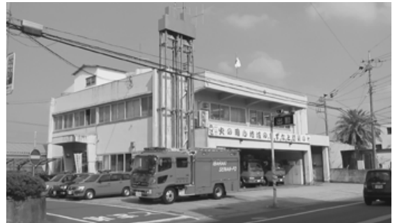
建築から47年を経過した下妻消防署

また、市のインフラ老朽化総合管理計画と消防署との関係で、前述の不都合な点も踏まえて、大規模修繕よりも十分な敷地を確保しての建替えが望ましいと考えているが、執行部の考えを伺う。