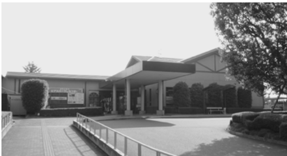
経営改善計画が進むピアスパークしもつま

また、道の駅の改修計画等についてだが、改修に多くの金額をかける必要はないが、売り上げアップのために必要最小限のリニューアルは必要だと考えている。そこで、改修計画があるのか伺う。そして、大胆な経営再建をするためには、対応できる人材の確保及び雇用、組織の抜本的な改革などソフト面からの改革が必要と考えるが、そのような決意があるのか伺う。