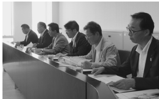
福岡県糸島市での研修の様子

療・介護などの関係機関との調整を行ったり、地域や福祉施設等とのつなぎを行うなど、再発防止のバックアップも行っていました。 また、ひとり暮らしの認知症の方などへの見守り活動は、要援護者台帳を整備し、社会福祉協議会により対象者の把握と定期的な見守りを行っています。さらに、見守り事業所として、電気、郵便、ガス、新聞など65事業所あり、非常に協力的に見守り活動を行ってかれているそうです。