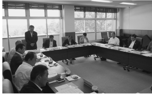
福岡県新宮市での研修の様子

より準備委員会を設立し、市ソフトボール協会と連携し、推進体制を整えてきました。これまでに国や県の補助を活用し、グラウンドや防球ネットなどの競技会場施設の整備を計画的に進め、昨年よりハーサル大会を開催しております。市民の応援体制においては、自治会を通じた市内各所における「花いっぱい運動」、小中学校においては、のぼり旗の作成及び試合観戦など、市民一丸となった大会へのバックアップをすることとしておりました。