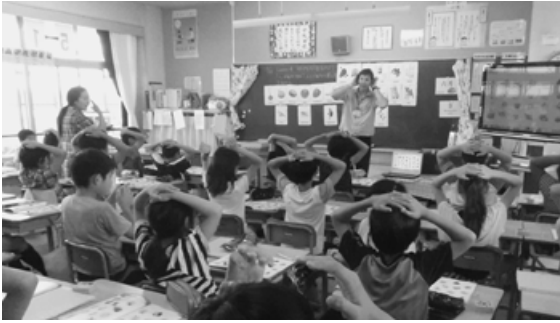
遊びを取り入れた英語の授業

課題としては、年間授業時数が少ないために、学習の連続性が保障されないことや小学校の教師の採用が英語を教えることを前提としていないため、発音等専門的な知識や技能を持ち合わせていないことである。教師の課題を克服するために、県内他市に先駆け、平成18年度から英語が堪能な日本人英語活動サポーターを採用している。