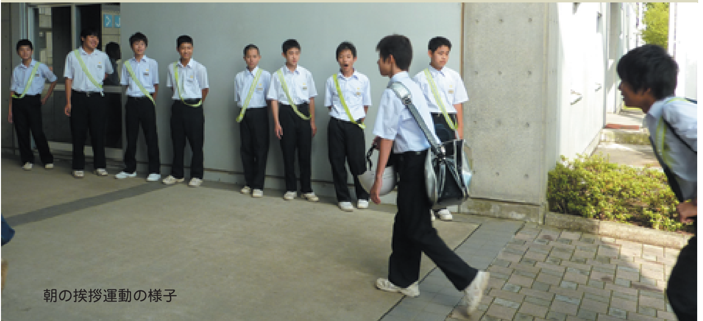
朝の挨拶運動の様子

“試合を楽しむ”を合い言葉に、常に自分達で考えながら練習に取り組み、県大会出場を目指しています。また、朝の挨拶運動にも積極的に取り組むなど、心身共に高め合っています。