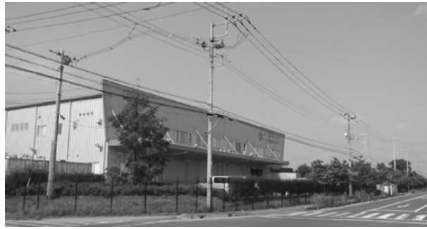
市内工業団地への企業進出が進む