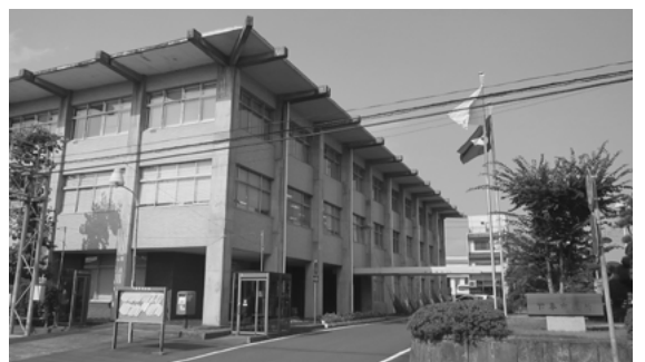
県西ナンバーワンを目指した行政運営を行っている

【部長答弁】 まちづくりの実現には、職員一人一人が積極性と創意工夫を持って事業に取り組みることが必要不可欠である。そのために、職員の柔軟で積極的な意識の向上を図るとともに、業務運営の