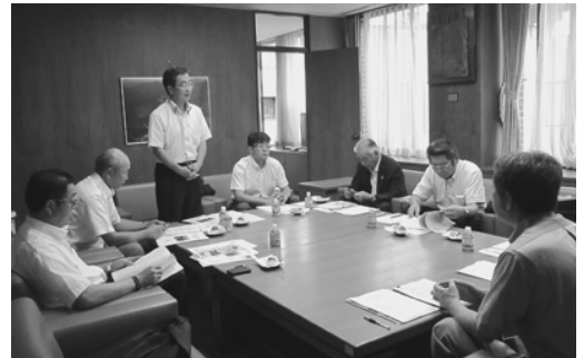
石川県白山市での研修の様子

まず、白山市では、「白峰地区中心市街地再整備計画」を視察しました。この事業は、市長からの諮問を受け、地元町内会、観光協会、住民代表などで構成された