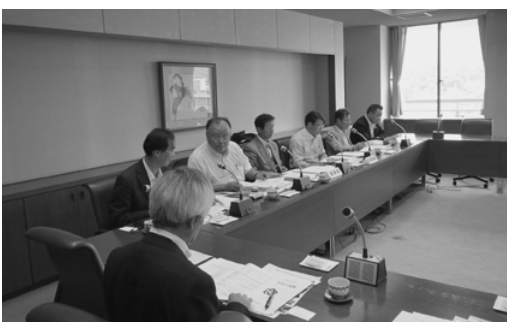
福岡県太宰府市での研修の様子

太宰府市では、子育て支援の取組について視察して参りました。太宰府市は、病気の回復期にある子どもを一時的に預かる「病児デイケアセンター」事業を市内の小