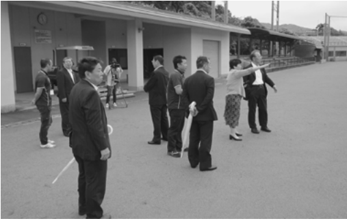
長崎県壱岐市での研修の様子

壱岐市では、今年10月に開催予定の第69回国民体育大会（ソフトボール）会場の運営準備状況について視察して参りました。壱岐市では、ソフトボールの専用球場を所有していたことから開催希望種目とし、国体開催に向け約5年前