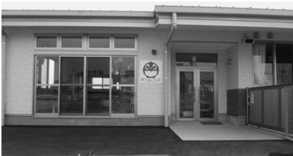
子育て親子の交流を図る「あうるくらぶ」

み育てる環境が整い、生き生きと働き続けられることが大切であり、本市においては、乳児保育の実施、一時預かり事業、障害児保育事業等、それぞれの保育所において多様なニーズに対応した保育サービスを実施しており、働く保護者の支援の充実を図っている。また、託児等の援助を受けたい者と援助を行いたい者を組織し、臨時的、補助的、突発的な託児希望に対しサービスを行うファミリーサポートセンター事業を実施している。また、医療福祉（マル福）制度の対象者が、小学6年生までだったものを、今年10月診療分より中学