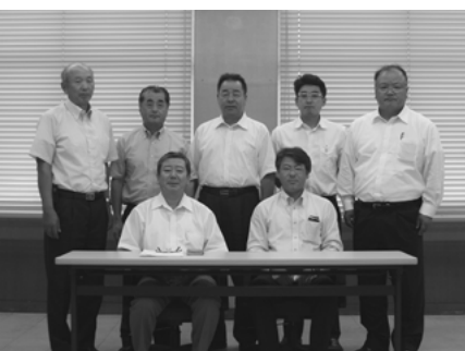
調査特別委員会委員

これまででは、任意の委員会である「中心市街地活性化調査委員会」として、砂沼エントランスや交流広場について調査・研究し市長へ提言書を提出するなど活動を行ってききましたが、引き続き都市再生整備計画事業に関して調査・研究する必要があると判断し、設置いたしました。