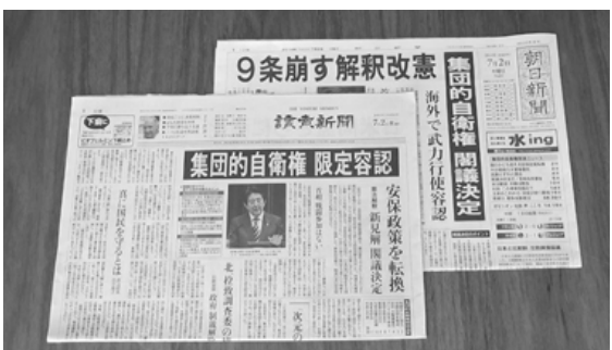
連日、集団的自衛権の報道がなされる