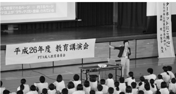
下妻中学校でのメディア教育講演会の様子

ており、学級懇談会や学級だよりを通じ携帯電話等の利用に関する家族でのルールづくりを呼びかけ、買い与えるときには、フィルタリングをかけるように強くお願いしている。