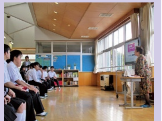
インターネットトラブルの防止策を学ぶ生徒たち (10月16日、千代川中学校で)

市では、消費者教育推進法に基づき、平成25年度から市内小中学校において「消費者教育」を展開しています。平成26年度に市内中学校で実施した消費者教育では、茨城県金融広報委員会の金融広報アドバイザーを講師に迎え、消費生活に必要な物資やサービスの適切な選択や購入について講演を行いました。近年パソコンや携帯電話等の普及に伴い、特に情報関連サービスのトラブルに巻き込まれるケースが増加しています。講演では、最近相談の多い事例がDVDの映像で紹介され、講師からは被害の未然防止に向けた具体的なアドバイスがありました。生徒からは「すごく身近な問題で、情報機器の使用による悪質な被害にあわないよう気をつけようと思いました。下妻市に『消費生活センター』があることを知りませんでした。被害にあつたらすぐに相談したいと思いました」などと感想が寄せられました。