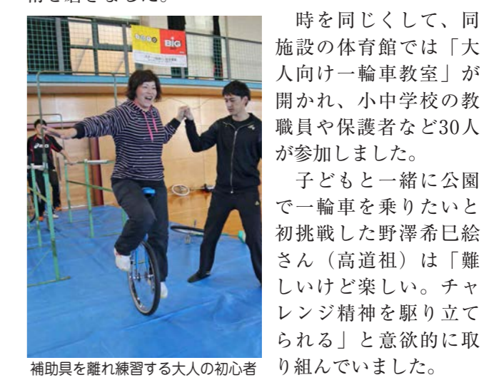
補助具を離れ練習する大人の初心者

バランスをつかみ始める初心者の児童 「第2回楽しい一輪車教室」が、市内村岡の筑波サーキットで開催され、市内小学校の児童108人が参加しました。初心者の児童は、補助具の手すりを使いながら、こぎ出し方やバランス感覚などつかむ練習に汗を流す一方で、一人で乗り出せる初級者の児童は曲がる練習や、オートレースの選手養成用コースのオーバルコースを自由に走り回るなど、日本一輪車協会から派遣された公認指導員にアドバイスを受けながら、技術を磨きました。