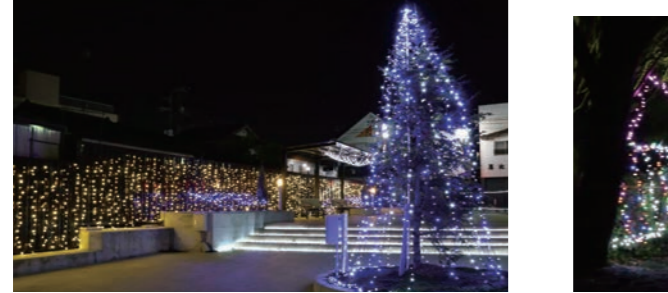
三道地ポケットパーク(1月中旬まで)