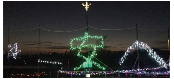
鬼怒フラワーライン(1月中旬まで)

毎年恒例となっている「やすらぎの里しもつま」「下妻駅前広場」「鬼怒フラワーライン」「観桜苑」のイルミネーションに続いて、新たに「三道地ポケットパーク」でもイルミネーションが点灯され、下妻にイルミネーションの輪が広がっています。