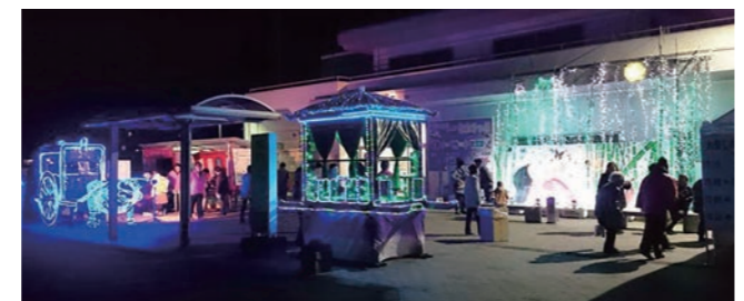
下妻駅前広場(1月中旬まで)