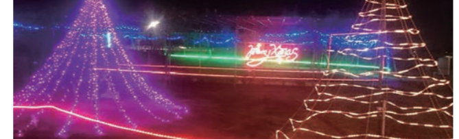
やすらぎの里しもつま(1月中旬まで)