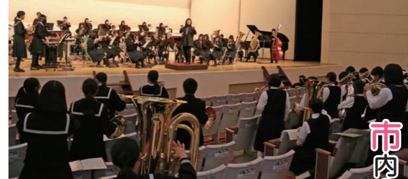
最高潮の盛り上がりを見せる5校合同演奏

市内3中学・2高校が迫力の合同演奏 下妻市中学校・高等学校合同演奏会 12月20日