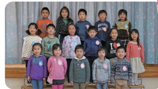
◀年長児（にし組）、年少児（はな組）の皆さん