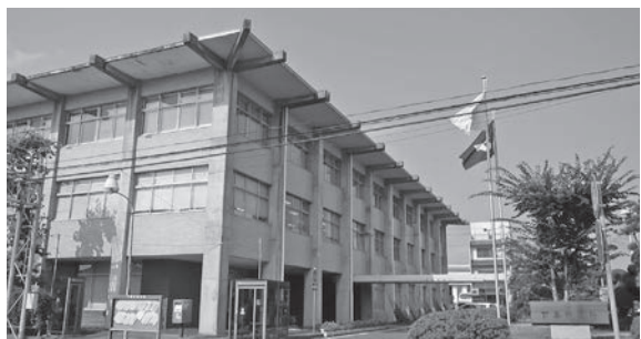
今後、平成37年度を最終期限とする庁舎建設に係る基本構想を策定していく

公共施設等マネジメント基本方針に公共施設の新規整備は原則として行わないとあるが、砂沼周辺地区都市再生整備計画事業は、基本方針の策定着手以前に計画されたものであり、基本原則の対象から除外している。また、交流広場(waiwidームしもつま)は来年度のオープンを予定して