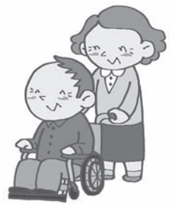
地域での老老介護や地域での老老介護などに対応していく見守りなどに対応する高齢者支援等

高齢化率が25%を超えた現在、高齢者が高齢者を介護する老老介護が問題となっている。老老介護がおこる理由は、核家族化により高齢者のみの世帯が増え、介護される側が自宅介護を望み、介護する側もそれに応じるためと考えられる。また、自宅介護を望む理由は、公的支援に抵抗を感じ自分たちだけで対処しようとする場合や、費用に不安がある、周辺に施設がないことなどが考えられる。老老介護で危惧されるのは、介護する側が病気になること、介護される側が病気になること、介護疲れによる虐待や無理心中などの事件に発展してしまうことである。介護保険サービスを利用していただければ、介護支援専門員やサービス提供事業者が関わることで周囲の協力を求めやすい環境ができ、必要な時に支援の手を差し伸べることも可能となる。しかし、外とのつながりを持たない家庭は、どこに協力・支援を求めればよいかわからない場合もある。そのような家庭をいかに見だし、支えていくのが課題である。本市の相談窓口は、地域包括支援センターである。一人暮らし高齢者の安否確認等も民生委員の協力のもと、さらなる周知をしていく。