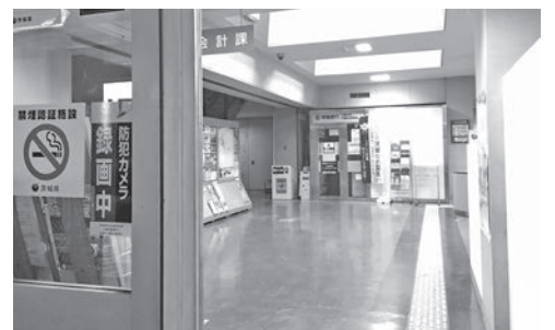
防犯カメラの設置をはじめ、職員研修などにより管理体制の強化に努めている

一般的にコンプライアンスとは法令遵守と解釈されるが、地方公務員には社会の要求や期待にこたえるため、公正性、透明性、誠実性、倫理性、遵法性などの、より高度な公務員倫理が求められている。本市においては、随時、職員に対し、綱紀の保持について注意を喚起し、市民の信頼を損ねることのないよう指導をしている。そのほか、外部から講師を招き、全職員を対象として昨年度は公務員倫理研修を実施し、本年度は危機管理研修を予定している。市