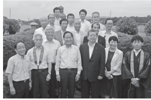
多賀谷左近三経公の墓前にて

カヌー、テント泊体験、天体観測、化学実験などの活動を行うことができる施設として整備されています。このような施設で未来を担う子どもたちが交流を図れるよう私たちが支援できればと思います。