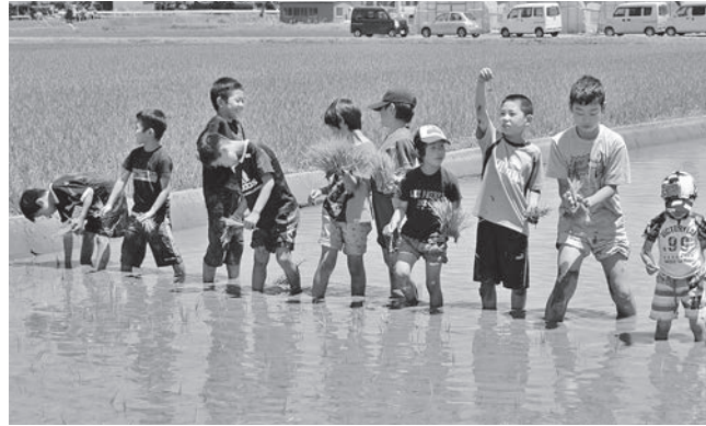
平成27年度に実施された「いいな下ツアー」の様子

下妻市と足立区とは、足立区千住が旧下妻街道の起点であったことや、つくばエクスプレスの開通により両自治体により身近になったことなどにより平成23年6月から約2年間、下妻市のアンテナショップとして「シモンちゃんの家」を設置していた経緯がある。防災に関する協定は、平成26年5月に足立区伊興南町会から、災害時に足立区と本市が相互に助け合う協定を結ぶことについて提案をいただき、その後、本市主催の「いいな下ツアー」などに参加してもらっている。また、足立区主催のイベントにおいて下妻産の農産物を販売