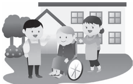
施設への入所待ちや要介護高齢者への対応が大きな問題となっている

今後は、平成37年度の地域包括ケアシステムの構築を見据え、長期的な視野に立ち、需要と供給、給付費と保険料等のバランスを総合的に判断し、地域の実情に合った計画を策定して、施設の整備等にあたりたいと考えている。