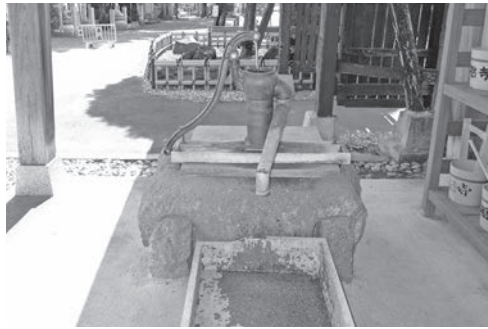
東日本大震災時に活躍した手押しポンプ

現在の本庁舎は昭和44年に建設され、平成9年に行った耐震診断では、防災拠点として求められ るIs値0.9を下回る0.4という数字が示されている。また、耐震診断から20年弱が経過し、東日本大震災による被災も考慮するとIs値はさらに低下していることが想定される。震度6強以上の地震で倒壊、崩壊する危険性があり、防災拠点としての機能マヒや、市民や職員が被災する可能性がある。また、防災無線のデジタル化への対応もできないなど、防災の面からも課題を抱えている状況である。庁舎建設の検討にあたり、建設位置、規模、公共施設の再編など課題があるが、災害に強い防災拠点の構築という観点は重要な要素である。今後、議員市民の意見等を十分に取り入れながら早急に検討していくものである。