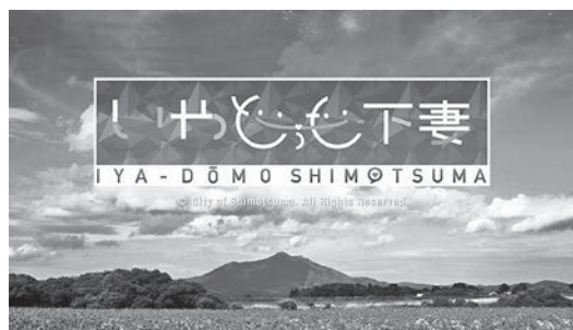
職員提案により実施された、下妻市公式フェイスブック「いやどうも下妻」

本市は、職員同士が活発に意見交換を行い、自由に意見を言うことができる風通しの良い職場環境であると認識している。その結果、職員の提案からさまざまな施策が実現し、下妻市公式フェイスブック「いやどうも下妻」の開設、企業誘致「梨・メロンの海外輸出」などは若手職員が主力となり、積極的に事業を展開し成果を上げていく。また、「下妻市職員の改善提案に関する要綱」により所管する業務以外でも提案すること