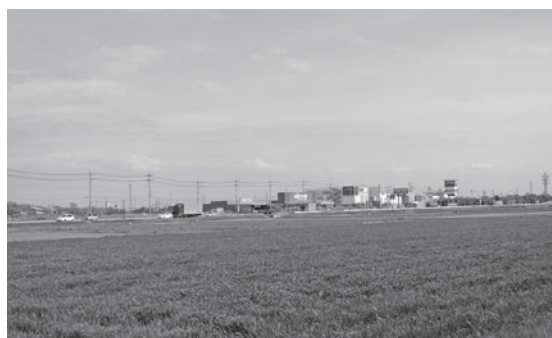
競輪場外車券売場の計画地となっている堀籠地区

当計画は、堀籠地区内のカインズホーム下妻店の近接地域に設置が計画されているもので、競輪場外車券売り場のほかに、ガンリンスタンド兼店舗、ビジ