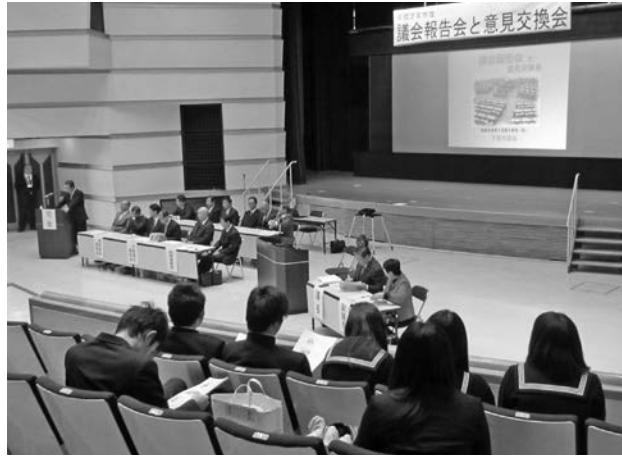
千代川公民館での開催の様子

動状況などを説明・報告した後、市民の皆様との質疑応答、意見交換を行いました。各会場には市内の県立高校の在校生の姿もあり、報告内容に熱心に耳を傾け、意見もだされていました。 報告会にご参加いただいた皆様、大変ありがとうございました。