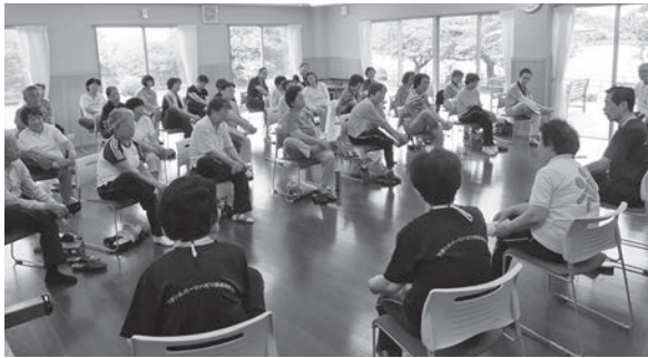
砂沼荘で開催されているシルバーリハビリ体操の様子

が、異議の申し立てもなく、8月に農用地からの除外が完了している。今後は、農地転用許可や開発行為許可などの申請、経済産業省の設置許可手続き等がされると思われるが、現在、申請書等の提出は行われていない。 今回の計画は、市が事業主体ではなく、民間事業者による設置計画であり、交流人口の増加や雇用促進をはじめとする地域経済にもたらす効果なども考えられるが、建設反対の申し入れもあることから、今後の推移を見ながら、慎重な判断のもとで考えをまとめていきたい。