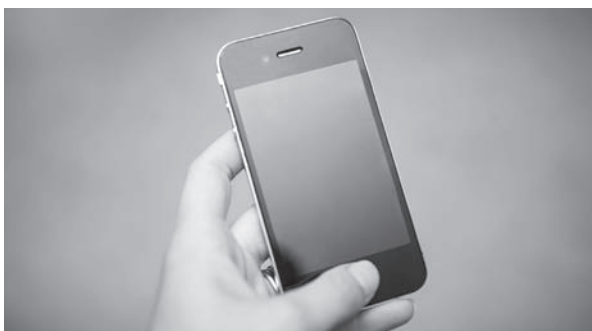
情報伝達的手段として携帯端末の活用が求められている

るため、導入は考えていない。また、本市では、災害情報の伝達手段である防災行政無線について、屋外スピーカーからの放送を補完するものとして戸別受信機及び防災ラジオを使用しているが、新たに防災行政無線メール配信の整備を行う予定である。これは登録された携帯電話やスマートフォンの防災行政無線の放送内容を配信するもので、文字で見ることがより確実に情報の伝達ができるものである。スマートフォンを活用した情報提供は、国の補助金などを積極的に活用しながら伝達手段の拡充に努めていきたい。