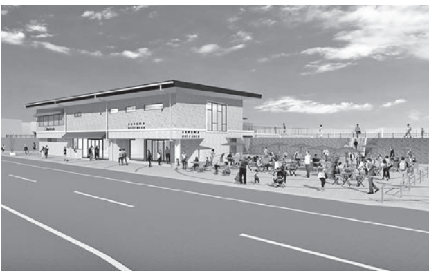
平成29年度オープン予定のさん歩の駅サン・SUNさぬまのイメージ図

この事業の目標値として、砂沼周辺で開催されるイベント集客数(13%増)、休日の日中における駅からの歩行者数(19%増)などの交流人口の増加を設定している。また、平成27年度策定の「下妻市まち・ひと・しごと創生・総合戦略」で