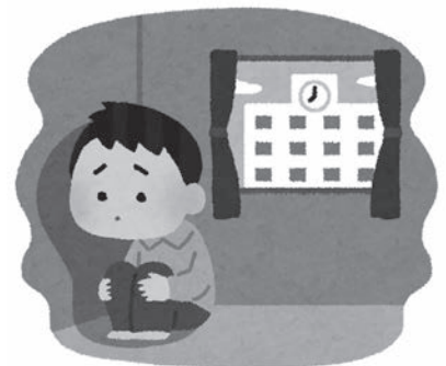
ひきこもりを含めた各種相談に保健師等で対応している

介護保険制度の見直しで、要支援1と2の介護保険利用者が、平成29年4月までに市町村