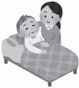
地域の実情に合わせたサービスを求められている

サービスとデイサービスを新たな地域支援事業に移行するもので、自治体は、受け皿となる介護サービス事業者の指定基準や報酬等を現行より緩和、あるいは下回る形で多様な担い手の参入を促し、介護費用を抑えることも可能とされる。 本市では、新たな事業の移行における混乱を避け、継続的なサービスができるよう、開始当初は従来の指定事業者に現行相当のサービス提供を依頼することで今までどおりの利用者の対応できると考えている。また、新しい地域支援事業では、現行相当のサービス以外にも緩和した基準によるサービス層があり、地域の実情に合わせて実施することができると、事業者や実施希望する団体との調整等を行い、検討していきたい。