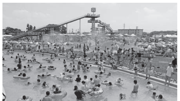
夏には多くの来場者で賑わう砂沼サンビーチ

県から市に無償譲渡された平成21年度以降、採算目標入場者数を達成した年数は8年間のうち5年である。採算目標入場者数は入場者客単価や、警備業法の改正、人件費の高騰等から見直しを行い、現在は14万人である。また、目標を達成できない要因として、天候の影響が一番にあげられる。