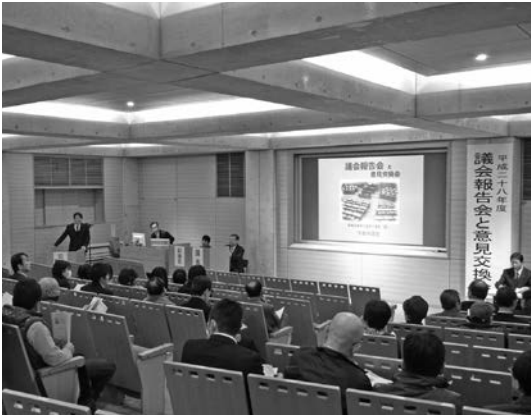
市立図書館での開催の様子

下妻市議会では、12月18日（日曜日）午前10時から下妻市立図書館において、午後3時から千代川公民館において、議会報告会と意見交換会を開催しました。