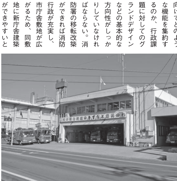
開庁から50年近く経過する下妻消防署

する建物で、昭和42年に開庁し、現在の耐震基準を満たしていないことから、防災拠点として耐震性に優れた消防庁舎の必要性が生じている。