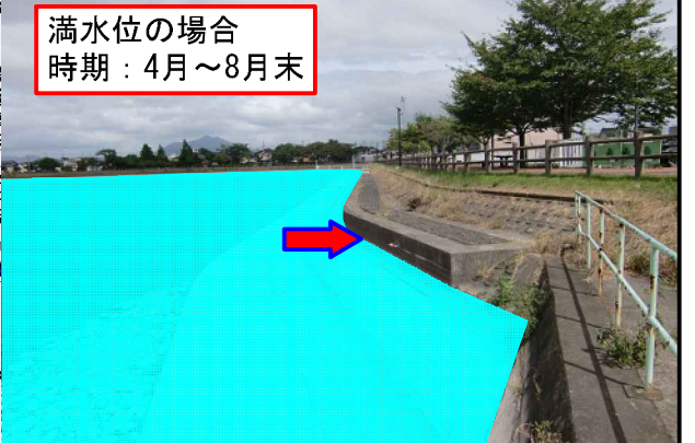
満水位の場合 時期：4月～8月末