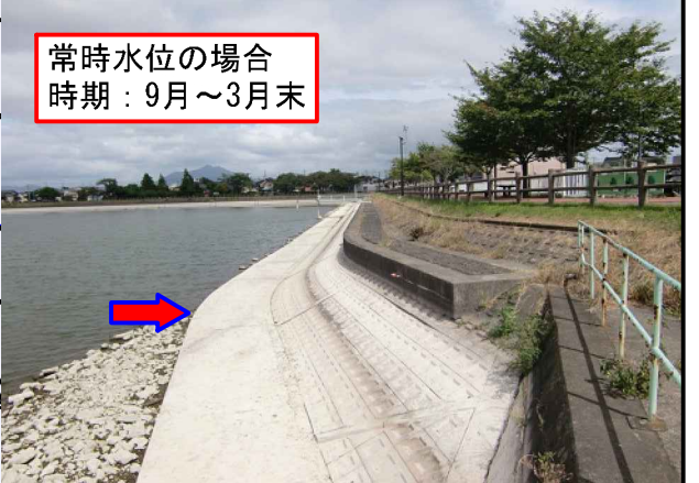
常時水位の場合 時期：9月～3月末