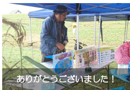
ありがとうございました！