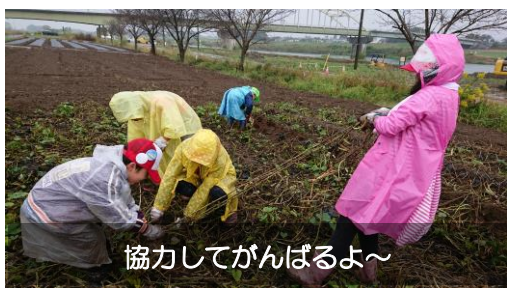
協力してがんばるよ～