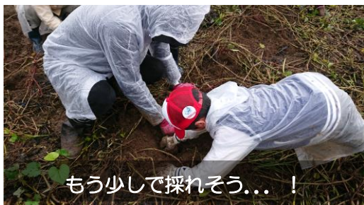
もう少しで採れそう...！