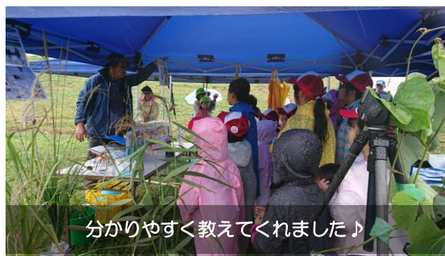
分かりやすく教えてくれました♪