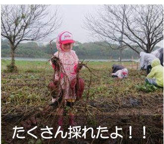
たくさん採れたよ！！