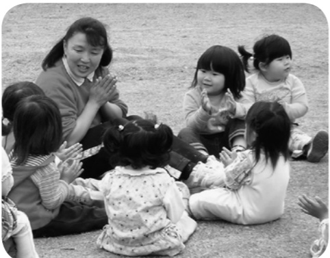
写真は保健センターで実施している「のびのび遊びの広場」「びよびよ教室」「マタニティ・クラス」の様子