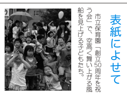
市立保育園「創立50周年を祝う会」で、空高く舞い上がる風船を見上げる子どもたち。