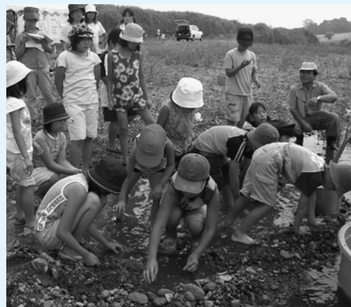
写真は昨年の観察会の様子

市の行事、まちで見かけたり聞いたりした、わだいのページです。 （ニュースは、広報） （広聴係内線202）まで