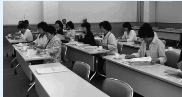
▲茨城県女性プラザ「レイクエコー」にて、男女共同参画社会の形成に向けての取り組みや、施設概要の説明に熱心に耳を傾けるまちづくり女性スタッフ

また、麻生町の茨城県女性プラザ「レイクエコー」も視察してきました。美しい自然に囲まれた建物や職員の丁寧な対応のためか、女性館長ならではのと思わせるような清潔さや優しさが感じられる施設でした。