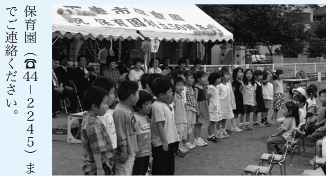
保育園（☎44-12245）までご連絡ください。

子ども達を預けることができ、すばらしい環境です。」というあいさつがありました。続いて、ゆり組（年長組）の園児が「たんじょうびの歌」を合唱し、記念樹を植えました。第2部の筑波大学マジシャンクラブによるマジックショーでは、目の前に繰り広げられる不思議な世界に、園児たちの目は驚きに満ちていました。*記念誌を希望の方は、市立