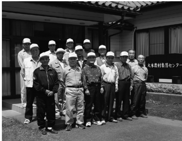
上：下妻警察署中崎生活安全課長による講演 下：大木地区では5月9日に出発式が行われた