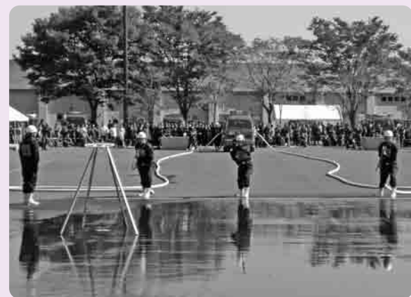
機敏な動作で競技に取り組む消防団員

10月28日、茨城県消防ポンプ操法競技県西地区大会が、昨年引き続き、広域中央運動公園(古河市)イベント会場において開催されました。この大会は、今年で58回目を迎え、10市町村の消防団の代表者のみなさん