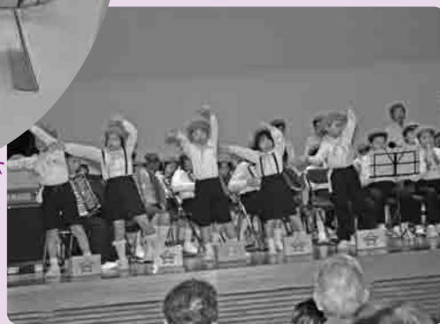
全児童による音楽発表会(蚕飼小)

友だちを誘ってチャレンジしてみようなどと話していました。ぜひ、みなさんも受講してみませんか。お待ちしております。