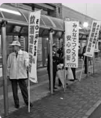
交通事故と犯罪のない安全なまちづくりを目指します