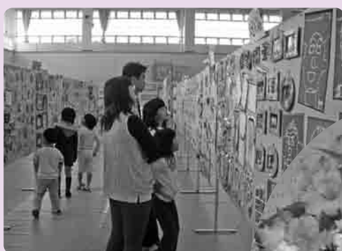
力作ぞろいの作品を見る親子