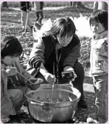
芋がたくさん入っているけんちん汁