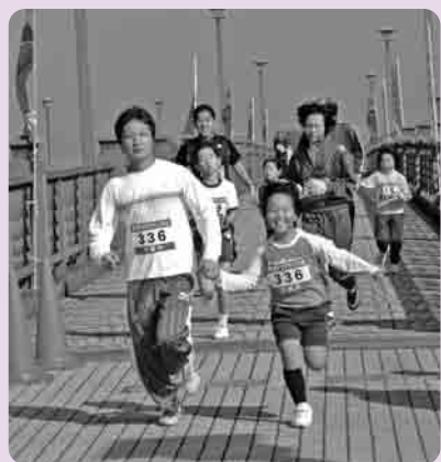
お父さんと一緒に手をつなぎゴールへ

また、今年からボーイスカウト下妻第1団のみなさんがスタッフに加わり、選手受付や会場内の清掃作業などに協力してくれました。大会を支えるスタッフの輪も広がりを見せています、みなさんご苦労さまでした。来年は、節目の20回目の大会になります、ぜひ参加してみてくださいはいかがでしょうか。