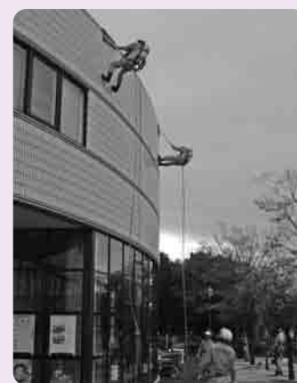
人命救助をするレスキュー隊員