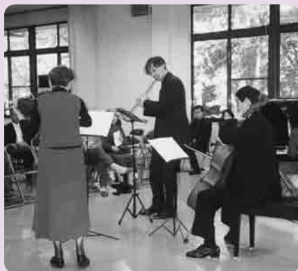
素敵な音色を奏でる マルグリッド・フランスのみなさん

11月4日、市民の会上妻支部主催による、第1回上妻コンサートが市民センターでおこなわれました。