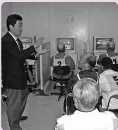
熱心に聞き入る受講者のみなさん

11月5日、下妻警察署主催による第1回いきいきシルバードライバーセミナーが、茨城県自動車学校校境校を会場におこなわれました。