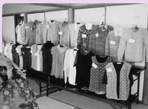
婦人の家で受講する手編み

化祭が働く婦人の家でおこなわれました。力作ぞろいの作品が会場いっぱい展示され、来場されたみなさんは、作品を見ながら、「私も来年は、