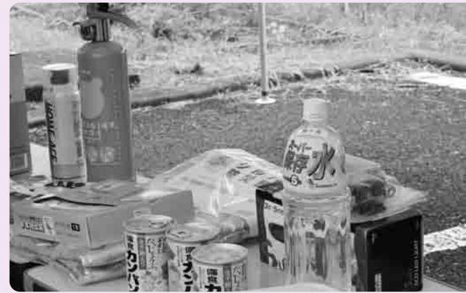
災害に備えての準備をしておきましょう

特集 みなさんのご家庭では、災害に向けての備えはいかがですか 自分と家族の身は、自分たちで守ろう