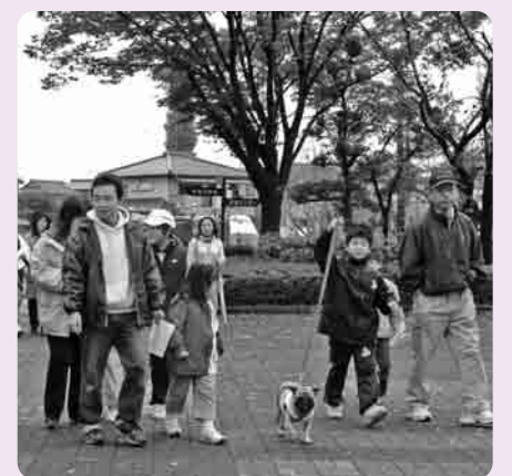
防災訓練に参加する市民のみなさん

下妻市では、災害に備えて自主防災組織をつくることを支援しています。日本の気候は、温暖で過ごしやすいものの、梅雨期の長雨や台風による暴風雨により、風水害・土砂崩れなどの自然災害が頻発しています。また、地球上で発生する地震の約20パーセントが日本で発生しているといわれ、わが国はまさに地震大国と言えるでしょう。このような場合、大地震・暴風雨による災害が発生した場合には、市役所・消防署などの防災関係機関が総力をあげて防災活動に取り組みますが、このような大規模災害による被害は、人的被害、火災、停電、道路の寸断、電話の不通など、さまざまな被害が同時に発