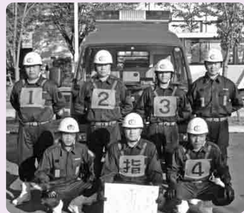
第6分団(蚕飼・四ヶ村)の選手のみなさん

んが参加し、操作の所要時間や行動動作などを競い合うものです。本市からは、第6分団(蚕飼・四ヶ村)の選手のみなさんが出場しました。選手や団員のみなさんは、「日ごろから市民の生命と安全を守るため訓練していただいていることに感謝します。日ごろの練習の成果を発揮し、いざというときのために備えていただきたい」と、市長はじめ市議会議長、団長から激励の言葉を受けて、この大会に挑みました。審査員の「操法開始!」の合図でスタートし、自分の役割をしっかりとマスターし、機敏な動作で競技に取り組む、競技終了とともにグラウンドいっぱい大きな拍手や歓声がありました。