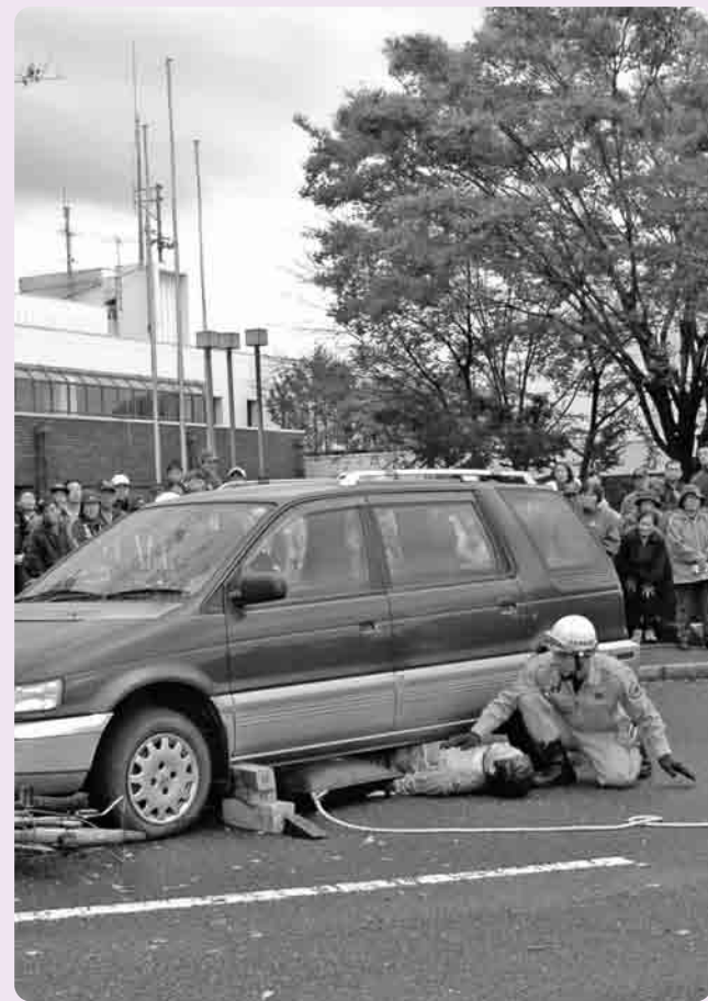
交通事故の救出訓練

10月28日、茨城県消防ポンプ操法競技県西地区大会が、昨年引き続き、広域中央運動公園(古河市)イベント会場において開催されました。この大会は、今年で58回目を迎え、10市町村の消防団の代表者のみなさん