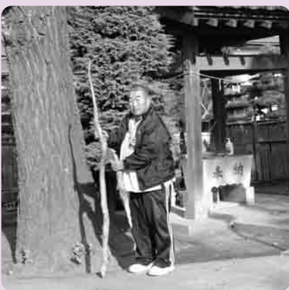
大きな自然薯にビックリ！

立ち木の移動作業中、掘削をしていると、山芋らしきものを発見。傷をつけないよう、手で土をかき分け、丁寧に掘り上げると、なんと1メートル96センチもありました。こんなに大きな芋は、見たことがないと、近所の人たちもビックリ！何年もの間、土の中で生育していたのでしょうね。