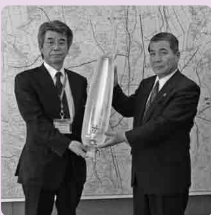
防犯灯15基寄贈される