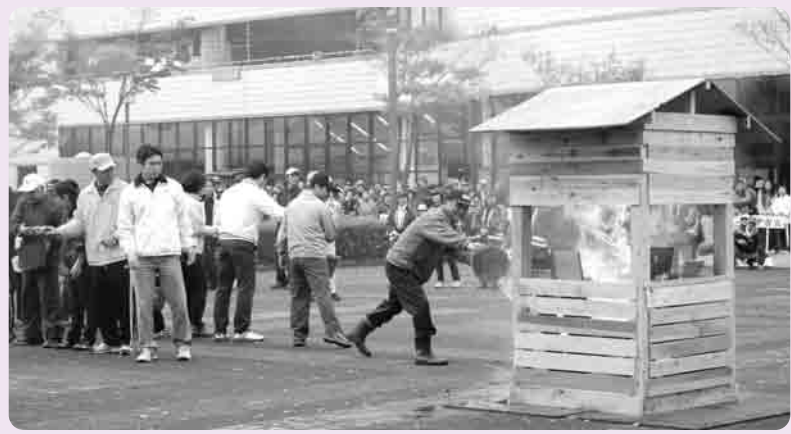
バケツリレーでの初期消火訓練

この写真は、小貝川ふれあい公園で、親子そろって芋煮会に参加し、けんちん汁に、身も心もそして体の中まで温まる様子がレンズいっぱいになり、シャッターを押しました。