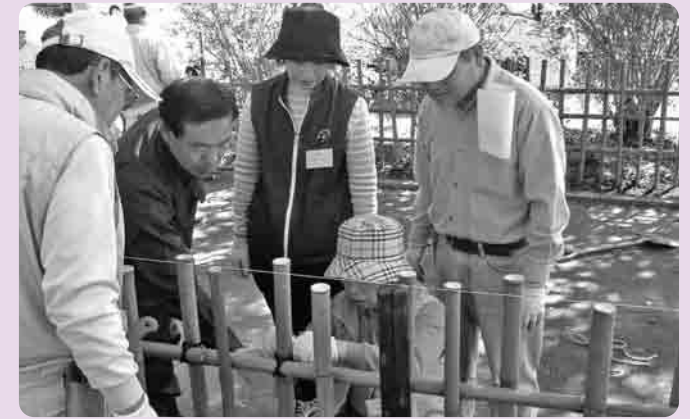
「からみ結び・いぼ結び」にチャレンジする受講生

下妻公民館庭師教室では、10月21日に、竹垣(四つ目垣)つくり実践を、市内の本宿公園でおこないました。四つ目垣とは、四方に組んだ竹をシユロ縄で「からみ結び、いぼ結び」により結わく方法です。当日は14名の受講生の手によって、約17メートルの四つ目垣が製作されました。この教室では、「庭木を自分で手入れする」を目標に、プロの庭師の手ほどきを受け、年間を通して学んでいます。