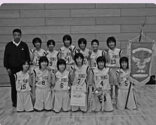
東部中学校女子バスケットボール部のみなさん

県大会初優勝ということでも部員、保護者ともに大喜びする様子が印象的でした。優勝するまでには、4試合ありましたがいちばん白熱した試合は準決勝で、最後の1秒まで予断を許さぬ展開となり、3点差での勝利でした。この試合の勢いに乗り決勝では、16点差をつけての勝利となりました。初優勝おめでとうござい