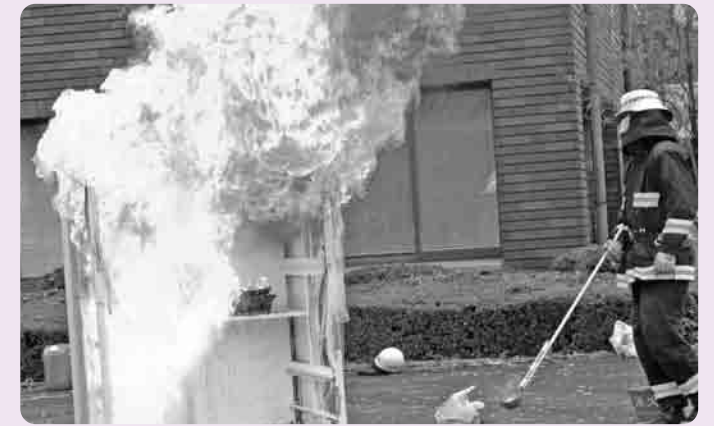
天ぷら油火災実験

下妻市では、災害に備えて自主防災組織をつくることを支援しています。日本の気候は、温暖で過ごしやすいものの、梅雨期の長雨や台風による暴風雨により、風水害・土砂崩れなどの自然災害が頻発しています。また、地球上で発生する地震の約20パーセントが日本で発生しているといわれ、わが国はまさに地震大国と言えるでしょう。このような場合、大地震・暴風雨による災害が発生した場合には、市役所・消防署などの防災関係機関が総力をあげて防災活動に取り組みますが、このような大規模災害による被害は、人的被害、火災、停電、道路の寸断、電話の不通など、さまざまな被害が同時に発