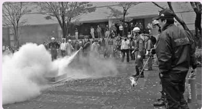
消火器を使つての消火活動

が参加し、バケツリレーでの初期消火訓練をおこないました。また、天ぷら油の加熱により火災の起こる状況を再現し消火器や濡れタオルなどでの消火をおこない、消火方法を間違えて、水をかけて消火しようとすると、炎が大きくなり、周りに油が飛び散り火災の拡大や大やけどをまねく場合があるなどの事例も紹介され、台所を扱う主婦のみなさんは、熱心に消火活動に参加。また、レスキュー隊による救出救助訓練などもあり、建物内に取り残された住民の救出をおこなうため三連はしごを使用して2階へ進入し、要救助者を発見確保し、屋上より斜めに張ったロープで建物の外に救出をおこない、参加されたみなさんは、本番さながらの訓練に、一瞬にして鎮まり、固唾を