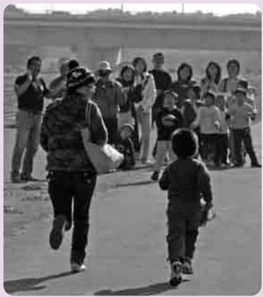
ボク、おかあさんといっしょにかけっこしたよ！