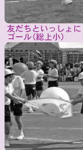
ボールはおとさないように(総上小)