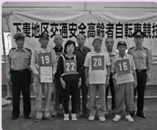
優勝した下妻東支部チームのみなさん