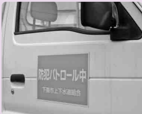
安全・安心なまちづくりに取り組みます 上下水道組合防犯パトロール

市民のみなさんも、「地域の安全は自ら守る」という意識を持ち、安全・安心なまちづくりにご協力をお願いします。