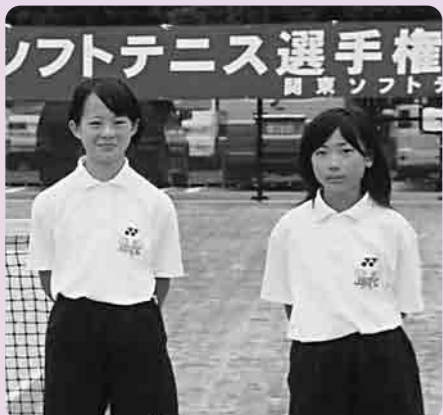
ベスト8に輝いたソフトテニスの選手