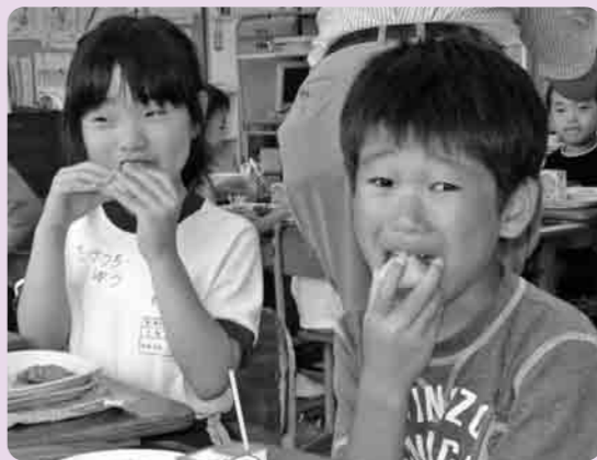
甘い大きな梨を“ガブリ”

市内の千代川地区の大形、宗道、蚕飼小学校3校において、9月19日、合併後初の地場農産物導入給食がこなわれました。