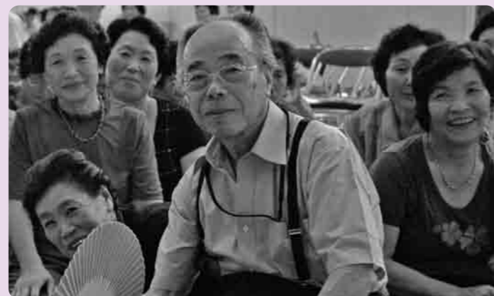
友だちといっしょに、いきいきと