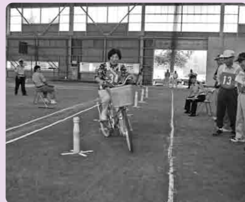
ジグザグ走行むずかしいなあ