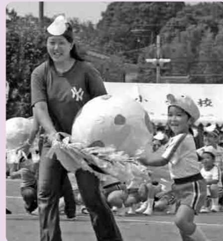
お母さんといっしょにゴールをめざして(上妻小)