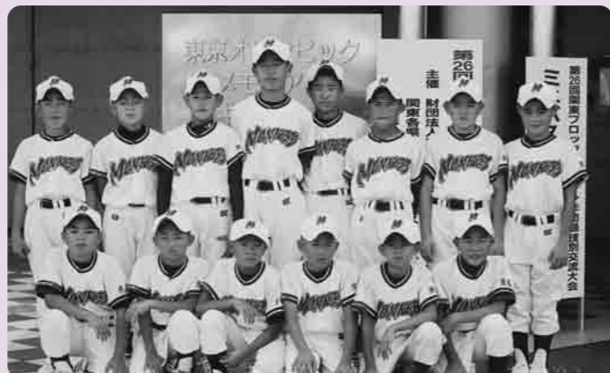
宗道ニューモンキーズのみなさん(準優勝)