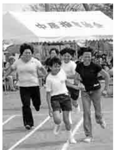
秋晴れのもと、各小学校で秋季大運動会がおこなわれました。総上小学校での競技の一コマで、おかあさんを気づかいながらゴールする親子にカメラを向けました。