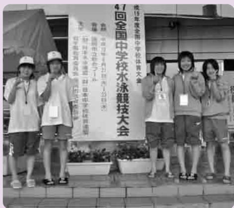
全国大会に出場した選手のみなさん

千代川中学校水泳部が8月21日から23日にかけて、岩手県盛岡市の盛岡市民総合プールにおいて開催された、第47回全国中学校水泳競技大会