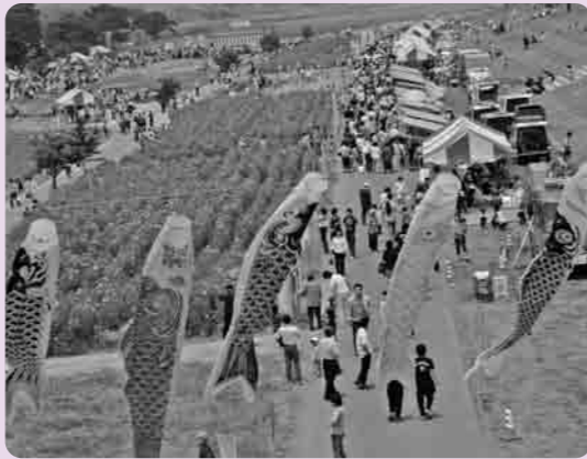
花畑一面にポピーの花が咲き誇る鬼怒フラワーライン

「花のまちしもつま」をキャッチフレーズに花を生かしたまちづくりに取り組む下妻市がこのほど、2007年度「花の観光地づくり大賞」(社団法人・日本観光協会主催、国土交通省など後援)の「フラワーリズム賞」を受賞しました。 日本観光協会では、花の名所や景観を整備する「花の観光地づくり」事業を推進しており、花の観光地づくり大賞は1999年度に創設。地域の観光振興に花を咲かせて貢献している実績を評価して毎年、対象となる自治体や市民団体などを選考しているものです。