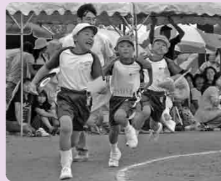
友だちに負けないように(上妻小)