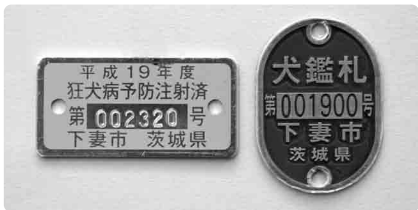
犬の身分証名書の役割をするものです