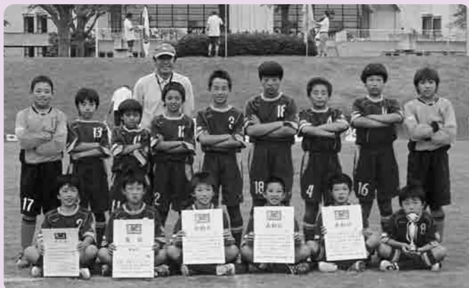
下妻サッカーのみなさん(第4位)