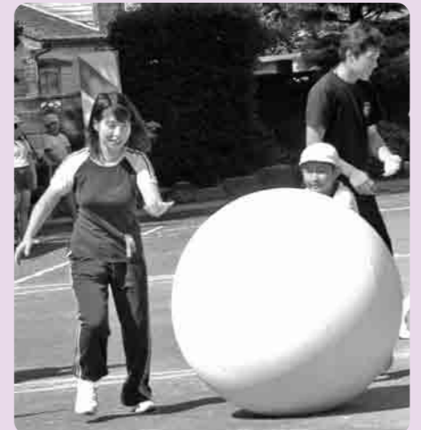
お母さん 早く!(蚕飼小)

市内の各小学校では、9月15日、16日に運動会がおこなわれました。当日は、朝から快晴となり、秋空の下、朝からとても蒸し暑く、今まで一生懸命練習してきた児童たちは、汗だくになりながら競技に取り組んでいました。 日陰を見つけては、定位置を確保して、応援に撮影に大忙しのお父さん・お母さん。また、全児童が少数の小学校では、おじいちゃん、おばあちゃんとの競技種目も多く、家族全員で参加する運動会となりました。 また、プログラムには小学校1年生や6年生の親子での競技もあり、最後の運動会に参加したお父さんは、おあさんといっしょに取り組んでいる我が子を小学生のいい思い出にして、一生懸命ビデオに納めていました。 また、地区対抗リレーでは自分の地区への応援に声を張り上げて、全員が一体となったの運動会となりました。これを機に、今まで以上に、親子の絆が、そして地域の絆が深められたことでしょう。