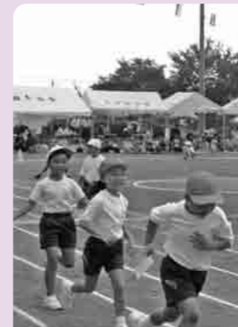
友だちといっしょにゴール(総上小)