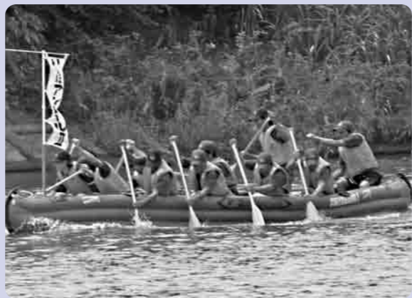
大粒の汗をかきながら“1・2、1・2”と

参加された各チームは、大粒の汗をかきながら、素晴らしい水辺空間の自然の中で、大いに交流を深め、自然に親しみ、暑い夏の日の一日を楽しく過ごすことができ、思い出に残る一日になったことと思います。