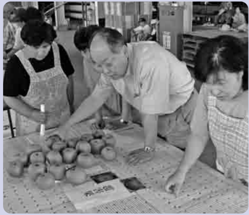
選果場への持ち込み基準などを確認し合う生産者

先ごろ、下妻梨共同第一選果場(大木)において、幸水梨の出荷を前に目揃え会が開かれました。市内の梨生産者約150名が参加して、JA担当者から選果場への持ち込み基準についての説明を受けました。この目揃え会は、集荷直前に、生産農家全員で梨見本を見ながら選果場への持ち込み基準や出荷規格の確認をおこなっているものです。今年も、5月の降ひょうにより大きな被害が発生しましたが、その後は日照に恵まれ、例年以上に甘い幸水なしが出荷されました。選果場では、9月に「豊水」・「あきづき」、10月に「新高」が、それぞれ出荷されます。