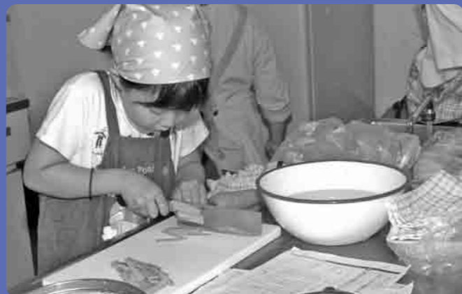
にんじん上手に切れましたか

食事バランスガイド あなたの食事は大丈夫 食事バランスガイドとは、1日に“何を” “どれだけ” “食べた”らよいかが一目でわかる食事の目安です。 ①主食、②副菜、③主菜、④牛乳・乳製品、⑤果物の5グループの食品を組み合わせてバランスよくとれるよう、それぞれの適量をコマのイラストでわかりやすく示しています。