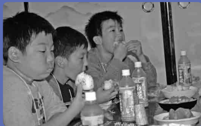
口いっぱいにおいしい!

酪農体験 動物を介した食を体験 酪農家での体験学習は、エサやり、糞掃除、搾乳とひととおり酪農の作業を体験した後に、“搾りたての新鮮な牛乳をいただき、臭みがなく、味が濃くて、おいしかった”などと声をはずませて話す子どもたち。 市場見学 届ける仕事の重要さに納得 そのような野菜を消費者に届ける仕事を勉強しました。都内の“足立