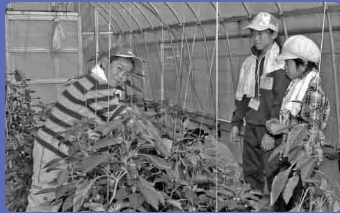
大きなピーマンにびっくり