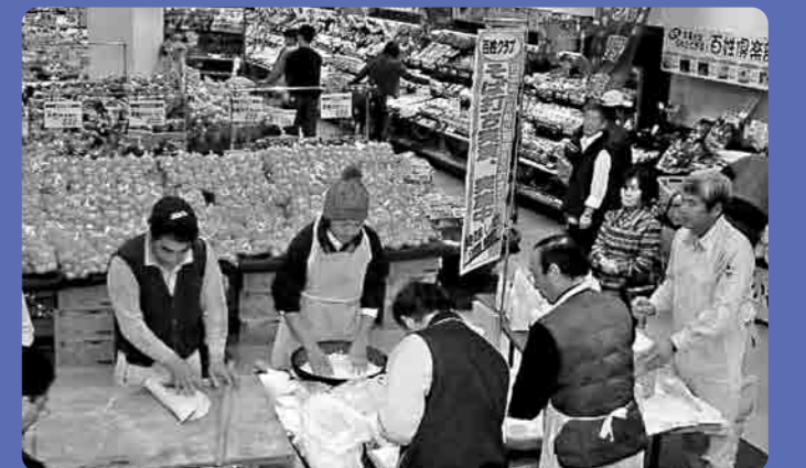
スーパーでのそば打ち実演