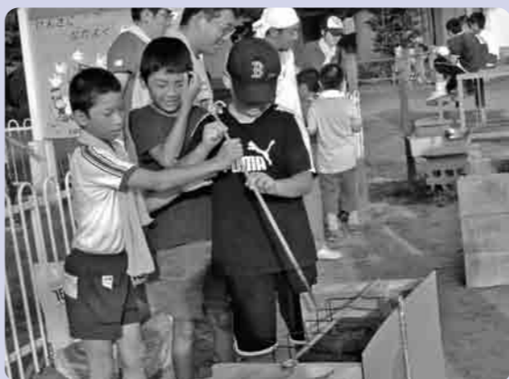
耳をすましてごはんの炊き具合を友だちとじっくり

その後、全員で体育館に宿泊し、次の日の朝食は、カンパン等の非常食を食べるなど、実際の災害時と同じ非難生活の体験をおこないました。「とばのえっ子くらぶ」は、地域の大人の手で健全な地域の子どもたち