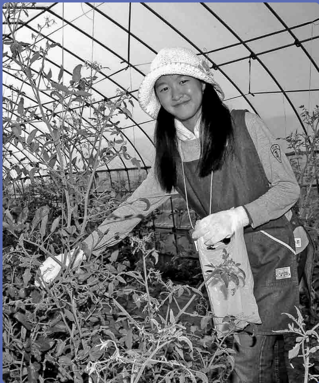
収穫の喜びを体験

スーパーやコンビニエンス ・ストアで24時間いつで も自分の食べたい時に、自分の 好きなものが買って食べられる 時代だからこそ、食べ物がどの ように作られ、どのような人た ちの働きがあつて、私たち消費 者に届けられているのか、知っ て欲しい。そんな思いから開催 された今回の食育体験学習。3 日間のさまざまな経験から、参 加した子どもたちは何を感じ取っ たでしょうか。