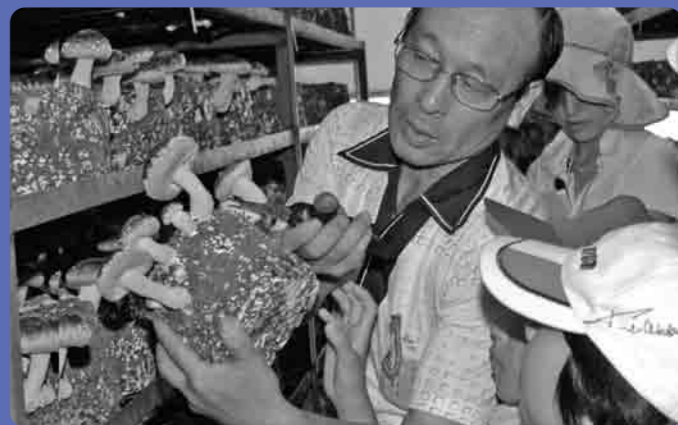
はさみの入れ方の指導

酪農体験 動物を介した食を体験 酪農家での体験学習は、エサやり、糞掃除、搾乳とひととおり酪農の作業を体験した後に、“搾りたての新鮮な牛乳をいただき、臭みがなく、味が濃くて、おいしかった”などと声をはずませて話す子どもたち。 市場見学 届ける仕事の重要さに納得 そのような野菜を消費者に届ける仕事を勉強しました。都内の“足立