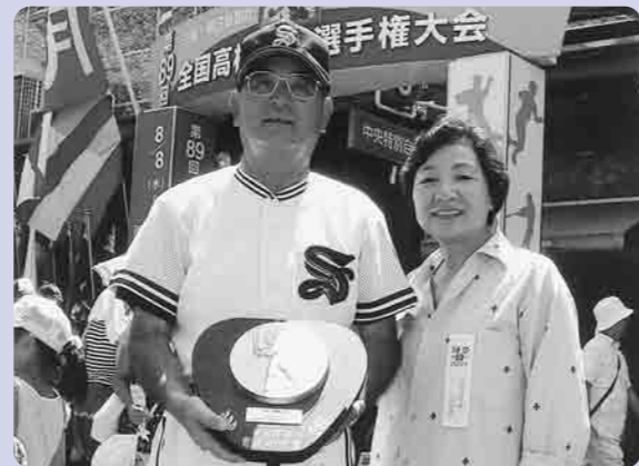
奥様といっしょに栄ある受賞おめでとうございます