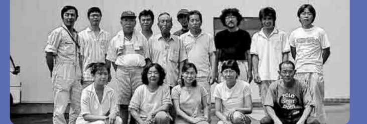
安全で新鮮な野菜やくだものを育てる百姓倶楽部のみなさん