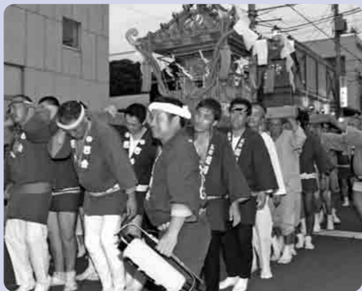
“セヤ!”“セヤ!”と掛け声合わせて

今年10回の節目を迎えることができたことに感謝し、下妻でこの夏まつりを、これからも20年、30年と続けていきたいと、願いを一心にし、幕が閉じられました。