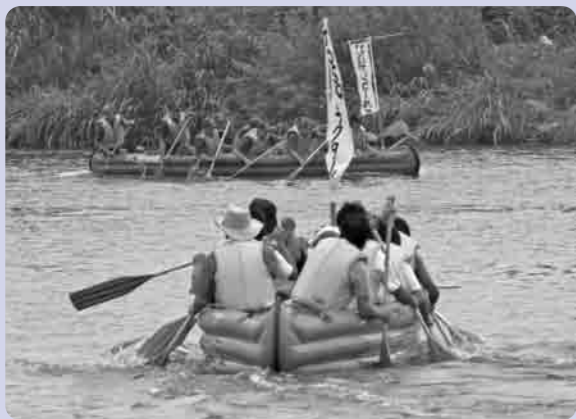
ただいま漂流中です