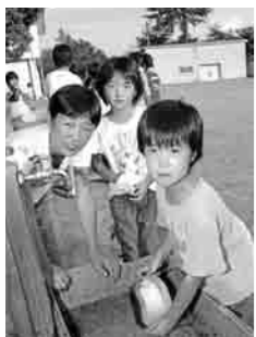
この写真は、災害生活体 験のひとつまで、お姉さん たちといっしょに、米とぎ などをする「とばのえっ子 くらぶ」のみなさん。