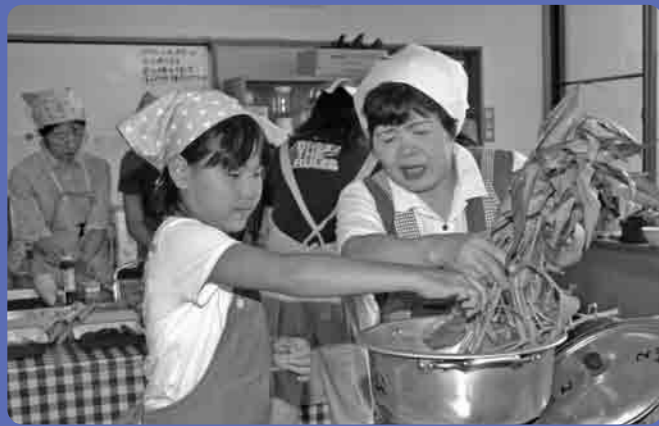
クウシン菜はこのように入れるのよ