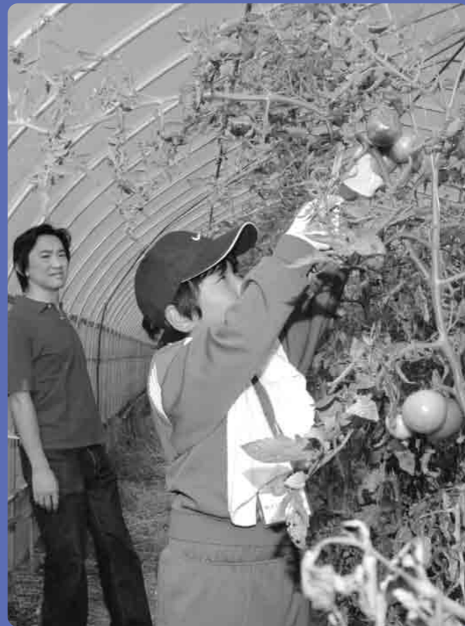
背伸びをしてトマトを収穫