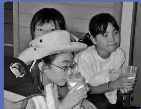
搾りたての新鮮な牛乳のお味はいかがですか

市場“では、段ボール箱に入った野菜の数に、そしてたくさん仲買人が手でサインを送る競りの様子にビックリ。”品物をまとめることで輸送コストを抑え、消費者のニーズに応えてたくさんの青果物を取り扱っている“という説明に、聞き入っていました。