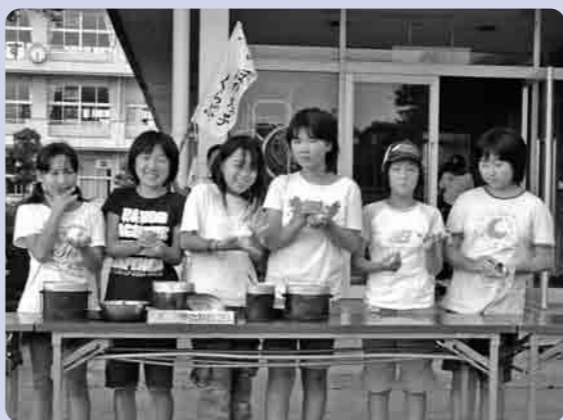
炊きたてのおにぎりの味はいかがですか

今回の災害生活体験は、下妻市が大きな水害の被害にあった時のことを学んだり、実際に水害や、地震が起きたときの生活を1泊2日で体育館に宿泊体験し、日頃から災害への心構えや、災害時の対応を学ぶという目的で実施されました。子どもたちも、今回の事業を通して、改めて災害の恐ろしさや、被災された人たちの生活が大変であることと実感したようです。この事業を機に、各家庭でも災害に対する備えや、災害時の対応について考えましよう。