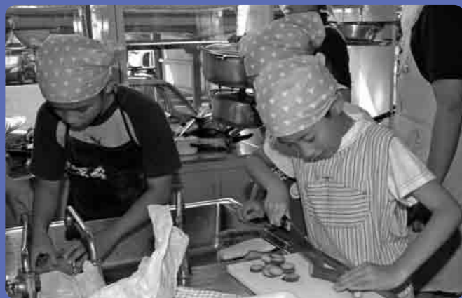
きゅうり切りにチャレンジ