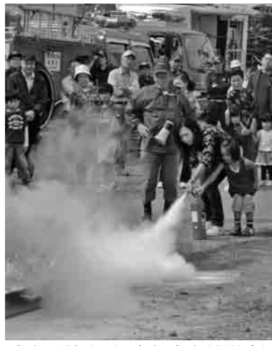
消火訓練（長塚東部自主防災会）

下妻消防署では、消火訓練や救急救命講習のお手伝いをしています。自主防災組織等で訓練を実施するときは、気軽にご相談ください。