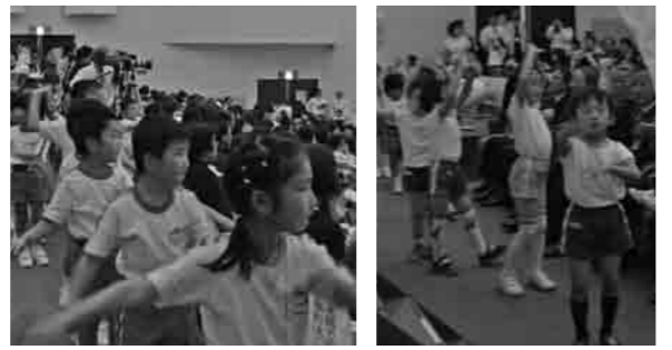
客席で園児たちが下妻シッチョメを踊る

※口頭詩とは…就学前の幼児の話した感性豊かな言葉を、保護者や家族など大人が書き留めたものです。