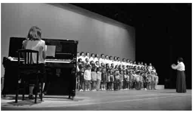
修復されたピアノの演奏にあわせて合唱

今回、「口頭詩フェスティバル」を開催するにあたっては、ピアノに由来するカルピス株式会社の協賛により、来場者や市内の幼稚園・保育園に通う園児にカルピスウォーターが配布され、大いに喜ばれました。