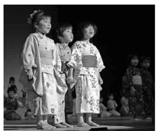
子どもたちが口頭詩を発表

本年春に全国から募集した口頭詩作品を審査し、特に優秀な8作品については、賞を設け当日表彰式を行いました。また、今回審査に当たった選者代表による記念講演会のほか、下妻中学校吹奏楽部による吹奏楽の演奏、市内幼稚園・保育園、騰波ノ江小学校1・2年生、騰波ノ江童謡教室の皆さんによる口頭詩発表や合唱などが催されました。エンディングアトラクションでは、出演者全員が客席にまで繰り出し、会場全体を巻き込んだの踊りで盛り上がりました。