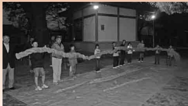
全長10m完成した大しめ縄

このたび町内の子供会、育成会等に呼びかけ地域交流活動の一環と、「大ケヤキ」樹勢回復の願