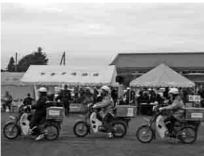
被害状況調査のため出動!!