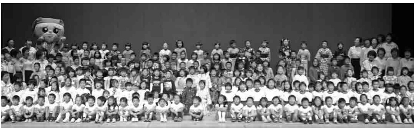
フィナーレ・出演者全員での合唱 上妻・騰波ノ江・ふたば文化幼稚園、下妻・きぬ・大宝・大和保育園、騰波ノ江小学校、騰波ノ江童謡教室のみなさん