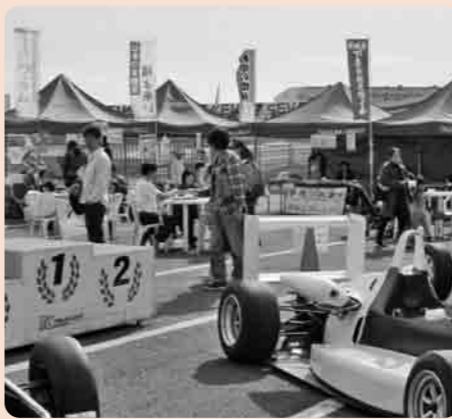
物産展コーナーの様子

この日は、物産展やフリーマーケットの出店もあり、市の観光振興に役立ててほしいと、フリーマーケットの売上金20,070円が市観光協会に寄付されました。ありがとうございます。