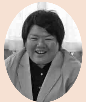
塚田 真希さん 県民栄誉賞

柔道選手として数多くの国際大会で優勝するとともに、北京オリンピック柔道女子78キロ超級で銀メダルを獲得、前回のアテネオリンピックに続く2大会連続でのメダル獲得は、茨城県出身者として初の快挙です。