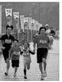
20回の記念をむかえた砂沼マラソン大会、親子で手をつなぎ湖畔を走る姿は、いつまでも残したい下妻の風景です。