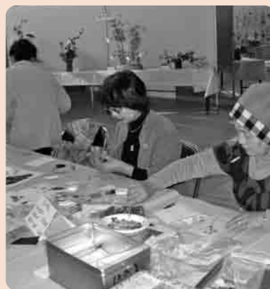
人気の体験コーナー

また、茶道や和紙人形、押し花などの実技コーナーは特に人気が高く、多くの皆さんが参加・体験しました。