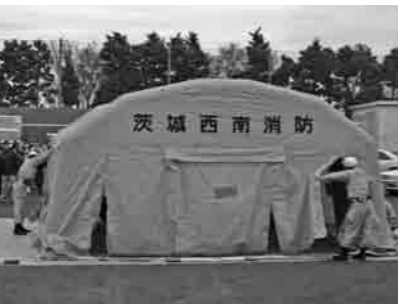
エアートント設営完了!!