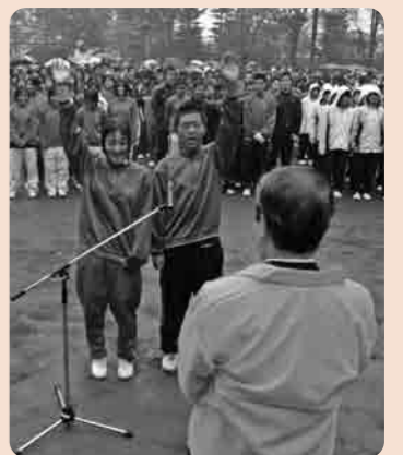
中学生による選手宣誓