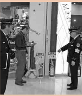
店舗内での指導の様子

消防署では、年末年始などに混雑が予想され火災になった場合、多くの犠牲者が出る可能性のある施設に対し、防火査察（立入検査）を実施しています。