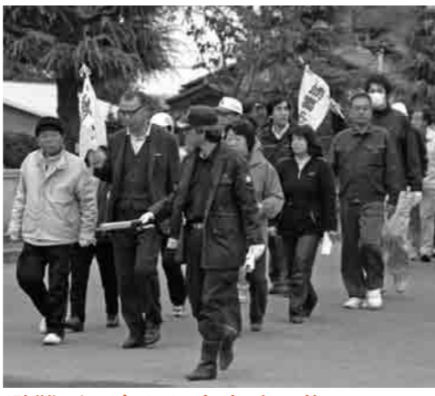
避難所に向かう大宝地区住民

「11月9日、茨城県南西部を震源とする直下型地震が発生、下妻市での震度は6強を観測、市内各所で甚大な被害が発生した」との想定のもと、東部中学校グラウンドで防災訓練が実施されました。地震発生直後から各自が即座に適切に対応できるよう、住民避難、救援物資輸送、初期消火、救出・救助などのさまざまな訓練が行われました。 当日は、大宝地区住民をはじめ防災関係機関等が多数参加し、本番さながらの実践的な訓練に真剣な表情で取り組んでいました。 このように、市では地区単位で毎年防災訓練を実施しています。