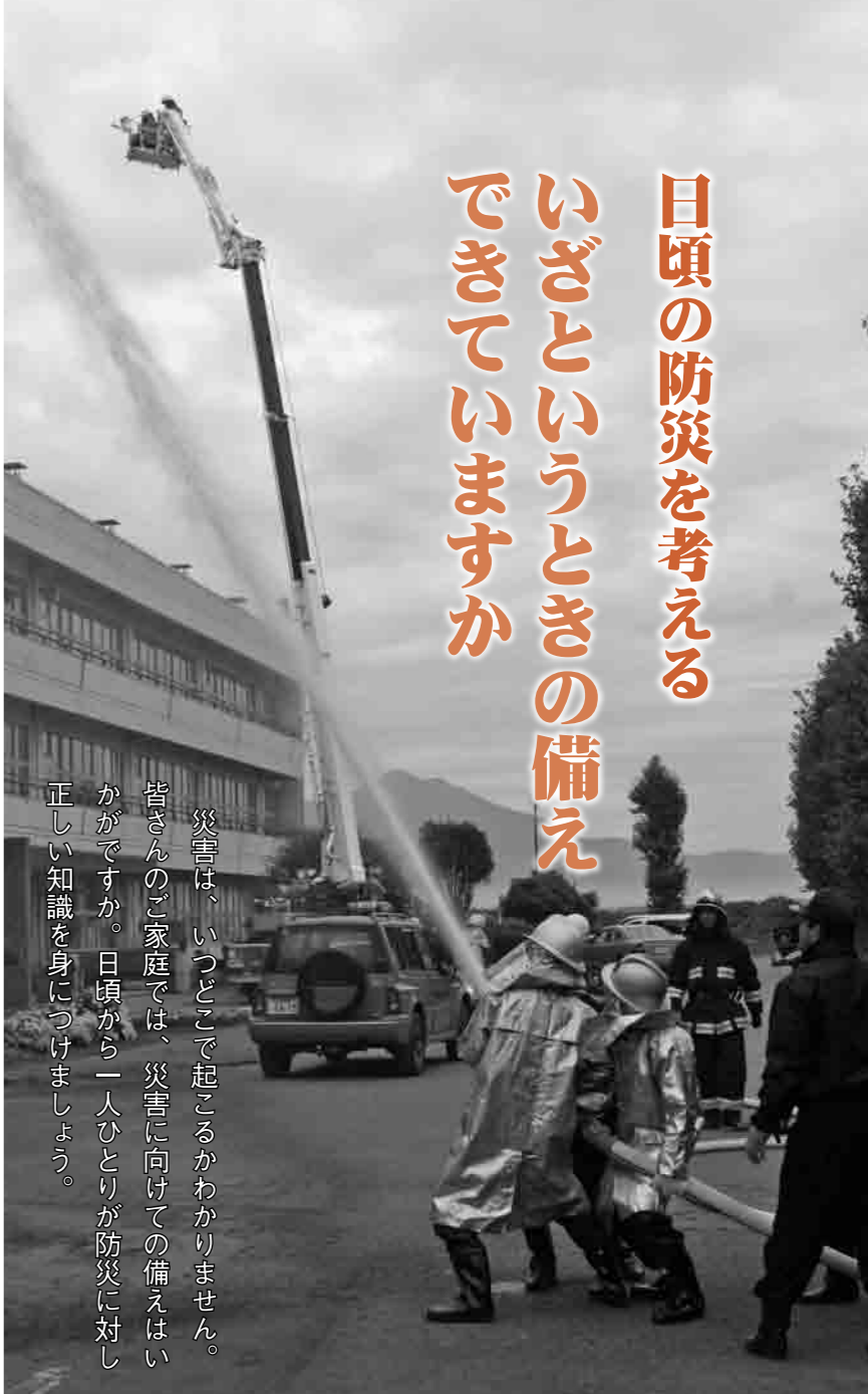
建物火災の消火訓練（東部中学校校舎で）

災害は、いつどこで起こるかわかりません。皆さんのご家庭では、災害に向けての備えはいかがですか。日頃から一人ひとりが防災に正しい知識を身につけましょう。