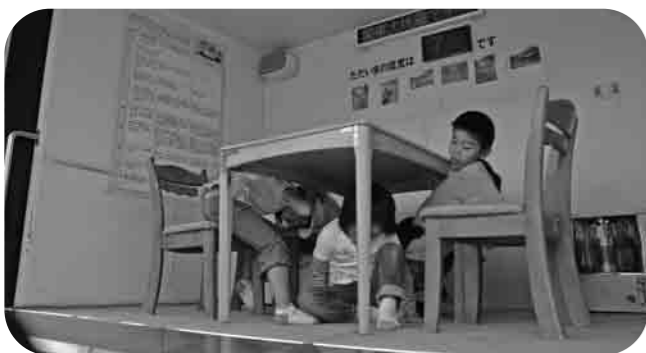
関東大震災並の震度7を体験(地震体験車)