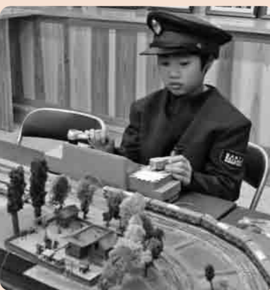
体験コーナーが盛りだくさん

働く皆さんが楽しく体験できる施設で、講座やクラブに参加し、有意義なときを過ごしてみませんか。