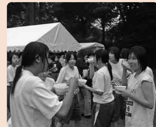
走ったあとの楽しみ、あったか豚汁