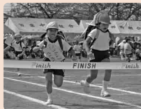
元気にあいさつ学校へ行こう(大形小)