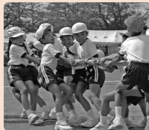
負けないぞ!(大形小)