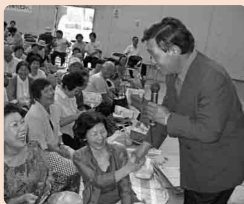
歌を楽しむ参加者の皆さん