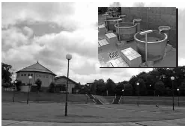
ピアスパークしもつま・温泉施設がリニューアルされた

問い合わせ・連絡先 企画課 内線 1313 〒304-8501 下妻市本城町2-22 FAX 43-4214 ホームページ http://www.city.shimotsuma.jp Eメール kkaku@city.shimotsuma.jp