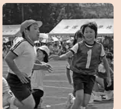
1等賞だよ(高道祖小)