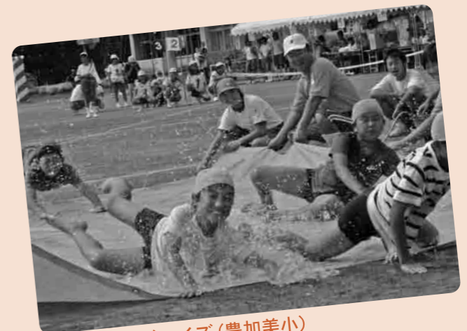
ウォーターボーイズ(豊加美小)