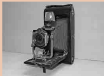
No.3A フォールディング ポケットコダック (アメリカ)

現在、ふるさと博物館では「クラシックカメラの世界」展を開催しています。博物館所蔵のカメラと市民の方々に貴重なカメラを出品していただき、フランス・イギリス・ドイツ・アメリカ・日本の、なかなか目にする事ができないカメラを展示しています。この機会にぜひ「クラシックカメラの世界」をお楽しみください。