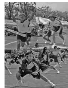
9月に市内の小学校で行なわれた運動会の様子です。今回は豊加美小・高道祖小・大形小におじゃましました。子どもたちの元気いっばいの声に元気をもらいました。