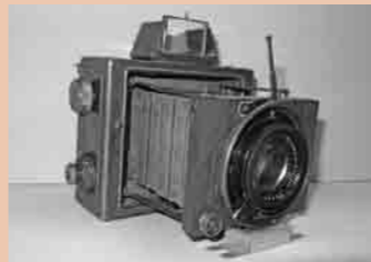
エルネマンクラップ トロピカル (ドイツ)