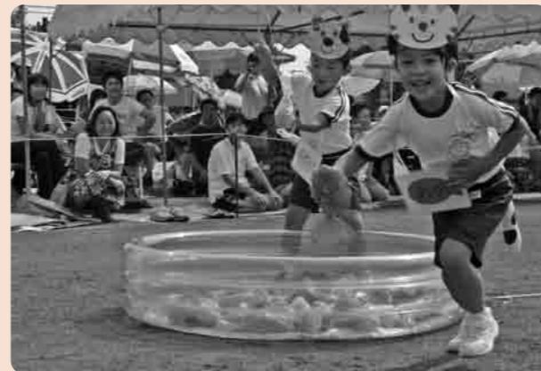
大きなさかなつれたよ(高道祖小)

9月、市内の小・中学校13校で運動会が行なわれました。6日には、中学校で、13日、14日、20日には小学校で、それぞれ特徴あるプログラムを組み、楽しい種目が盛りだくさんの運動会になりました。走ったり、踊ったり、子どもたちが一生懸命競技に取り組む姿、また、保護者の皆さんが、わが子をカメラやビデオに収めようと走り回る姿が印象的でした。とてもよい思い出になったことでしょう。