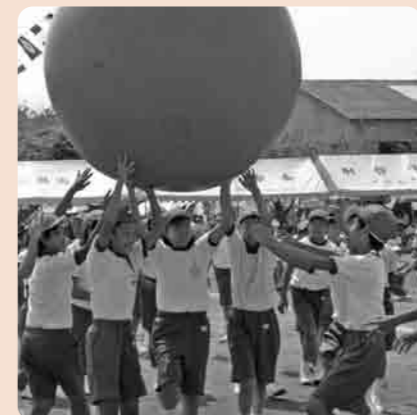
力をあわせて(豊加美小)