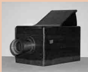
カメラ・オブスクラ

博物館には「カメラ・オブスクラ」という道具があります。「カメラ・オブスクラ」とはラテン語で「暗い部屋」という意味です。「カメラ」という名前はここから由来しており、1830年代最初の写真機発明の際この装置が利用されたことからカメラの原型であるといわれています。旧制下妻中学校(現下妻一高)で使用されていました。