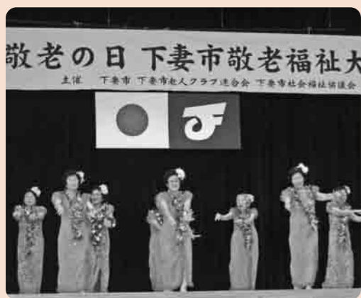
とても若々しい皆さん

また、9月15日には、恒例の敬老福祉大会が市総合体育館において、市内各所から約1,000人の皆さんが集まり、盛大に開催されました。この大会は、今年で39回目を迎え、