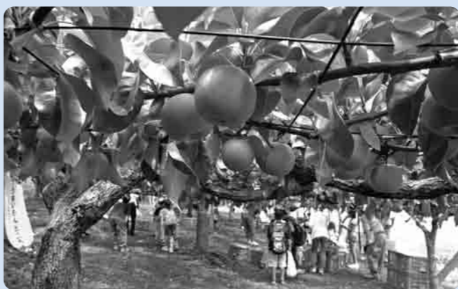
完熟したとても美味しい梨です