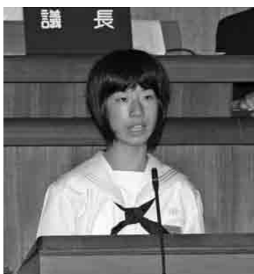
登壇し質問をする中学生議員