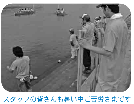
スタッフの皆さんも暑い中ご苦労さまです

編集デスク 夏休み期間中には、市内の各所で川に親しむイベントが開催されました。 また一方、全国の各地で大雨による川の被害が多発しました。下妻市は、鬼怒川・小貝川をはじめ、市内を多くの川が流れ、生活と川が特に密接な関係を持つ地域です。 楽しさを与えてくれる顔と危険な顔、両面を持つ川ですが、特にこれからの時季、台風などによる川の増水が心配されます。日ごろの備えを。