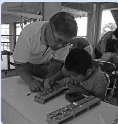
親子で夏の思い出づくり

8月17日、小貝川ふれあい公園ネイチャーセンターで昆虫教室が行なわれ、小学校2年生から5年生の親子12名が標本づくりに挑戦しました。今回標本にしたのは、初心者でも比較的簡単にできる、ウスバシロチョウという蝶です。