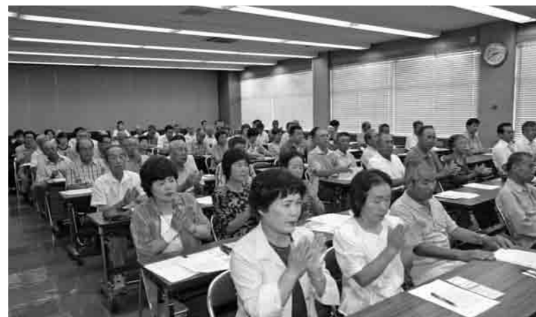
市長のキックオフ宣言に参加者からの大きな拍手

エコネットしもつまでは、地域の温暖化対策を推進するために、それぞれの立場で話し合いをし、省エネ・省資源の推進やごみの減量などの具体的な取り組みを行なっていきます。