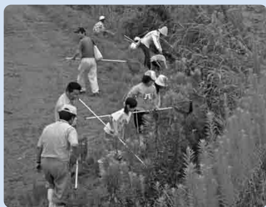
網を手に水生生物を採集

参加した子供たちは「どんな生物がとれるだろう」と期待を膨らまし、会場を原地区休耕田、鬼怒川水辺の楽校、大宝地区の農業排水路へとバスで移動しました。原地区休耕田ではオオタニシ、アメリカザリガニ、