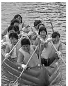
真夏の太陽のもと開催されたEポート大会。暑さに負けず力いっぱいパドルをこぐ姿、楽しんでいる表情がとても素敵でした。