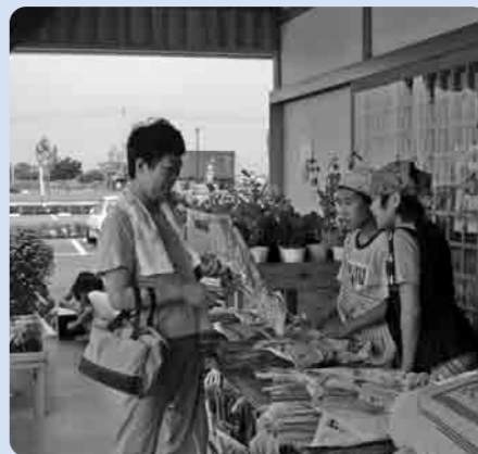
販売員姿が板についています

蚕飼小学校の児童が8月9日、自分たちで栽培し、収穫したねぎを市内の「やすらぎの里しもつま農産物直売所」で販売しました。