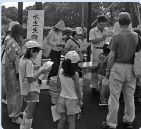
珍しい水生生物の説明を聞く参加者

8月10日、真夏の太陽が照りつける中、市内の小学4・5年生を対象に、水生生物観察会がネイチャーセンターで行われました。