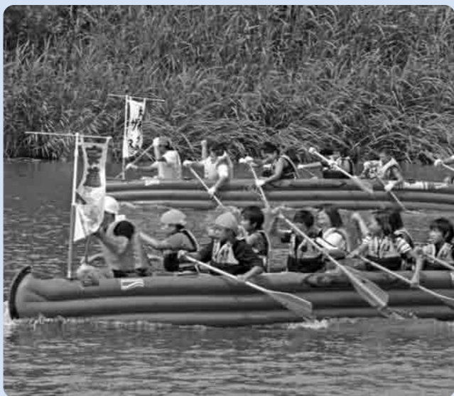
大形小チームvs宗道小チーム

き、水しぶきを上げながら、男性も女性も小学生も、暑さに負けず力を出し切りしました。優勝(一般の部)は、今回もカンボジア出身の農業研修生チームで、9月13日にお台場で開催される全国大会に出場します。