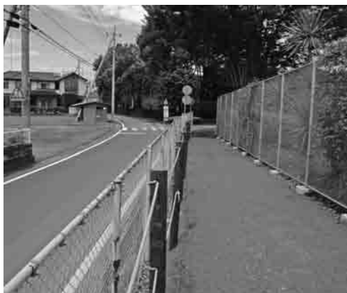
砂沼サンビーチ南側の歩道