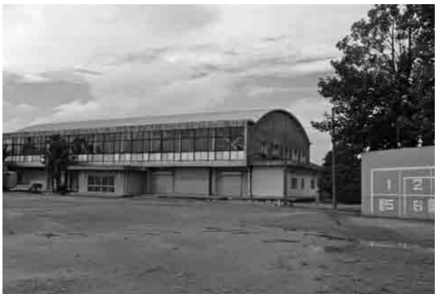
千代川第2体育館とグラウンド

石器などの遺物や古くから使われてきた農具や民具などの民俗資料が保管されています。また、体育館は、市立千代川第2体育館として利用されており、グラウンドは、スポーツ少年団活動、野球、ソフトボール、サッカーなどの練習や大会の会場として多くの市民に利用されています。