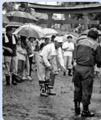
住民による消火器の取り扱い訓練

市民と行政が協働で人にやさしい夢のあるまちづくりを推進するために、女性の積極的な行政参画は不可欠です。第7期の皆さんが活躍され、さらにすばらしい成果が得られるものと期待されています。