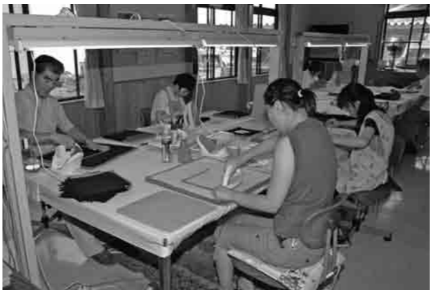
夢工房・おぞらの作業所

また、中学生議員の皆さまも医療機関を適切に利用するため、「かかりつけ医」などを持つとともに、自らの健康の維持・増進に努力されま