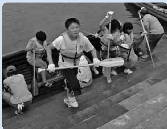
精一杯がんばりました(総上小チーム)

この大会は、水に親しみ、流域の交流を深めることを目的に行なわれており、市内外から50チーム(一般の部:39チーム、女性の部:5チーム、小学生の部:6チーム)がエントリーしました。