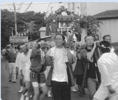
赤須地区の渡御の様子

朝9時から地区内の長塚五所神社で御神入れが行なわれ、その後、長塚農村集落センターやピアスパークしもつまなど、町内の各箇所地域住民に披露されました。午後6時からは、老若男女が協力し合い、町内を元気よく練り歩きました。地域の活性化や伝統文化の継承につながることでしよう。