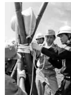
出水期本番を向えての水防訓練、土木事務所の職員から水防工法の指導を受け、真剣な表情で訓練に取り組む市消防団員。