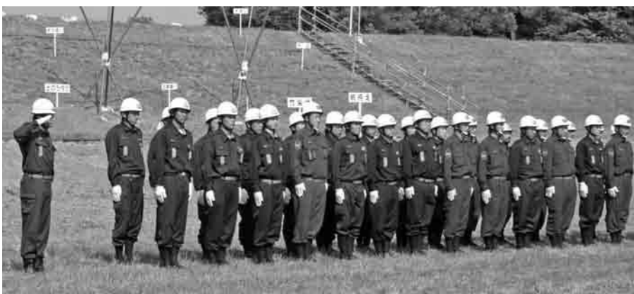
出動した市消防団第6・7分団員

竹とげ ：土に差し込みやすくするために、竹の根元を斜めにとがらせる 杭ごしらえ ：差し込みやすくするために、杭を刃物で削り三角形にとがらせる 土のう作り ：袋に土や砂を詰め、袋の口に取り付けてあるひもで固く結ぶ