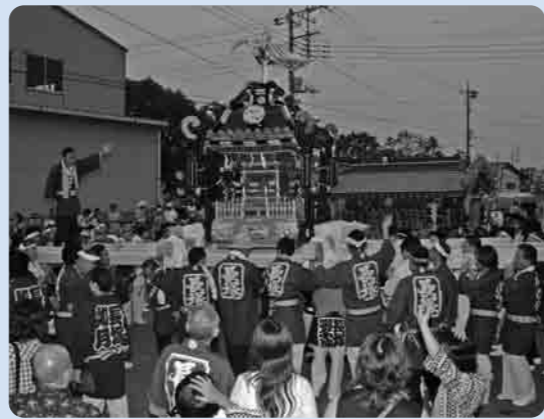
長塚地区の大人神輿がいよいよスタート

また、長塚地区では、大規模な修繕で40年ぶりよみがえった、大人神輿が、7月27日にお披露目されま