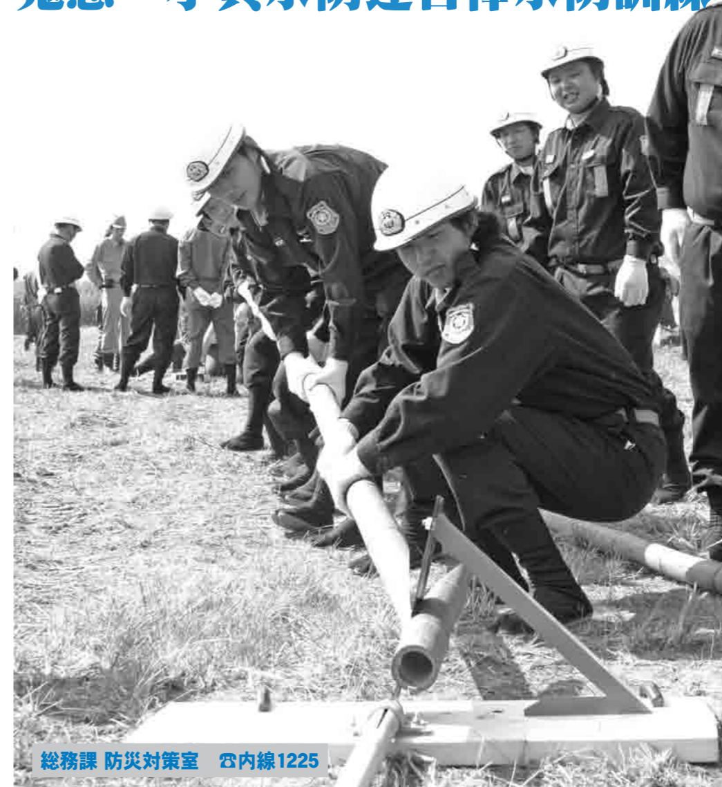
総務課 防災対策室 管内線1225