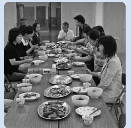
食卓も豊かになります

このほど、筑西農業改良普及センター主催の女性大学、ファーマーミングセミナー「畑と台所を結ぶ食農講座」が7月7日、やすらぎの里しもつま「リフレこかい」で開講しました。