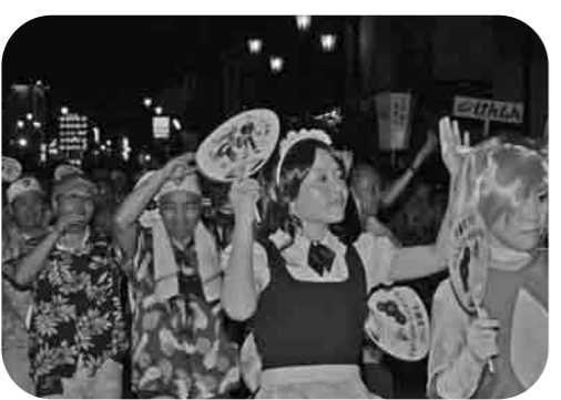
新人もベテランも、がんばってます

編集デスク 千人おどりに、地域や職場などからたくさんの方の参加がありがとうございます。参加された皆さん、たいへんおつかれさまでした。千人おどりは、おかげさまで今年25年の節目の年を迎えました。 これを機に、というわけではないのですが、市役所チームでは、踊りの衣装をカラフルなアロハシャツに変えました。これからは、多くの職員が参加し、より楽しくイベントを盛り上げていきたいと思っておりますので、よろしくお願ひします。