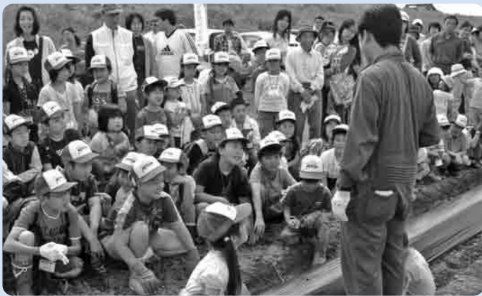
真剣に説明を聞く参加者

設を活用し、地域づくりの事業を一層実践していくため、「蚕飼地区まちづくり推進委員会」を新たに発足しました。推進委員会では、これから交流や親睦のための活動や環境美化、やすらぎの里しもつまの活用やPR活動を進めていく予定です。