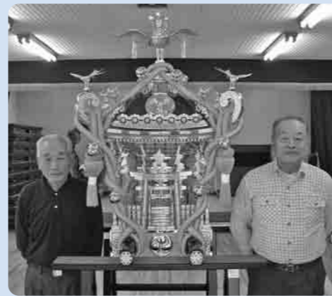
赤須自治会の神輿・ファンヒーター・椅子保管用台車