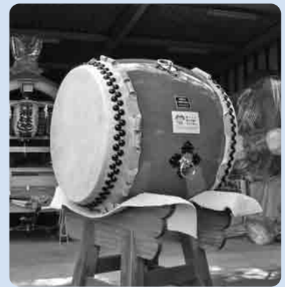
浦町自治会の和太鼓

浦町自治会では、夏祭りをより一層盛り上げるため、宝くじの助成を受けて和太鼓を新調しました。この浦町自治会は、隣接する仲町自治会と一緒に地域住民によるお囃子の団体を昭和58年に結成し、郷土芸能の継承と地域住民の繋がりを維持することを目的に活動しており、夏祭りのほかにも市内外での各種イベントに積極的な参加をしています。 また、赤須自治会では、夏祭りを彩る大人神輿と集落センターの椅子保管用の台車及びファンヒーターを購入しました。大人神輿は、大正時代に製作されたもので、傷みが激しく、神輿の新調が地元の悲願となっていました。今後は、夏祭りを通して地域住民の郷土愛を育むとともに、集落センターを各種事業の拠点とし、コミュニティ活動の更なる充実と発展を図っていきます。なお、新しい神輿のお披露目を7月13日(日)に予定しています。 ※「宝くじ助成事業」は、(財)自治総合センターが宝くじの普及および広報を目的に、コミュニティ活動で必要な備品・施設を整備する自治会・町内会などに対し助成するものです。