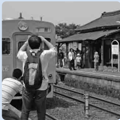
騰波ノ江駅舎とキハ101号車

映画「下妻物語」などの撮影やテレビCMに使用され、「関東の駅百選」にも認定されている騰波ノ江駅舎(関東鉄道常総線)が、長年使用の老朽化により、このほど改築されます。 取り壊し工事まで残りわずかとなった6月28日、「騰波ノ江駅さよならイベント」が開催され、多くの皆さんが名残を惜しまれました。 当日は、イベント列車として、懐かしい旧常総筑波鉄道色(青と白)のキハ102号車や新塗色(朱色)のキハ101号車が運行され、レールファンを楽しませてくれました。