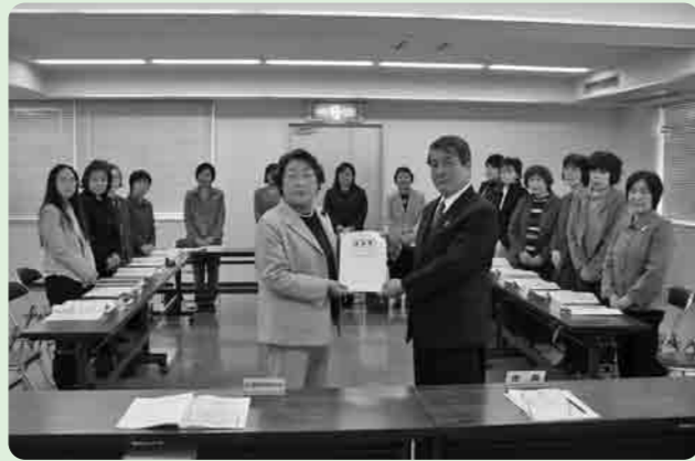
女性スタッフのみなさんから市長に提言書を提出