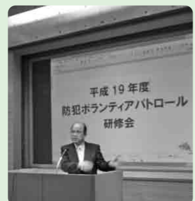
みなさんのご協力をお願いします 安心・安全なまちづくりを

防犯ボランティアパトロール研修会が、3月4日、市立図書館において開催されました。 当日は、下妻警察署生活安全課長による「防犯パトロールのチェックポイント」の講話があり、参加した約80名の防犯ボランティアパトロールのみなさんは、熱心に聞き入っていました。 地域のみなさんが積極的にあいさつを交わし、周囲に気を配る事が、犯罪防止につながるといわれています。また、犯罪者にとっても、声をかけられることをとても嫌がります。これからの安心・安全なまちづくりに、みなさんのご協力をお願いします。