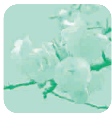
千代川運動公園の桜

納期限: 4月30日 [税目] [口座引落日] 固定資産税(第1期) 4月30日