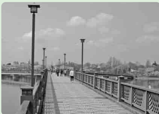
四季折々の自然の中で、スポーツや散策などが楽しめます

1月末の日曜日、午前中砂沼に歩きに行く。風が強いので風を避けて西側を歩く、水面の鴨の姿を見るのも楽しみ。「毎年同じ鴨だけね」と言いながら中学校の下に行くと、野球