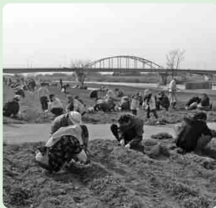
きれいな花が咲きますようにと除草作業