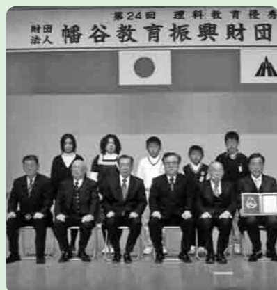
表彰された大形小学校のみなさん

2月26日、茨城県教育委員会教育長の推薦により、第24回、理科教育優秀校として財団法人幡谷教育振興財団から大形小学校が表彰されました。 この賞は、つくば科学博が開催された昭和59年に設立し、以来毎年茨城県教育委員会教育長から、県内、小中学校の優秀校を6校ずつ推薦され、幡谷教育振興財団賞として、100万円が贈呈されているものです。 大形小学校は、「自然に親しみ、意欲を持って、自然の事物・現象を調べ、自然を愛する豊かな心情や態度を育てる」を研究の目標とし、ふるさとの自然の素晴らしさを肌で感じ、児童の環境保全への関心・意欲や実践力を育てていくことを、大きな目標として取り組んできたもので、そ