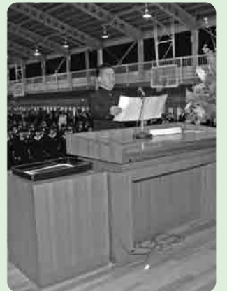
学び舎に別れを告げる卒業生

共に支えあい、共に励ましあい、歩んできた仲間との最後の学校行事となった卒業式が、3月11日に市内の各中学校で、3月19日には各小学校でおこなわれました。中学校の卒業