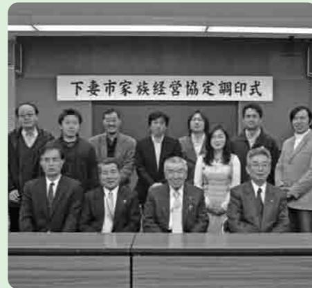
農業経営に弾みがつきます

3月19日、農業家族経営協定調印式が市役所において、おこなわれました。 この調印式は、家族経営中心のわが国農業が、魅力ある職業となり、男女を問わず意欲をもつて取り組めるようにするためのものです。 協定書の内容は、1.営農計画 2.家族の役割分担 3.就業条件 4.労働報酬 5.健康管理等々、各家族がそれぞれに約束事を文書化したものです。 市内からは、6組の家族が出席し、市長をはじめ、筑西農業改良普及センター長、農業委員会会長、JA常総ひかり代表理事理事長の立会いの