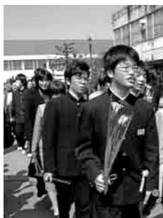
この写真は、下妻中学校の卒業式終了後、学び舎に別れを告げ、生徒と保護者がいっしょに花道を歩く姿にカメラを向けました。