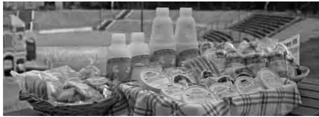
種類が豊富なウイマムの農産物加工品

現在、ビアスパークしもつまでは、体験農園での果物・野菜などの収穫体験、農産物加工施設での「下妻食と農を考える女性の会」による、クッキーやソーゼージ作りなどの体験教室を、