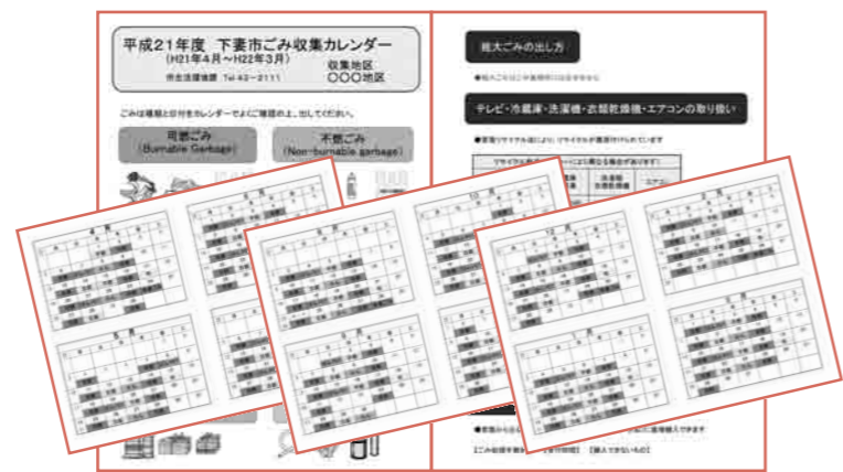
ごみ収集カレンダーは、今回の「広報しもつま3月号」と一緒に配布しています

市では、ごみや資源物の出し方について出張説明会を開催します。自治会や団体等の10名以上のグループが対象です。日時や場所を設定し申し込んでください。