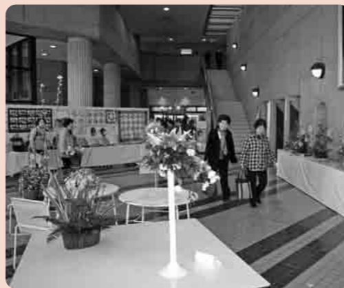
力作が展示された会場の千代川公民館

公民館まつりが、2月21・22日の2日間、千代川公民館を会場に開催されました。この催しは、下妻・千代川・大宝公民館などの各教室で1年間、熱心に取り組んできた活動の成果を発表するもので、会場にはみごとに作品が展示されました。毎年好評の体験コーナーでは、子どもたちがロールケーキ作りや抹茶体験、ツールペイントに挑戦、親子で楽しい時間を楽しみました。また、発表会では、歌やダンスなどが披露され、会場はいへんな盛り上がりとなりました。皆さんも、ぜひ参加してみてください。