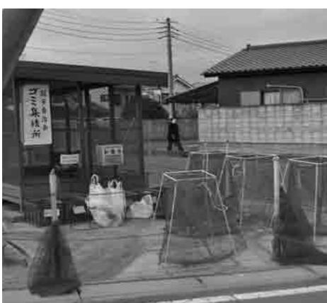
利用者により管理されている集積所

ごみ集積所は、利用者一人ひとりがマナーを守って清潔に保ちましょう。生ごみの水切りの徹底や収集日を守ることで、悪臭やごみの飛散をなくしましょう。