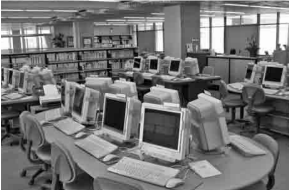
図書室とコンピュータ教室が一体化した「学習センター」のイメージ

現在の進捗状況は、「下妻市立東部中学校建設委員会」で、学校づくりの基本構想・基本計画が策定され、生徒数の推移や学校の運営方式、国