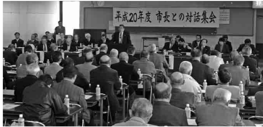
多くの自治区長さんが参加した対話集会

これまで筑西市に対し、下流域地域への対策をしてもらえるよう要望し、当地域の道路側溝から下流域域への流末排水路設置の検討をしてきましたが、地理的条件から実現には至っていない状況です。 今後は、雨水の多くが筑西市からの流入水ですので、水量を調整し放流できる施設の設置案などについて、筑西市土木課と再協議し、解消に努めていきます。