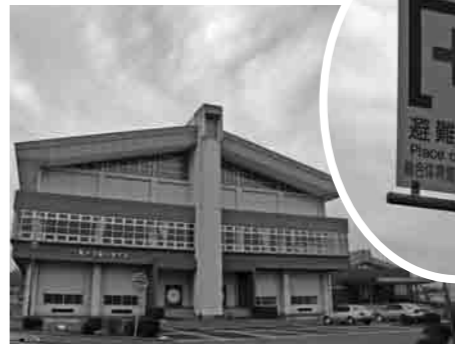
避難所になっている総合体育館と標示板

については、現在、下妻中学校A棟の耐震診断を実施しています。その結果、建物の耐震性能を表す指標（IS値）が0・3未満の場合は大地震が起きた時に倒壊や損壊の危険が高いため、平成21年度に耐震補強実施設計を行ない、平成22年度に耐震補強工事を実施したいと考えています。