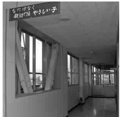
耐震補強工事が完了している大形小学校の校舎