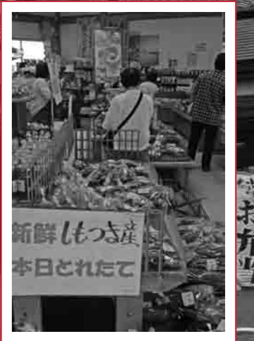
道の駅しもつま・農産物直売所

自治区長と市長との対話集会が2月17日、下妻公民館で行なわれました。自治区長の皆さんは、地区の代表として、日頃から地域の皆さんの意見や要望を取りまとめ、行政とのパイプ役として活躍しています。この対話集会は、自治区の意見を広く行政に取り入れ、市民と行政の協働の街づくりを目指し、毎年開催されています。各地区の区長さんから出された意見や要望の一部を紹介します。