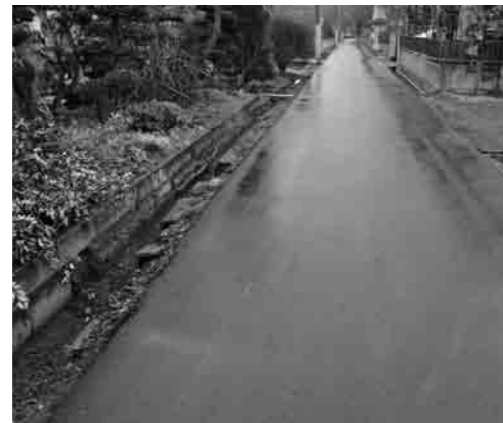
高道祖東原住宅の道路

この道路は、新堀集落内の中央を通る市道5183号線の一部で、墓地前から旧消防小屋までの延長約90メートル区間で、現況幅員が側溝を含め2・7メートルになっています。この路線の西側に民有地のため池が接しており、ため池と道路面との高低差があるため、路肩が崩れやすく、道路幅員が保たれていない状況です。