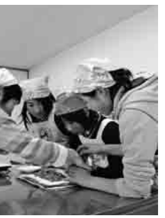
公民館まつりでのひとこまで。子どもたちがロールケーキ作りに挑戦。とてもおいしくできました。