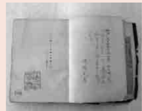
「死のよろこび」内扉裏

平成15年から70回にわたり連載してきましたこのコーナーですが、主たる収蔵品の紹介ができたものと思われ、今回をもって終了とさせていただきます。長い間ご愛読いただきましてありがとうございました。皆さま方のふるさと博物館へのご来場をお待ちしております。