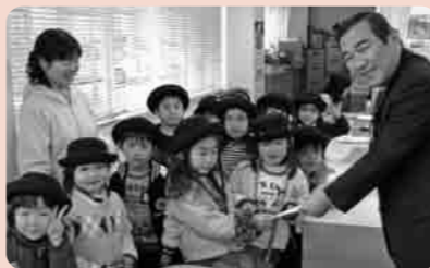
福祉のために園児から手渡される

温かい善意ありがとうございます ごぞいませ いずみ幼稚園 下妻いずみ幼稚園の在園児67名のうち、月組(年長)11名が来庁し、福祉のために使ってくださいと42,500円の寄付をいただきました。