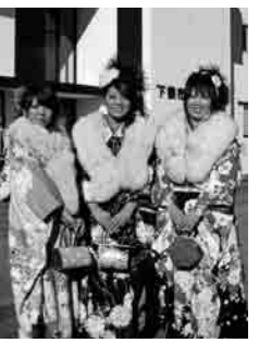
成人のつどいが開催され、会場となった市民文化会館の前には、鮮やかな振袖の花が咲きました。