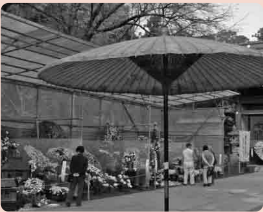
下妻市菊まつり会場(大宝八幡宮)