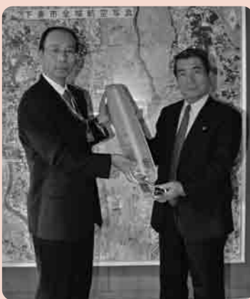
市長室で防犯灯が引き渡される

例年、各会場にたくさんのお菊がみごとに並び、多くの皆さんにご覧いただけていますが、主催する下妻市