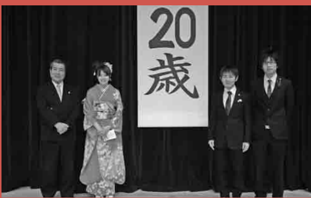
質問をした新成人と市長が記念撮影 未来の下妻市をよろしく願います

「合併して3年が経ちましたが、メリットにはどのようなことがありますか」「東部中学校が建て替えられると聞きましたが、どのような計画ですか」「下妻市は第2の夕張市にはなりませんか」と、合併したまちへの関心、自分たちの学校への愛着が感じられる質問の内容でした。