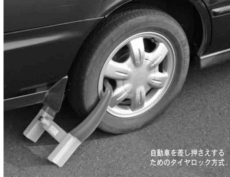
自動車を差し押さえするためのタイヤロック方式