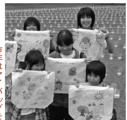
昨年はマイバッグをつくりました

昨年度は、市・市民団体・企業等が一体となり温暖化防止に取り組むため、「STOP!温暖化エコネットしもつま」が設立され、本年度は、家庭からの二酸化炭素削減にむけ「環境家計簿」の作成をお願いしました。そこで今回、地球環境や自然環境への思いをカルタで表現する、「環境カルタ」の作成に取り組むことになりました。ぜひ、ご応募ください。