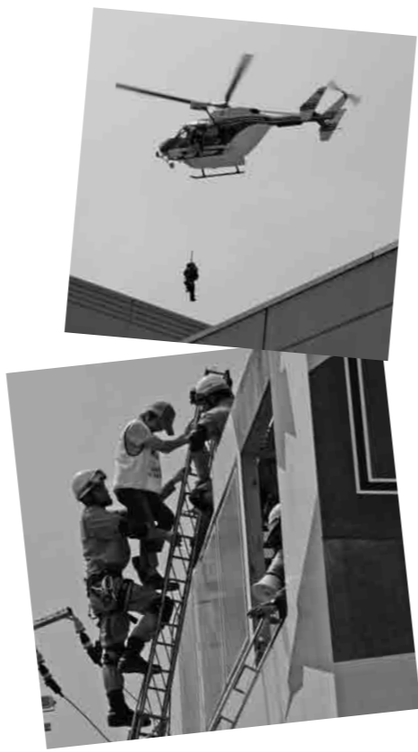
防災ヘリによる救出(写真上) 倒壊したビルからの救出(写真下)