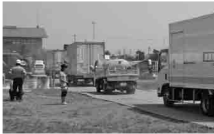
散乱物を排除し道路を復旧(写真上) 電力などライフラインの復旧(写真中) 救援物資の輸送(写真下)