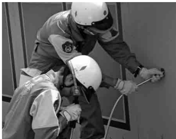
ファイバースコープによる負傷者の検索