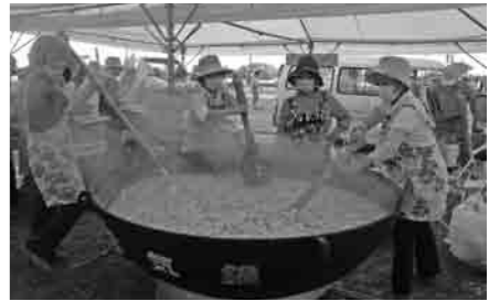
地域住民を避難所に誘導(写真上) 外国語による住民広報(写真中) 婦人防火クラブによる炊き出し(写真下)