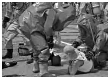
有毒ガスの中で救助にあたる化学隊