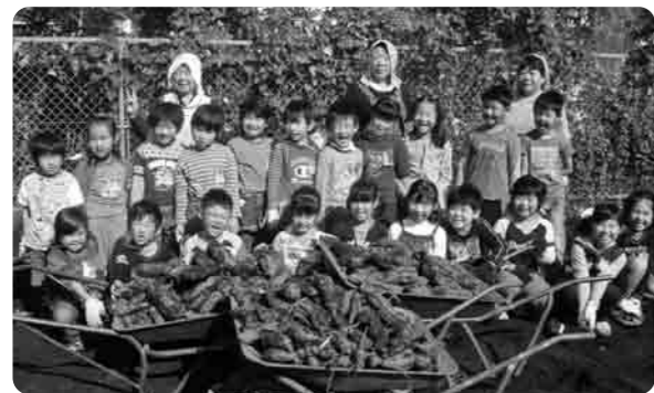
1年生がさつまいも掘り

畑の先生 学校には「すぎの子農園」という野菜畑があり、地域のおばあさんたちが、植え方や育て方を教えて下さいます。私たちは、「畑の先生」とよんでいます。畑のことがただでなく、昔の生活の様子や昔の遊びなど何でも知っていて、わかりやすく話して下さいます。 秋には、「畑の先生」たちを招待して、「収穫祭」を開き、みんなで楽しく食事をします。