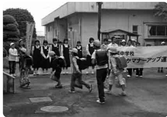
朝のあいさつ運動

幼・小・中の連携 大宝幼稚園や東部中学校といろいろな行事で交流をします。 その一つが「あいさつ運動」です。幼稚園・小学生・中学生が当番を決めて、毎月1回昇降口前に、元気よく「おはよう」の音が飛び交います。 幼稚園児のかわいい声や中学校の先輩たちの大きな声を聞くと、「私たちも負けていられないぞ。」と、思わず力が入ります。頼もしい先輩たちとかわいい弟や妹たちと過ごす朝の楽しいひとときです。