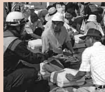
先ごろ実施された総合防災訓練。AEDを用いた心肺蘇生法訓練に、真剣に取り組む住民の皆さん。