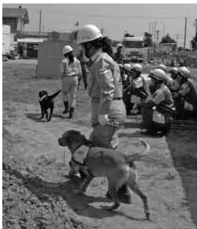
災害救助犬による捜索