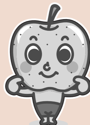
PRに一役 なしっぺくん

さらに、今年下妻なしのキャラクター「なしっぺくん」が誕生し、県内外でPR活動に活躍中です。