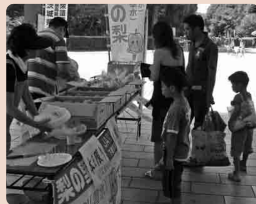
梨は疲労回復にも効果的

8月15日、砂沼サンビーチの入口前広場において「下妻の美味しい梨」の試食販売がおこなわれました。