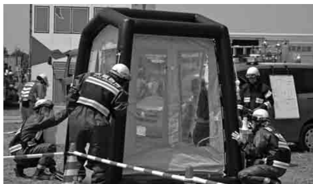
有毒ガスが発生し、除染テントを設置