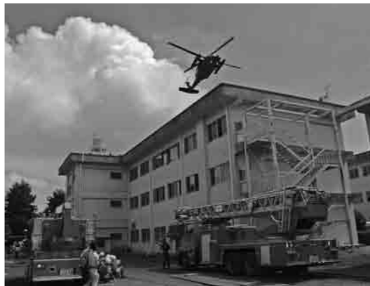
昨年の総合防災訓練(常陸大宮市)の様子

日時 8月29日(土) 9時30分～12時30分 実施場所 県西流域下水道事務所 (中居指：ほっとランド・きぬ北側)