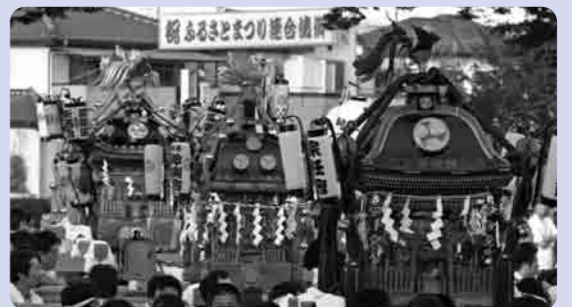
地域のお神輿が会場に集合

共催により、地域の活性化と住民のふれあいを目的におこなわれ、今年で13回目を迎えました。