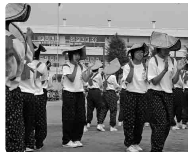
もんぺ・たすき・菅笠が伝統です

東部中学校は、生徒数419名、教職員42名の学校です。学習・生活・部活動など、あらゆる面において、真剣でまじめな取り組みで力を伸ばしています。今回は、東部中学校の学校自慢として、他校にはない独自の活動をご紹介します。