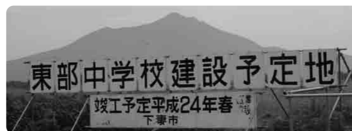
背景に筑波山を望む建設予定地 完成予想図は、広報しもつま5月号などをご覧ください

昭和42年12月1日、東部中学校の校舎が竣工され、それから、40年余が流れ校舎の老朽化が進みました。そのため、現在の東部中学校から北東約300メートルの位置に新校舎建設計画が進んでいます。完成予想図をみた生徒に話を聞くと、「新しい校舎に自分たちも入りたかった。」という意見とともに、「今の古い校舎に感謝の気持ちを込めて大切にしたい。」という意見や、「清掃や物を大切にすることなど、東部中の良い伝統をさらによくして新しい校舎に伝えたい。」という意見がありました。夢が大きく膨らみます。