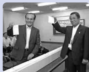
1等を引く小倉市長(右)と外山商工会長(左)