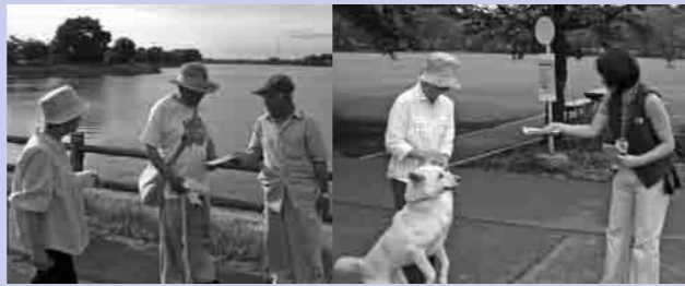
砂沼愛漁会会員の皆さんと市でマナーを呼びかけました

「ゴミのポイ捨てをしない」 「犬のフンは飼い主が責任を持って片付ける」 マナーを守って、きれいな環境を作りましょう。