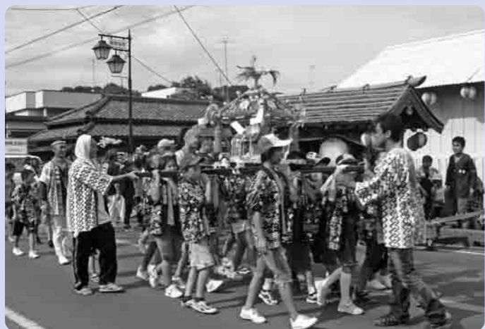
新調された子ども神輿

子ども神輿が新調され、子どもたちの地域参加が促進されるとともに、地域のコミュニケーション活動がますます活発になること、喜びの声がきかれました。