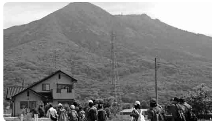
筑波山が近くに感じられますが…

5月22日に、筑波山往復（26キロメートル）登山が実施されました。これは、第2学年の「立志に関わる行事」の一つとして毎年実施しているもので、当日は午前7時50分に高道祖小学校をスタート、午前11時30分頃山頂に到着しました。午後5時過ぎに全員が元気に帰着、歩き終えた生徒の姿からは、クラスやグループの友達と助け合い、協力し合いなら困難を乗り越えた充実感が感じられました。