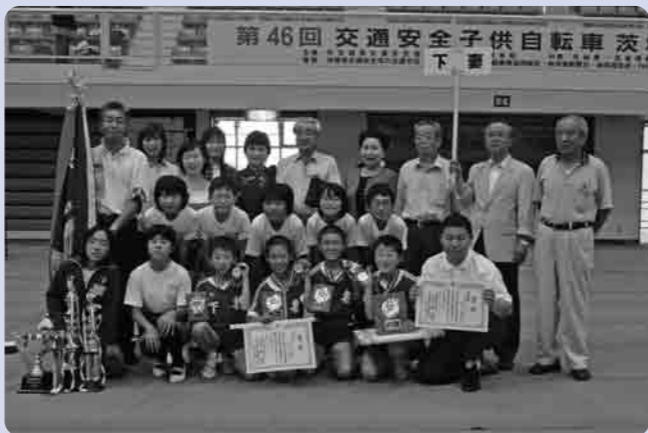
11人の選手と応援団の皆さん

この大会は、子どもたちが自転車競技を通じて交通安全の意識を高め、早くから登校して学科の学習をし、昼休みや放課後には、安全走行や技能走行の練習に励んできました。チームワークがよく互いに知と技を磨き上げてきました。その成果を本番でも発揮し、県大会優勝と出場者全員の入賞に結びつきました。