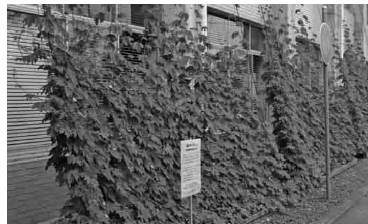
順調に育っている本庁舎のゴーヤ 市役所でも緑のカーテンに取り組んでいます

エアコン使用の場合20～30%の省エネ効果があり、窓を開ければ「すだれ」より涼しい風を室内に呼び込みます。また、窓を覆う緑の空間は癒しをもたらすし、採りたての作物を食べることができると健康にも役立ちます。