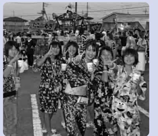
やっぱりお祭りは楽しいね