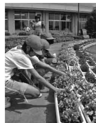
宗道小学校(左)と蚕飼小学校(右)の取り組み

市内の各小・中学校や幼稚園では、教室を快適な空間にするためにゴーヤの栽培を始め、先生や児童・生徒たちが「つる」をはわすネットを設置しました。花壇・プランターの土は学校の畑で作っている堆肥を利用するなど環境にも配慮しており、子供たちが園芸を学びながら毎日世話をしているおかげで、たまたま元気に生育中です。