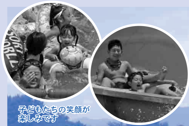
子どもたちの笑顔が楽しみです