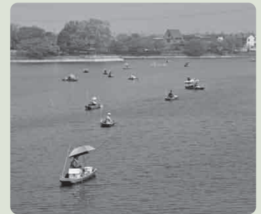
きれいな砂沼をいつまでも守りましょう

午前5時、霧が立ちこめるなかでのスタートとなりましたが、次第に霧ははれ、午後2時の終了まで砂沼にはたくさんの釣船が浮かび、へらぶな釣りを楽しんでいました。 これからも「砂沼へらまつり」が続けられるよう、参加されたみなさんには、「砂沼をきれいにする運動」へのご協力を呼びかけました。 今年で45回目を迎える「砂沼へらまつり」が、ゴールデンウィーク最終日の5月8日に開催されました。これは、毎年砂沼愛魚会が主催しているもので、今回も県内外から115名の参加者でにぎわいました。 午前5時、霧が立ちこめるなかでのスタートとなりましたが、次第に霧ははれ、午後2時の終了まで砂沼にはたくさんの釣船が浮かび、へらぶな釣りを楽しんでいました。