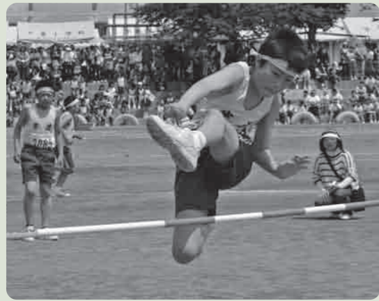
もっと高く！走り高跳び

市内でおこなわれた各種行事や地域の話など… みなさんからの情報をお待ちしています。 (秘書課 広報広聴係 内線 1212)