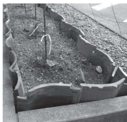
花だんを瓦でアクセント

●ご希望の方にお分けいたします。 ※違法な再利用や不法投棄は法律で罰せられます。 ●場所 千代川第二体育館グラウンド (旧千代川中学校跡地) ●毎週金・土曜日午後1時から午後4時30分まで (9月30日まで) ●積み込み作業等は各自で行っていただきます。