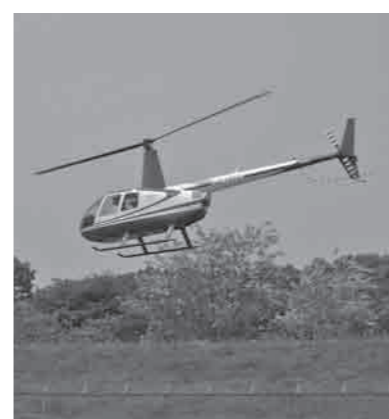
空から監視しています

■市民清掃デー実施中 毎年5月30日(ごみゼロの日)を基準日として、「関東地方環境美化運動の日」統一美化キャンペーンが実施されています。下妻市でも各区自治会、小・中学校、事業所などを中心に市内全域の清掃活動を実施しています。ごみのポイ捨てや不法投棄をなくして、豊かな自然に恵ま