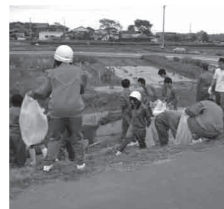
中学生による常総バイパス周辺の清掃活動

■市民清掃デー実施中 毎年5月30日(ごみゼロの日)を基準日として、「関東地方環境美化運動の日」統一美化キャンペーンが実施されています。下妻市でも各区自治会、小・中学校、事業所などを中心に市内全域の清掃活動を実施しています。ごみのポイ捨てや不法投棄をなくして、豊かな自然に恵ま