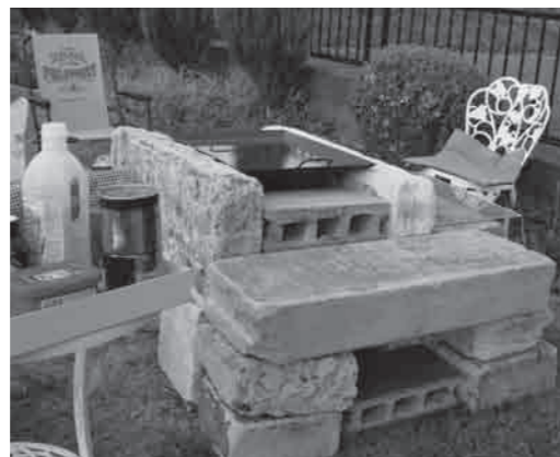
コンクリートブロックと大谷石のバーベキュー炉

■震災ごみでガーデニングを 東日本大震災によって壊れた屋根瓦やブロック塀が大量に持ち込まれています。市では今後これらのごみを処分することとしていますが、ガーデニングなどに再利用してみてもいかがでしょうか？