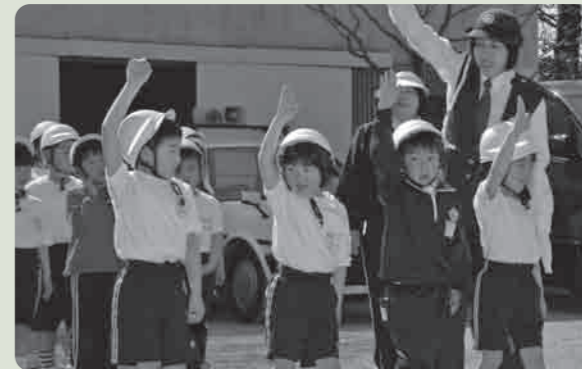
横断歩道、手を大きく上げて渡りましょう