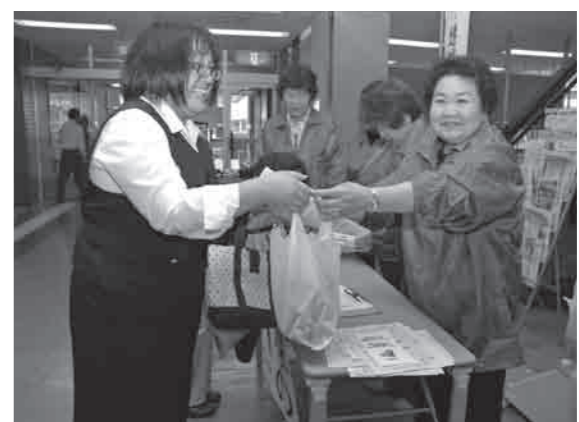
ゴーヤの苗を配布しました(本庁舎)

■緑のカーテン ゴーヤの苗を無料配布しました。みなさんの緑のカーテンの写真を募集します。