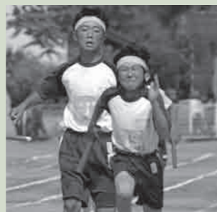
市内小学校陸上記録会での男子400mリレー決勝。バトンタッチも成功し、会場の声援もひととき大きくなりました。