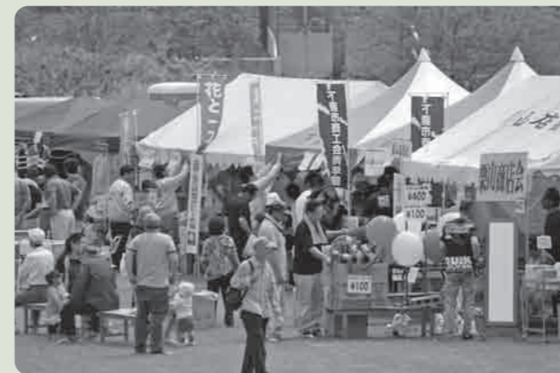
各テントにはたくさんの人が