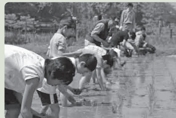
みんなの願いがホタルに届きますように