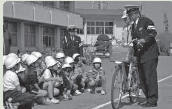
これからも交通ルールを守りましょう

4月14日には総上小学校で開催され、はじめに体育館で、茨城県警察本部から「交通ルールのお話」があり、子供たちは熱心に話を聞いていました。その後、腹話術の「けんちゃん」が登場すると、大きな歓声があちらこちらで響き渡りました。最後に、グラウンドにおいて1年生は横断歩道の渡り方、3・5年生は、自転車の正しい乗り方を学びました。これからの交通ルールを守って交通事故ゼロを目指しましょう。