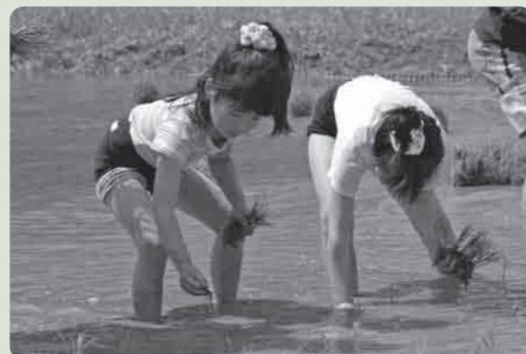
上手に植えられるかな

これは、ホタルが羽化する6月ごろに稲の葉のしずくを飲むため、ホタルの成長の願いを込めて実施されたものです。