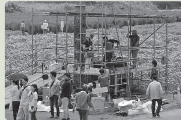
ジャンボ豚汁！おいしく出来ました

5月22日に小貝川ふれあい公園イベント広場にて「がんばろう下妻」復興支援イベントが開催されました。これは、市民手づくりのイベントを開催し、下妻市経済の活性化や風評被害を払拭しようと企画されたものです。当日は午後から天候がくずれ、中止となったイベントもありましたが、たくさんの方でにぎわいました。また、今回のイベントで集められた義援金を下妻市にお寄せいただきました。ありがとうございます。