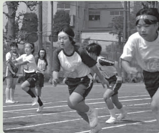
さあバトンタッチだ！練習の成果を