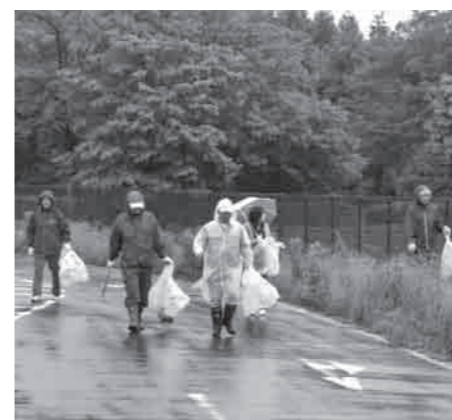
雨の中、たくさんのゴミが集められました

【申請手続】(必要書類等) 補助金交付申請書(生活環境課にあります)、領収書、仕様書、印鑑、通帳(口座振込先の分かるもの)