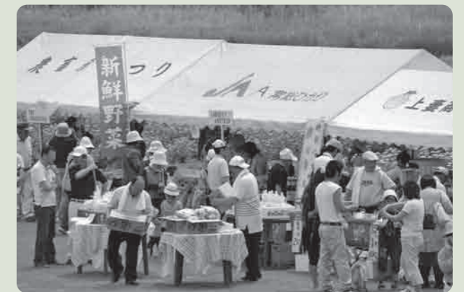
新鮮な下妻の農産物を販売

午前5時、霧が立ちこめるなかでのスタートとなりましたが、次第に霧ははれ、午後2時の終了まで砂沼にはたくさんの釣船が浮かび、へらぶな釣りを楽しんでいました。 これからも「砂沼へらまつり」が続けられるよう、参加されたみなさんには、「砂沼をきれいにする運動」へのご協力を呼びかけました。 今年で45回目を迎える「砂沼へらまつり」が、ゴールデンウィーク最終日の5月8日に開催されました。これは、毎年砂沼愛魚会が主催しているもので、今回も県内外から115名の参加者でにぎわいました。 午前5時、霧が立ちこめるなかでのスタートとなりましたが、次第に霧ははれ、午後2時の終了まで砂沼にはたくさんの釣船が浮かび、へらぶな釣りを楽しんでいました。