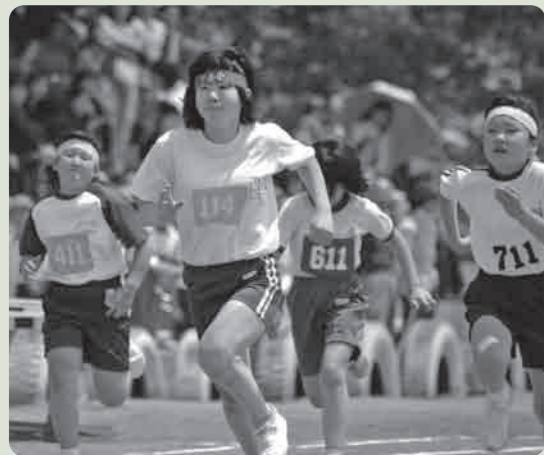
応援を力にかけて！