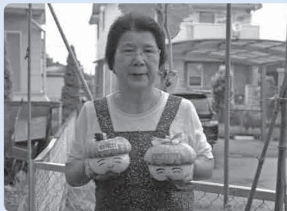
かわいいカボチャができました