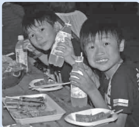
みんなで食べるバーベキューは最高!

この会は、平成5年から行われているもので、トウモロコシの種まきから収穫までを体験することにより、自然とふれあい豊かな感性を育み、同時に親と子のスキンシップを図ろうとするものです。 参加されたみなさんは、おいしいトウモロコシを何本も頬張り、親子で楽しいひとときを過ごすことができました。