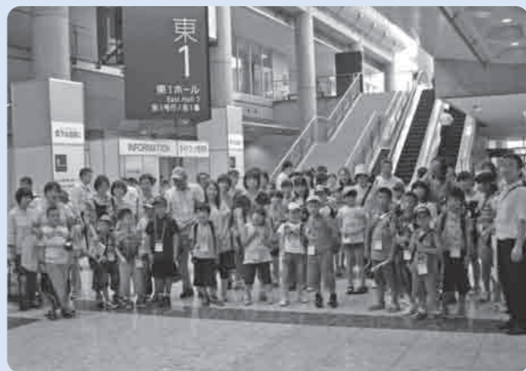
これから水の探検に出発です

7月26日、第7回となる「水の探検バスツアー」が実施され、市内の小学生親子72名が、東京ビッグサイトで開催された「下水道展11東京」を見学しました。