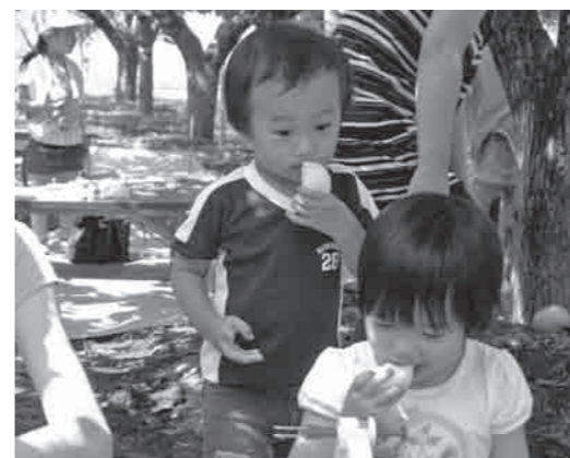
子どもたちも梨が大好きです