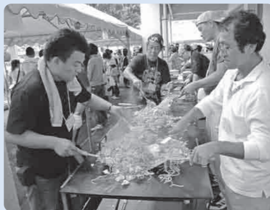
おいしい焼きそば：お父さんたちの手づくりです