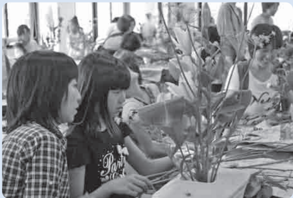
お部屋にかざりたいね

完成した作品はみな素晴らしいので、参加された皆さんは皆一様に満足そうな笑みをこぼしていました。夏休みの楽しい思い出がまたひとつ増えたことでしょう。