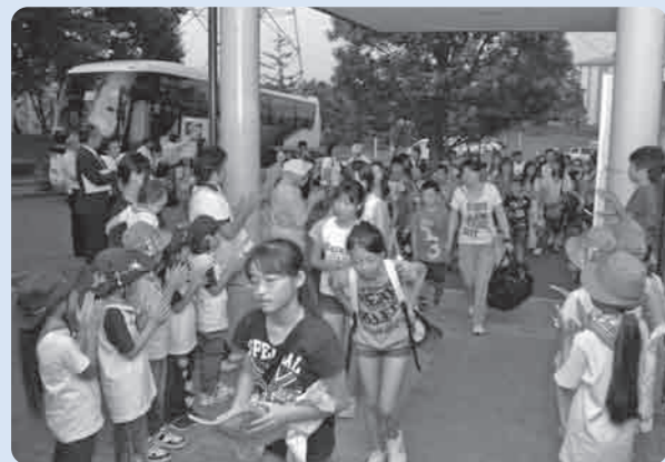
下妻市へようこそ(ビアスパークしもつまにて)

今回の招待は、「県バス協会県西支部」と「被災地の子もたちに元気と希望を取り戻す体験学習実行委員会」が企画したもので、下妻市には17日に宮城県山元町立中浜小学校の児童、保護者の皆さん(総勢66名)が訪れました。