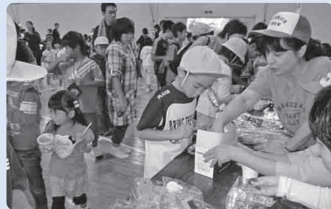
ほしいものが当たるかな：くじ引き