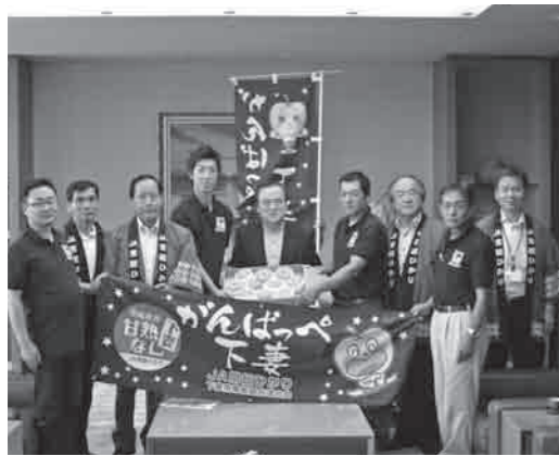
茨城県庁で「甘熟梨」をPR