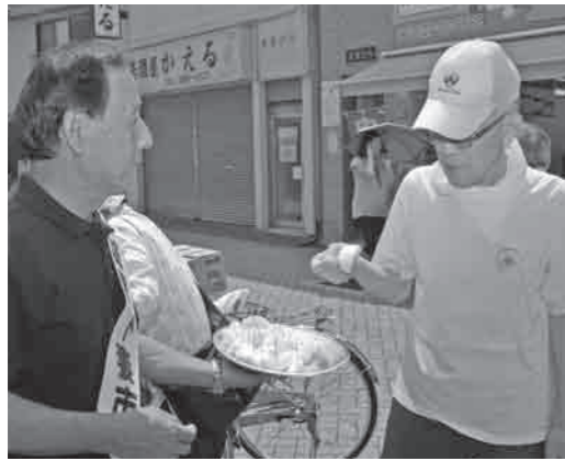
下妻市特産品アンテナショップの試食会