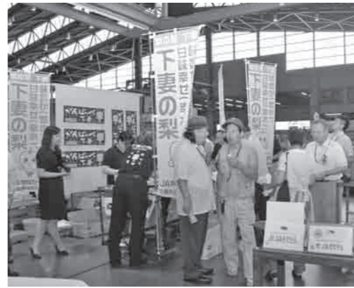
大田市場で下妻産梨のPR