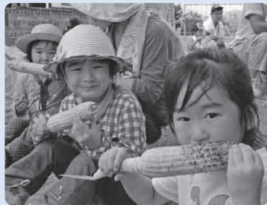
おいしいトウモロコシをガブリ!

この会は、平成5年から行われているもので、トウモロコシの種まきから収穫までを体験することにより、自然とふれあい豊かな感性を育み、同時に親と子のスキンシップを図ろうとするものです。 参加されたみなさんは、おいしいトウモロコシを何本も頬張り、親子で楽しいひとときを過ごすことができました。