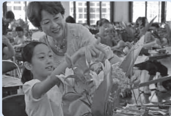
もうすぐ完成！きれいにできました