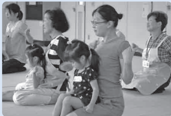
お母さんのひざの上で一緒に体操を