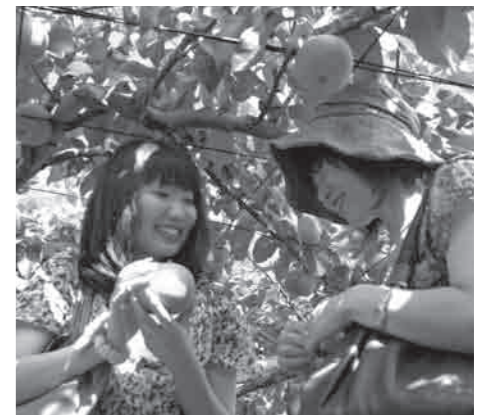
「いいな!下ツアー」の甘熟梨狩り体験

参加された皆さんは、梨狩り体験で甘熟梨を頬張り、砂沼の散策で自然を満喫、大宝八幡宮での参拝やビアパークしもつまの温泉入浴、そして、最後に訪れたやすらぎの里では、下妻市の農産物等のお土産を購入するなどして「日帰りバスツアー」を楽しみました。