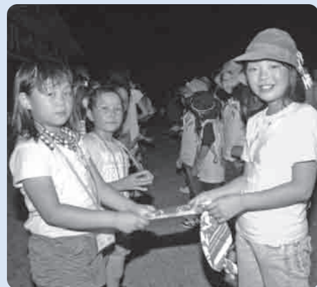
お友達がたくさんできました

今回の招待は、「県バス協会県西支部」と「被災地の子もたちに元気と希望を取り戻す体験学習実行委員会」が企画したもので、下妻市には17日に宮城県山元町立中浜小学校の児童、保護者の皆さん(総勢66名)が訪れました。