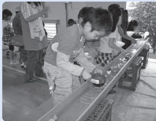
狙いをさだめて：スーパーボールすくい

当日はあいにくの雨模様で、楽しみにしていた大玉おくりは中止となりましたが、ヨーヨー釣りやくじ引きなど人気の模擬店には行列ができて、焼きそばやフランクフルトをたくさん食べて、楽しい夏休みの思い出を作ることができました。