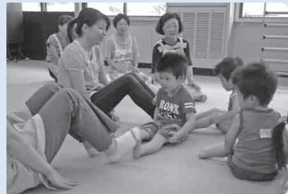
足と足でリズムにあわせて

参加した子供たちは、始めは緊張していましたが、音楽に合わせた体操が始まると、インストラクターの先生を見ながら手足を大きく動かして体操を楽しんでいました。この体操を通じて、親子のふれあいが充分感じられたのではないのでしょうか。