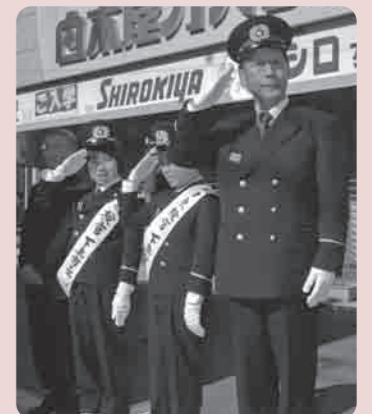
市長と1日点検官による車両観閲