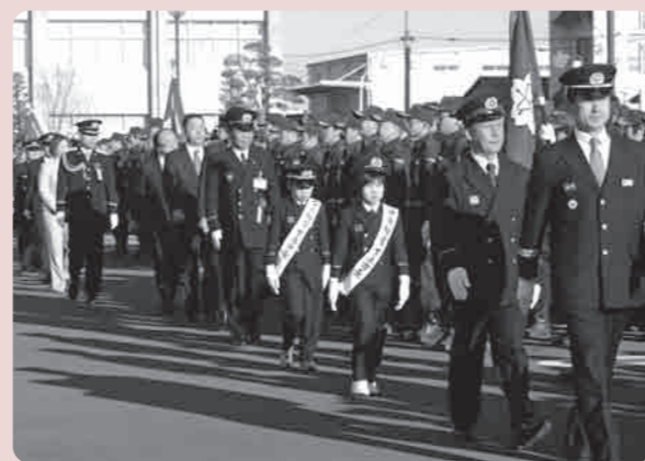
1日点検官による服装機械器具点検

し、永年にわたり市民の皆さんの命と財産を守るため、災害現場の第一線でご活躍された方や退職された方など111名の皆さんが表彰されました。 表彰式終了後の駅西口通りで消防自動車21台によるパレードが行われ、市長と1日点検官による車両観閲が行われ出初式が終了しました。 消防団員のみなさんは、私たちの尊い命や財産を守るため、日夜さまざまな活動をしております。