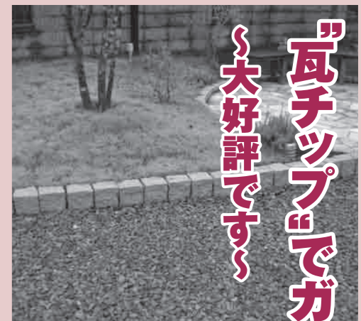
ガーデニングの例1