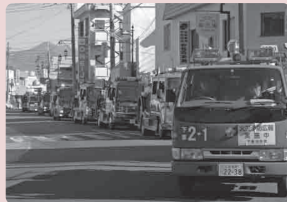
消防自動車21台によるパレード

わらべうた・あそびランドは平成2年に発足し、機関紙「くさぶえ」の発行や、7月の「とうもろこしを食べよう会」11月の「芋煮会」など様々な活動を通して、幼少年の情操教育や感性を育むための運動を進めています。 当日は、下妻保育園、きぬ保育園、大宝保育園、大和保育園の園児70名が参加し、色とりどりの浴衣で、四季の歌やお遊戯が披露され、大きな拍手が会場いっぱいに響き渡りました。