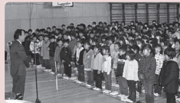
親子の絆を深めることが出来ました