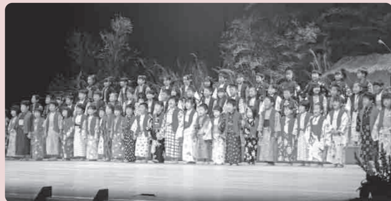
素晴らしい歌や踊りが披露されました

1月22日、市民文化会館において、わらべうた・あそびランド主催による第11回わらべうた・あそびランド大会が開催されました。