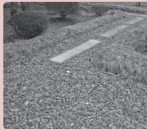
ガーデニングの例2

東日本大震災で壊れた瓦から再生した「瓦チップ」がたいへん好評で、市内はもとより、県内外からも希望するたくさんの方がリサイクルセンターを訪れております。配布開始から約3ヶ月がたち、瓦チップはさまざまなお所で活用されています。