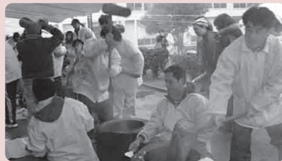
お父さんたちが活躍しました

また、親子レクリエーションやバザーも開催され、親子の絆を深めました。「昨年の東日本大震災で絆の大切さがクローズアップされ、こうしたふれあい集会で親子は勿論、保護者同士の絆が深められます。」と話が聞けました。