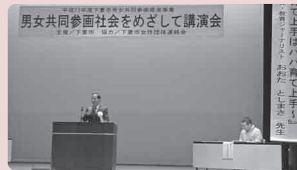
男女共同参画の推進を