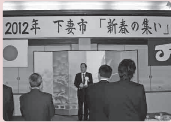
下妻市の更なる発展を願って

1月13日、下妻市・下妻市商工会、常総ひかり農業協同組合の共催による「2012年下妻市新春の集い」が約220名の出席のもと盛会におこなわれました。 この集いは、地元選出の国会議員をはじめとして、県議会議員や市議会議員、各種団体や企業の代表者が出席し、これからの下妻市をどのように活性化し、生き活きと力強い下妻市を創り上げていくことが出来るかなどの意見を交換する場でもあります。