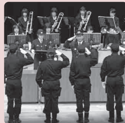
永年にわたりご活躍された方々を表彰