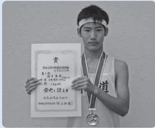
全国大会での活躍を期待します

市内でおこなわれた各種行事や地域の話など… みなさんからの情報をお待ちしています。 (市長公室 広報広聴係 内線1212)