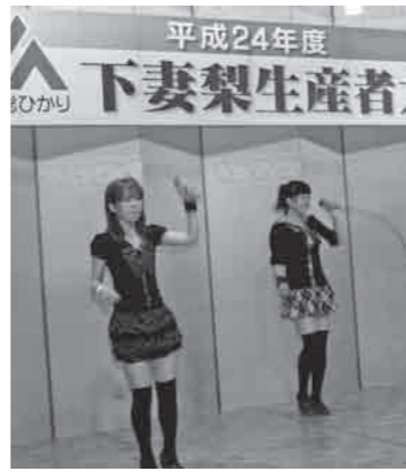
明るく元気な「しもんchu」メンバー

生産者大会後のアトラクションでは、下妻のご当地アイドル「しもんchu」が持ち歌「ペア・ペア・なっしんぐ」（ペア梨）を披露し、会場を盛り上げていました。