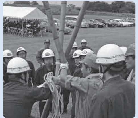
真剣なまなざしで訓練に臨む団員達

7月29日、第53回鬼怒・小貝水防連合体水防訓練が、つくばみらい市下平柳地先の小貝川河川敷で行われ、当市のほか、つくば市、常総市、つくばみらい市及び八千代町の消防関係者約300人が参加しました。