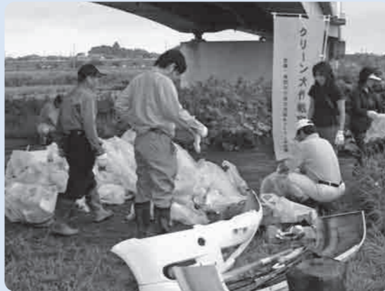
大きなゴミも回収されました

今回は、朝早くから周辺住民や団体など総勢2,005名が参加し、約27立方メートルのゴミが回収されました。