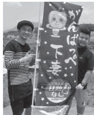
「なしっぺくん」の入ったのぼり旗でPR

ナルキョクター「なしっぺくん」も誕生し、ブランド化を目指したPR活動の一翼を担っています。 ■「下妻甘熟梨」の特徴① 「樹上で完熟させてから収穫」 食味を重視することから、より完熟に近づけるため、通常の梨を収穫