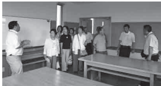
「リフレこかい」を施設見学する市政モニター

なお、交付式の後に、今春完成した「東部中学校の新校舎」と、下妻の南の玄関口とされる「やすらぎの里しもつま」の見学会を行いました。