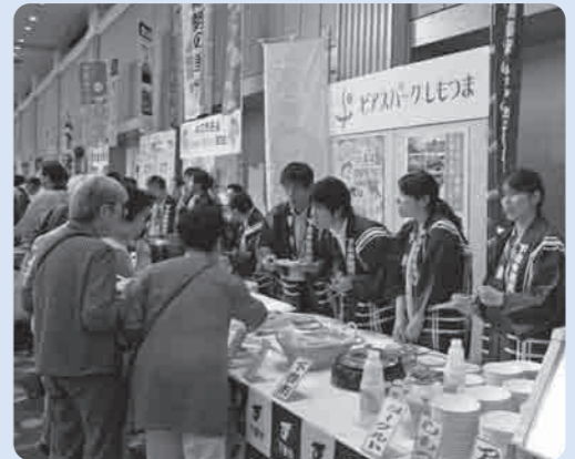
下妻の味を堪能していただきました

7月6日、東京都及びその近郊で活躍する茨城県出身者で組織される「茨城県人会連合会」の総会が都内ホテルで開催され、各界で活躍する約500人が参加しました。