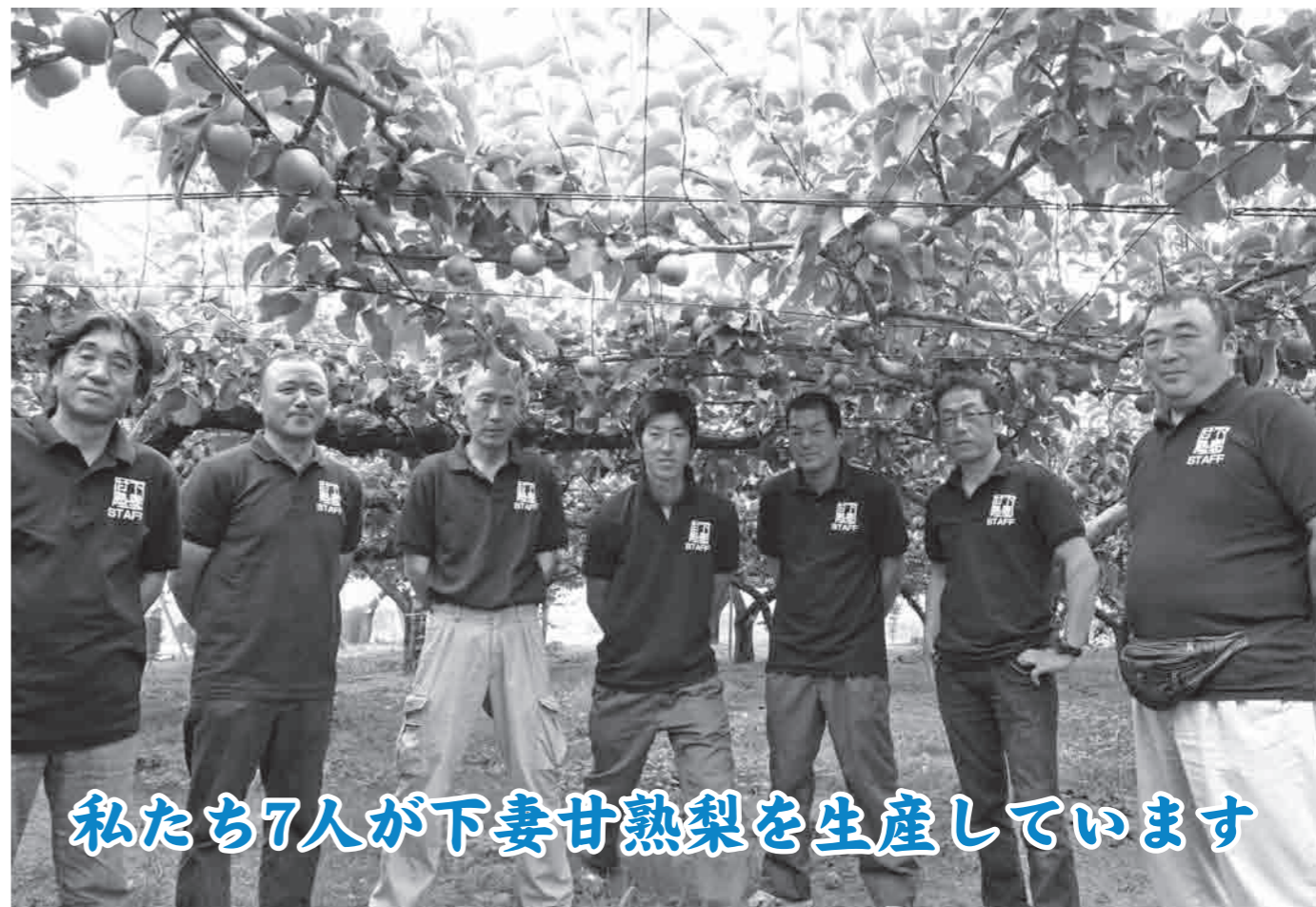
私たち7人が下妻甘熟梨を生産しています

■梨本来のおいしさを食べてもらいたい 下妻産の梨は、7月上旬からハウス栽培の梨に始まり、露地栽培の幸水、豊水、あきづき、新高などの赤梨が生産されています。 「幸水」は贈答用としてのニーズが高まる8月上旬からお盆までが出荷の主流ですが、お盆前の出荷は見た目重視になりがちのところがありません。そこで、下妻市果樹組合連合会に所属する梨生産者の若手有志が組織したプロジェクトチームでは「梨本来のおいしさを食べてもらいたい、伝えたい」と新商品の開発に地道な努力を重ねた結果、収穫を通常より