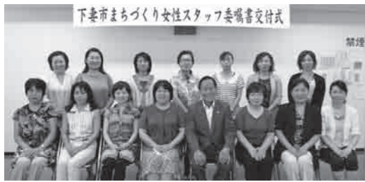
新スタッフで元気にスタート

7月26日に、今回が第9期となる「下妻市まちづくり女性スタッフ」が発足し、委嘱書交付式が行われました。これから市内在住の女性14名の新たなスタッフが2年間活動します。