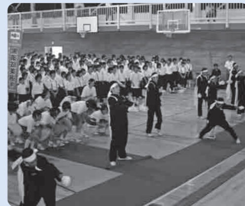
熱いエールを送る下妻中学校の生徒達