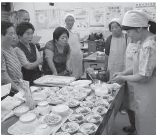
「適塩」が調理のポイントです

大豆に期待される効果として、①悪玉コレステロールの低下 ②骨密度の低下抑制 ③更年期症状の緩和作用があげられます。大豆製品としては、納