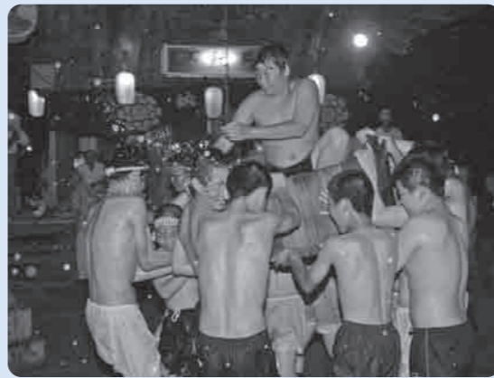
活気に満ちた若者達が練り歩く

伝統の「雨乞い祭」は、緑日となる7月28日の前夜祭として五穀豊穡・家内安全を願って盛大に行われ、境内では満水にした木製の大タライを地区の若い人達が担ぎ上げ、大タライに乗った一人が周囲の人達に水をかけながら激しく練り歩くと、観衆からは大きな歓声が沸きあがっていました。