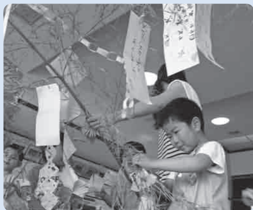
願いが叶いますように

7月7日の七夕が近づいた7月初旬、市内の幼稚園・保育園で七夕かざりが行われました。 子ども達は、様々な願いを短冊に込めて、笹の葉に一つひとつ丁寧に結びつけ、彩り豊かに飾りつけられた七夕かざりを前に「たなばたさま」の歌を大きな声でうたっていました。 願い事の中には「パパとママとみんながなかよくくらすように」「しあわせがみんなにきますように」など家族愛や絆を願うものがあり、昨年の東日本大震災以降、子ども達の中にも人と人のつながりの大切さや思いやりの気持ちが広がっています。