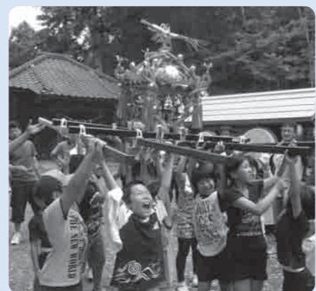
新しい神輿に喜びいっぱいの子ども達

中居指自治会では、平成24年度の宝くじ助成を受けて子ども神輿や太鼓、鼓を新調し、7月14日に中居指コミュニティセンターで記念祝賀会が行われました。 この助成は、宝くじの社会貢献広報事業としてコミュニティ活動に必要な備品等を整備するために行われるもので、地区ではこれまで以上に夏祭りを盛り上げ、地区全体の活性化につなげていこうとしています。 7月22日に行われた夏祭りでは、新調した子ども神輿などを前にたくさん喜びの声が聞かれ、子ども達が元気いっぱい神輿を担ぐ姿に声援が送られていました。