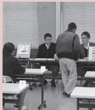
厳粛に入札される不動産公売

場合、市は督促状を發します。市は、督促状を送達したにもかかわらず市税を完納しない納税者に対しては、滞納処分(財産の差押、公売など)を行い、滞納市税に充当します。 今後も税の公正・公平性の確保のため、市税滞納に対し、厳正・的確な滞納処分を行います。