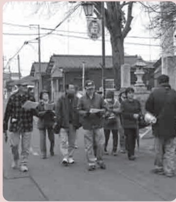
殿様が通った道の解説を受ける参加者たち

また、12月15日には今年、井上下妻藩が開藩して300周年を迎えることを記念し「参勤交代で殿様が通った道を歩く」と題したツアーが行われ、江戸時代に描かれた下妻の古地図を片手に上町、三道地、西町、陣屋などを散策しました。