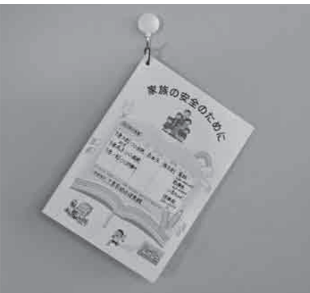
大切な情報を記入し、目に付くところに常備

この度、下妻市まちづくり女性スタッフ(第8期)から市政について提言書が提出された中で、活動中に東日本大震災を体験し、独自にアンケートをとり、幅広い年代からの情報をもとに「防災マニュアル」がまとめられました。