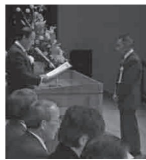
受賞おめでとうございます

また、今年度初めて実施された「いじめ防止に関する標語コンクール」の最優秀者2名の表彰も行いました。