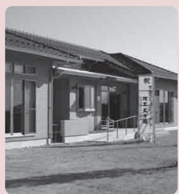
木造平屋建で床面積は156.96平方メートル

この助成は、宝くじの社会貢献事業としてコミュニティ活動に必要な施設等を整備するために行われるもので、下宮地区の拠点施設ができたことにより、地区住民の絆をより深めるために子どもから大人を含めたコミュニティ活動の活性化が期待されます。