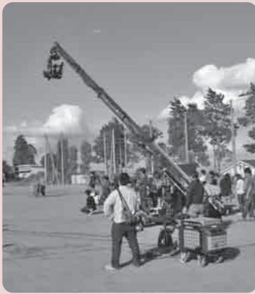
旧校舎とグラウンドを活かしたCM撮影

最近、旧東部中学校の校舎・グラウンドがCM（コマーシャル）や映画、テレビ番組のロケ地として活用される機会が増えています。 昨年4月に新校舎が完成して移転開校した東部中学校。移転後に跡地となった旧東部中学校のグラウンドや耐震性のある武道場は地域開放され、市民の方々に活用されていますが、使わなくなった旧校舎や旧体育館などの施設がロケ地として映像関係者から注目されています。 撮影で利用する制作会社のスタッフは「使わなくなって間もない校舎なのできれい。教卓や生徒の机などの備品類がそのまま残っているのので撮影に重宝しています」と撮影場所に選定した理由を話してくれました。