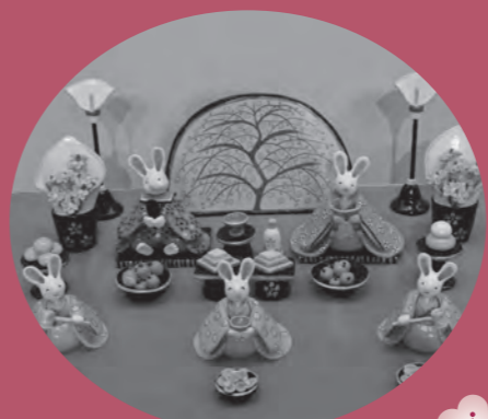
うさぎのおひなさま

三月の節句行事「ひなまつり」は、毎年各家で雛人形を飾るなど身近なものとなり、各地の博物館などでもさまざまな方法で「おひなさま」の展示会が開催されています。 下妻市ふるさと博物館では、各家で大切に伝えられ、保管されてきたおひなさまや特色あるおひなさまを借用し、華やかで心和む「ひな人形の世界」を展示します。 特別展示では、日本の伝統工芸である「こけし」を展示します。「おひなさま」の華やかな美しさと「こけし」の素材を可愛らしさをお楽しみください。