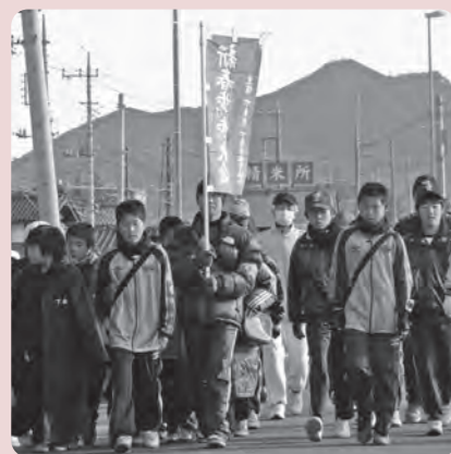
新春を元気に歩く参加者たち

1月3日、今年で42回を迎え、新春恒例となる「下妻市新春歩け歩け大会」に市民600名が参加し、少し風が強い日でしたが、参加者全員が元気に完歩しました。 歩いたコースは、市民文化会館をスタートして北へ、大宝八幡宮を参拝し、雄大な筑波山を眺めながら大串や堀竜を経由して市民文化会館にもどる約8・4キロメートル。完歩賞としてミニダルマが渡され、さらに抽選で福袋が当たった方には笑顔がこぼれていました。 ゴールした50歳の夫婦は「筑波山がきれいに見えて、気持ちよく歩くことができた。今年もよい一年になりそう」と話してくれました。