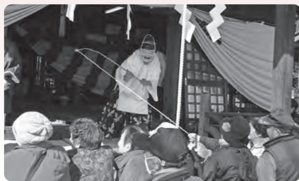
恵比寿様の福にあやかろうと糸先に集まる参詣者たち

今年はいじめて例祭の手伝いを経験した40歳代の女性は「お嫁に来てから初めての手伝いですが、愛宕様や例祭の由来を知るよい機会になった。子ども達にもしっかり伝えていかなければならないですね」と話してくれました。