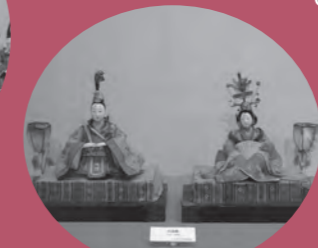
大正期のおひなさま