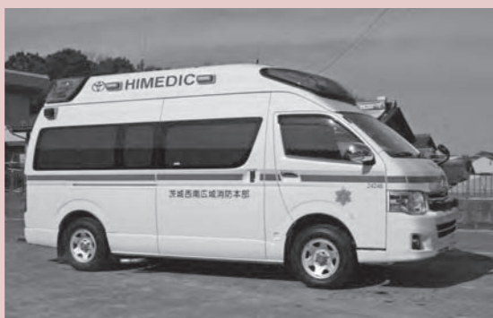
処置スペースが広くなり、機能が拡充された高規格救急車 昨年12月に下妻消防署へ配備

緊急時は誰でもあわててしまうため、普段から医療情報をまとめておくことは大切です。高齢の方や障がいのある方に限らず、備えておいた方がよいものだと思います。