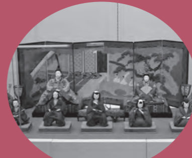
江戸後期のおひなさま