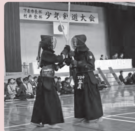
少年剣士たちの気迫が会場内に響き渡る

県西地区の少年少女剣士たちが集まる「第20回下妻市長杯少年剣道大会」・第28回村井登杯少年剣道大会」が1月20日、市総合体育館で開催され、40校の中学生と35クラブの小学生が参加し、技を競い合いました。