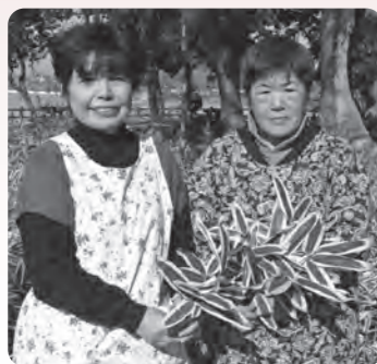
境内の熊笹を「火除けのお守り」にする参詣者

この熊笹を持って帰り、火を使う台所や家の玄関口に差しておく『火除けのお守り』になる」と境内に群生する熊笹を選びを真剣な面持ちで行う参詣者が多く見受けられます。