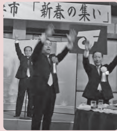
市の発展を祈念して万歳三唱

参加者は、市の将来や地域の活性化について意見を交換するなど、力を合わせて市の発展に取り組んでいくことを確認しました。