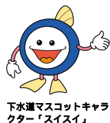
下水道マスコットキャラクター「スイスイ」