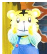
CBenesse Corporation/ しまじろう

全国各地で大好評の「しまじろう劇場公演」が下妻へやって来ます。しまじろうと一緒に歌う・踊る・遊ぶ!ただ観るだけではない“参加する舞台”へ、ご家族そろってお越しください。