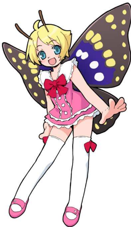
下妻市ホームページキャラクター（シモンちゃん）