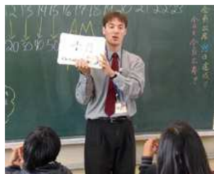
外国語指導助手を活用した英語授業