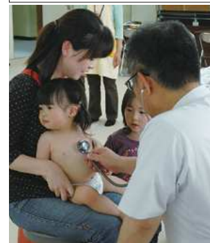
乳幼児の健康診査