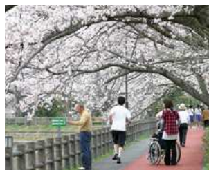
市民に親しまれる砂沼広域公園