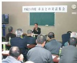
自治区長と市長との対話集会