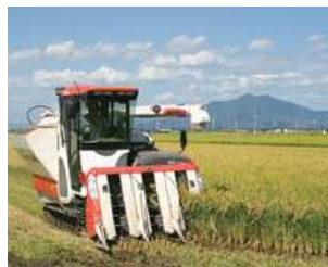
豊かに実った良質米の収穫