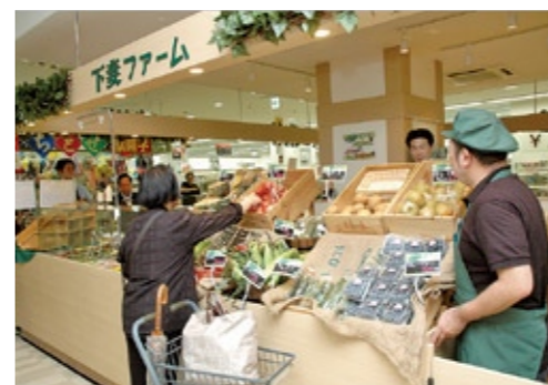
新鮮野菜を手取る買い物客

店内では、サラダバーに加えて、毎日店内で手づくりするオニオンスープとトムヤムクン風ピリ辛スープを販売し、イトインコーナーで食べることもできます。今後は豚肉を使用した料理など新メニューを開発し、販売していく予定です。千葉県浦安市に行く際には、ぜひ一度お寄りください。