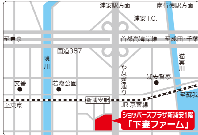
●JR京葉線・新浦安駅下車……徒歩1分(南口すぐ)