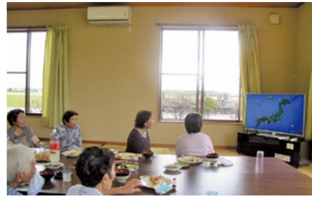
整備されたテレビを見ながら快適に利用される筑波島集会所

この助成は、財団法人自治総合センターが宝くじの 普及・広報等を目的にコミュニティ活動に必要な備品・ 施設を整備する自治会などに行うもので、筑波島自治 会では今回の備品整備をきっかけに集会所の利用を 促進し、地域の連帯感の高まりやコミュニティ活動の 活性化につなげています。