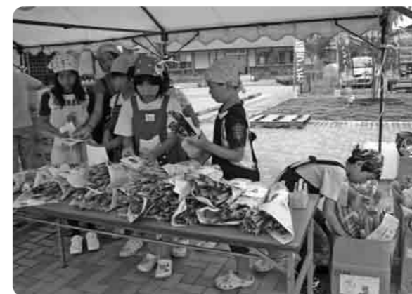
とても美味しいネギです