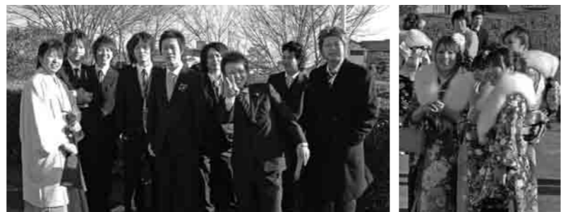
なつかしい友人との再会をスナップで

この日、新成人が中学3年生当時の担任の先生が会場にかけつけ、励ましのことばを贈りました。また、来場できなかった先生方からもお祝いのメッセージが届けられ、新成人の皆さんは感激の様子でした。