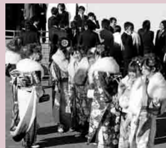
市民文化会館で開かれた成人のついで。久しぶりに友だちと再会し、思わず笑みがこぼれる新成人の皆さん。

先月は、交通事故の発生件数が前の年と比較して増えてしまいました。その中でも、やはり70歳以上の高齢者が係わる事故が目立っています。また、女性の方や10代の若い方の事故も多くなっているようです。横断歩道以外を横断して事故に遭ってしまうなど、事故に遭う確率を、自ら高くしてしまわないよう注意しましょう。(S)