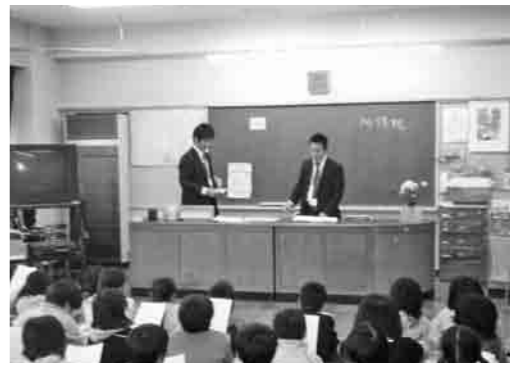
市の職員が先生に

児童・生徒からは、「たくさんの物に税金が使われていることがわかった」「税金の大切さがわかって良かった」などの感想が寄せられました。2月から3月は確定申告の期間です。子供からお年寄りまで、みんなが住みやすい社会を築くために、正しい申告と期限内の納税をお願いします。