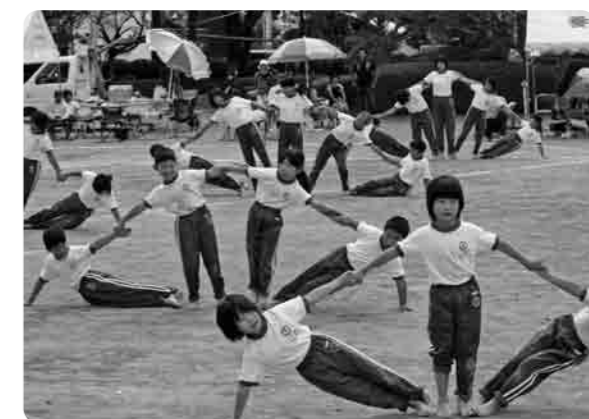
全校児童でがんばった組体操