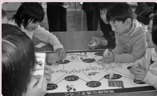
常総線交通すごろく

実にならないためには、普段から積極的に公共交通を使う必要があること、便利な車も使い過ぎれば渋滞や事故、CO2増加、肥満などのデメリットが増えることが説明されました。また、駅員さんによる常総線の質問コーナーでは、地域を走る鉄道の話聞くことができ、児童の皆さんは、地元の公共交通である常総線をこれからも大切に考えていくことを実感していました。