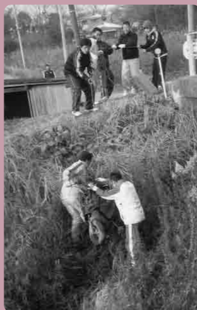
バイクの引き上げ作業

当日は、北台川に不法投棄されたバイク2台のほか、道沿いに捨てられた飲料水の空き缶・空ビン、紙(神)あり。(笑)“