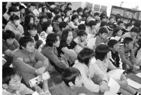
真剣に話を聞く児童

昨年11月から1月にかけて、市内の小学6年生と中学3年生を対象に「租税教室」が開催されました。次世代を担う児童・生徒たちに、税金の意義や役割、納税が国民の義務として重要であることを認識してもらうことを目的に、市役所税務課・収納課、下館税務署、県税事務所の職員が各学校を訪問し行われました。