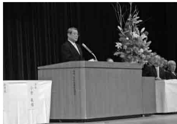
小倉市長からお祝いのことば

今年度、新たに528人が成人の仲間入りをし、1月10日、市民文化会館大ホールを会場に、「成人のつどい」が開催されました。 この日は、388人が参加し、会場に集まった新成人の皆さんは、近況報告や記念撮影をしながら、久しぶりに会った友人との再会を楽しんでいました。 式典では卒業当時の校長先生が紹介されると、新成人から大きな拍手が沸きあがりました。小倉市長から、「皆さんの20歳という年齢は、無限の可能性を秘めた若さという大きな財産です」と、お祝いのご言葉を贈りました。