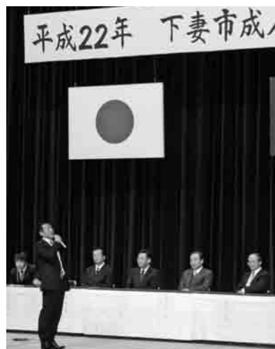
先生からのメッセージに勇気づけられる