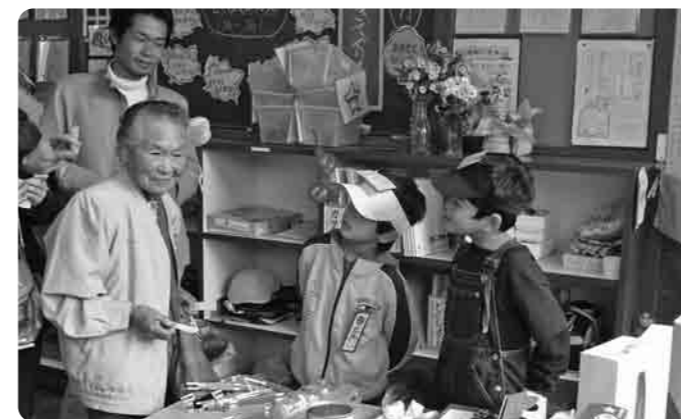
地域のお年寄りとのふれあい

やすらぎの里でのネギ販売 ぼくたちの蚕飼小学校では、農園でネギやトウモロコシ、スイカなどを育てています。夏休みには、収穫したネギをやすらぎの里で販売しています。今年は、6年生8名で50たば販売することになりました。最初のうちは、ぜんぜん売れなかったけれど、途中からまとめて買ってくれる人も出てきました。そのおかげで50たば全部売れました。知らないお客さんや地域の人も買ってくれたので、とてもうれしかったです。