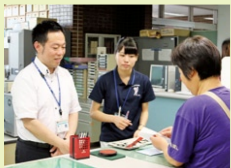
ノーネクタイや下妻市イメージキャラクター「シモンちゃん」ポロシャツの軽装で業務にあたる市職員

市民の皆さまには、この趣旨をご理解いただくとともに、市役所にご来庁の際は、ぜひ軽装でお越しください。