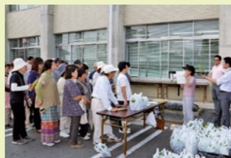
「STOP! 温暖化エコネットしもつま」によるゴーヤ苗の無料配布と上手な育て方などの指導(緑のカーテン普及促進)

市では、庁舎や学校・幼稚園・保育園などに設置することで家庭での省エネ対策を実行してもらえよう「ゴーヤ苗の無料配布」を実施し、合わせて上手な育て方の指導などの啓発活動を行っています。