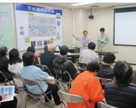
第1回エコネット塾で、下水道のしくみなどの説明を受ける参加者

「STOP! 温暖化エコネットしもつま」は、市民団体や事業所で活躍する会員で組織しており、まずできることとして、この「エコネット塾」を企画しました。今後も開催していきますので、ぜひ参加してください。