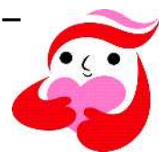
犯罪被害者等支援シンボルマーク 「ギョットちゃん」