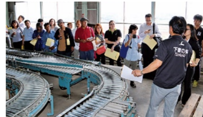
下妻第一選果場で梨の仕分けレーンの説明を受ける視察団

今後は、タイへの梨の販売輸出など、農業をきかつけとした交流の拡大に期待が寄せられています。