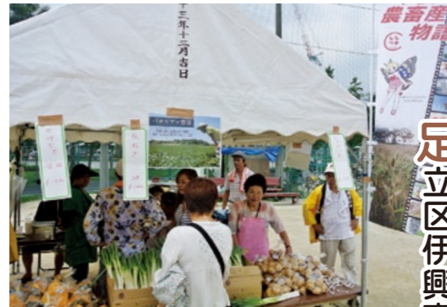
新鮮な野菜など並ぶ物産販売ブース

近年、高齢者の交通事故が増加傾向にあることから、孫からのメッセージで交通安全意識を高めてもらおうと茨城県警察本部が企画し、県内の小学校に参加を呼び掛けました。今回は公立小学校37校が応じ、5,000通を目標にしています。