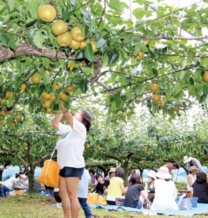
美味しそうな実を見定めるツアー参加者