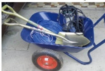
非常時に備える水中ポンプなどの機材類

私たちが住む上宿八班の地区は、坂の下にあるため雨水が流れ込んできたり、水が捌けなかつたりします。1時間の雨量が30ミリを超えると、家の前の道路が冠水し、過去に4〜5回床下浸水を経験しました。床下浸水したり、冠水した雨水が残っていると衛生面が心配になります。これまで、大雨のたびに市から何度も土のうを運んでもらいました。今も地区の北側からの雨水対策には、積んだ土のうをそのまま残してあります。この雨水対策を何とか自分たちで解決できないかと考え、水中ポンプによる排水を市に相談したところ、自主防災組織活動事業費補助金の資機材等整備事業を活用することができると知り、班内で相談して、今年7月に自主防災会の結成に至りました。水中ポンプを常備した後は幸いにも大雨はありませんが、8月27日に試運転を兼ねた動作訓練を行いました。水中ポンプが常備でき、会員が訓練し、災害への備えができたことは自主防災会を結成して本当に良かったと思っています。今後、水中ポンプで対応しきれない記録的な大雨がないとは言いませんので、自主防災会のみならず、協力して、さらに防災対策を検討していきたいと思えます。