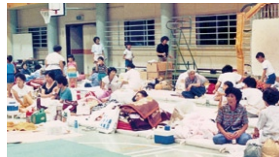
昭和61年8月の台風10号による水害で避難した地区住民(高道祖小学校体育館で)

自分の住んでいる地域の避難所を、家族みんなで事前に確認し、家族が離ればなれになった場合の連絡先や災害用伝言ダイヤル「171」の利用方法などを確認しておきましょう。 併せて「下妻市洪水ハザードマップ」も確認しておきましょう。「下妻市洪水ハザードマップ」には河川の氾濫などで浸水が予想される範囲や程度が示されています。避難所は、下妻市地域防災計画の改定により一部変更されていますので、左表を確認して、いざという災害時に安全なルートで避難できるようにしておきましょう。 「下妻市洪水ハザードマップ」は、市役所本庁舎・消防交通課や千代川庁舎・くらしの窓口課で閲覧できます。また市ホームページでも見ることができます。