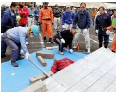
消防署員の指導を受け、倒壊家屋からの救出を訓練する地区住民(平成25年下妻市防災訓練で)