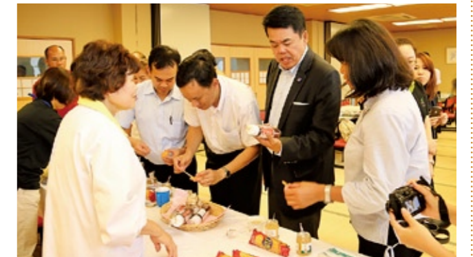
梨ジャムやドレッシングを試食し、質問する大使や視察メンバー