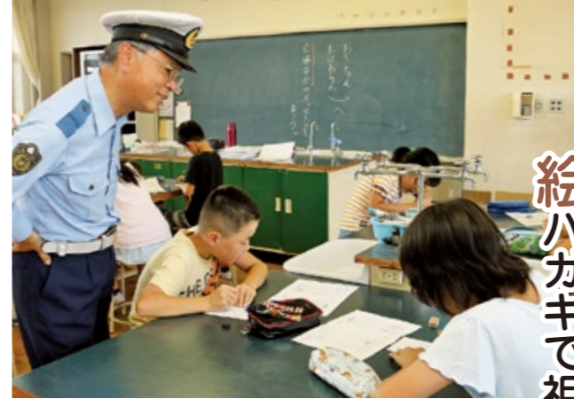
真剣な表情で祖父母に絵ハガキを書く児童たち