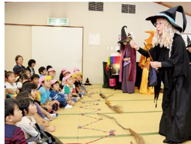
親子で楽しんだ劇団くるみ座の魔女シリーズ公演