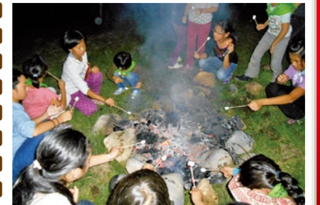
キャンプファイヤー後、「サモア」というお菓子をみんなで作って食べました(8月17日、宇都宮市冒険活動センターで)

12月には「クリスマス会」を開催し、県西地区のガールスカウトが集まり一緒に活動します。1月には「お茶を楽しもう」、2月には「自然を感じよう」トネイチャーゲームを計画しています。興味のある方はスカウトやリーダーに気軽に声を掛けてください。ぜひ一緒に活動して“女子力”を発信してみましょう。これからは色々なことにチャレンジし、みんなで成長し続けていきたいと思っている42団です。