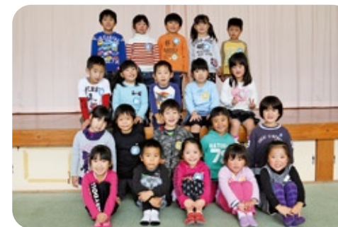
◀年長、年少の皆さん