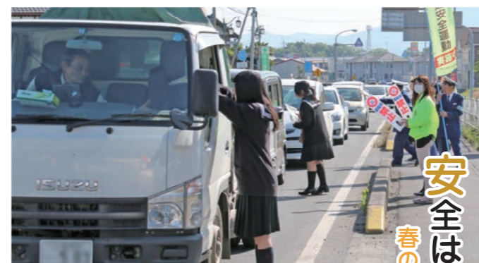
ドライバーに交通安全を呼び掛けました(本宿交差点で)

春の全国交通安全運動(5月11～20日)に伴う街頭キャンペーンが、早朝から市内本宿交差点と宗道交差点の2か所で行われました。