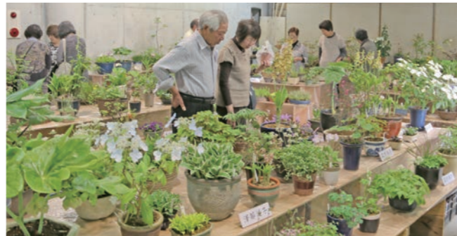
かれんな春の山野草に見入る来場者

つくば市から夫婦で訪れた60代の男性は「華やかさはないけど、見ていてとても落ち着いた気持ちになる」と話し、鉢植えを丹念に眺めていました。