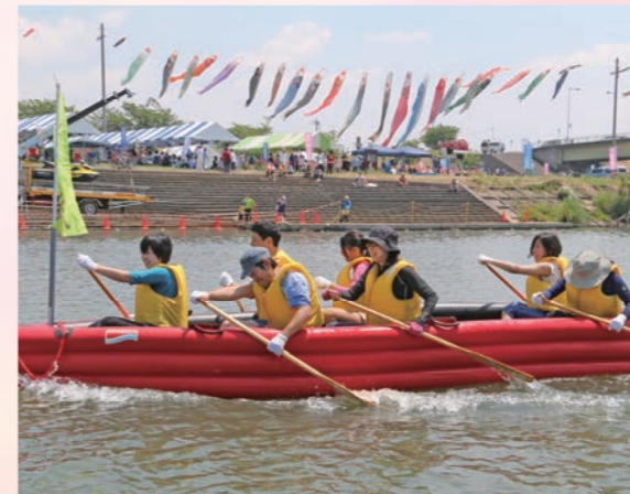
ゴールを目指して必死に漕ぎ続けるEボート参加者

5月17日、鬼怒フラワーライン(鬼怒川大形橋上流左岸河川敷)で、花とふれあいまつりとEボート大会を同時開催。10人が1組になって熱戦を繰り広げたEボートには41チームが参加。風に揺らぐ50万本のポピー畑に9,000人が来場しました。