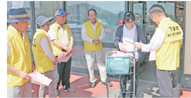
買い物客に啓発チラシを手渡す民生委員・児童委員(5月13日、FOOD OFFストッカー千代川店で)