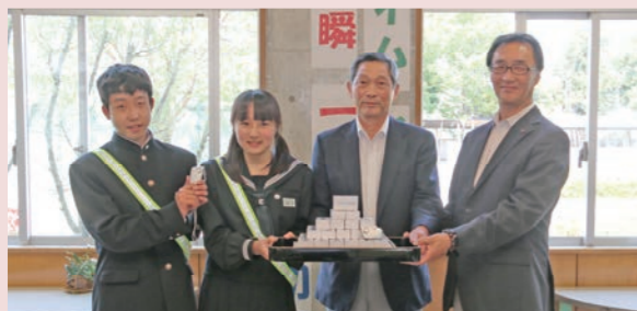
中河原会長(中右)と柴副会長(右)から生徒たちに防犯ブザーが手渡されました

4月27日、地域の子どもたちが安心・安全に登下校できるようにと思いを込めた防犯ブザー100個が、下妻市千代川建設業協会から千代川中学校の新一年生に寄贈されました。