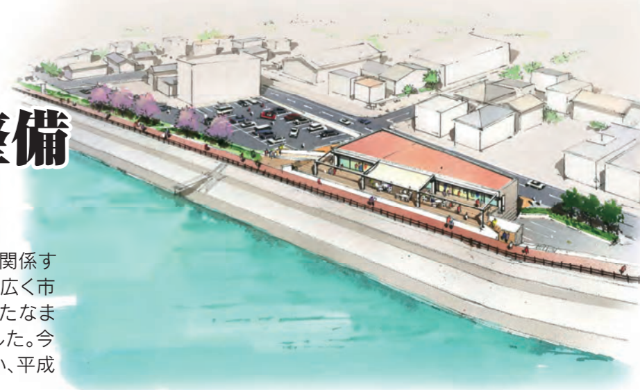
砂沼エントランス（仮）完成イメージ

地域の活性化および市街地再生によるにぎわいのある街づくりを目標に事業を推進している、砂沼周辺地区都市再生整備計画事業の2つの拠点となる「砂沼エントランス（仮）」と「交流広場（仮）」の基本設計を策定しました。