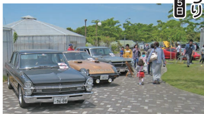
国産車からスーパーカーまで名車が並ぶ

テレビドラマの西部警察に登場したフェアレディZを眺めていた40代の男性は「昭和の時代にテレビで見ていたクルマの実物を見てうれしい。懐かしい感じが、やはりかっこいい」と笑顔を見せていました。