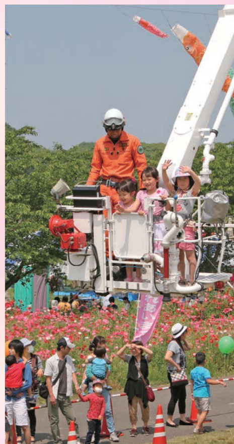
消防はしこ車で上空からポピー畑を見渡す来場者