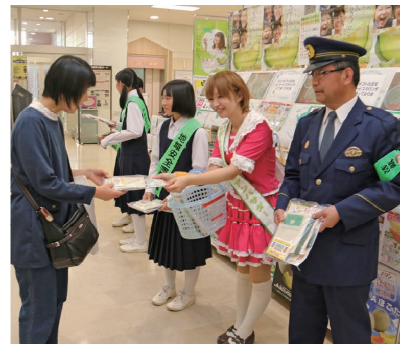
買い物客に防犯を呼びかけるしもんchuメンバーや東部中学校の生徒たち