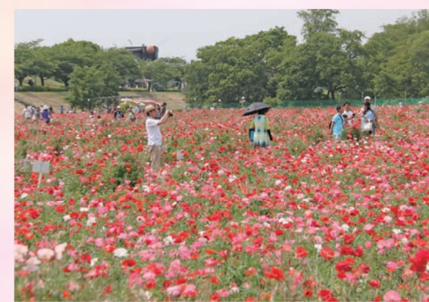
満開の200万本のポピーが来場者をお出迎え

5月のさわやかな陽気に恵まれ、市内外から観光客や家族連れなど2万人が訪れました。