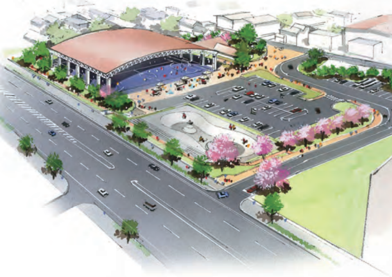
交流広場（仮）完成イメージ