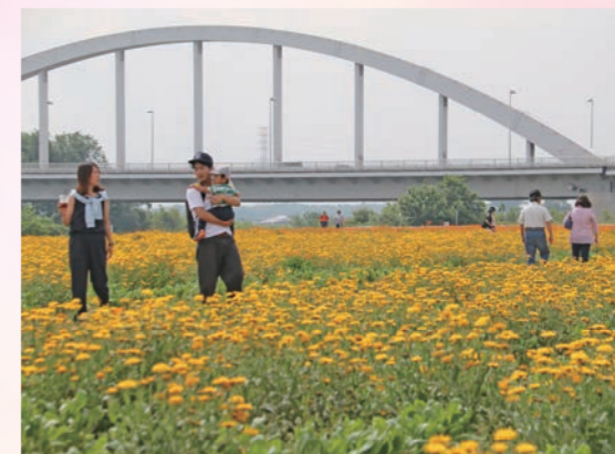
色鮮やかな100万本のキンセンカに囲まれて