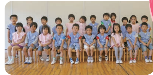
◀年中(ゆり組)、年長(ひかり組)の皆さん