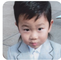
かどい おおか 4歳9か月 (ちよかわ幼稚園)

つくばさんが ねえ ねえ きょう あめふるのかな だって つくばさんが くもにふまれてるよ