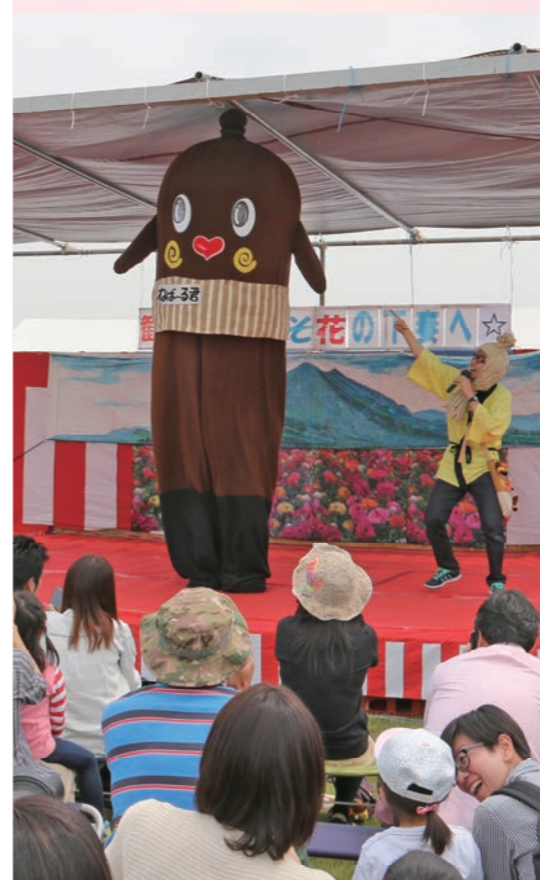
納豆の妖精「ねば〜る君」ステージショーが大人気