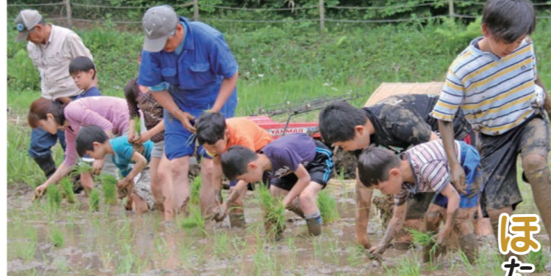
田植えに真剣に取り組む参加者たち

ほたるの環境づくりの一環として田んぼを作ろうと、下妻ほたるの会が主催する田植え体験に市内の親子など約30人が参加しました。