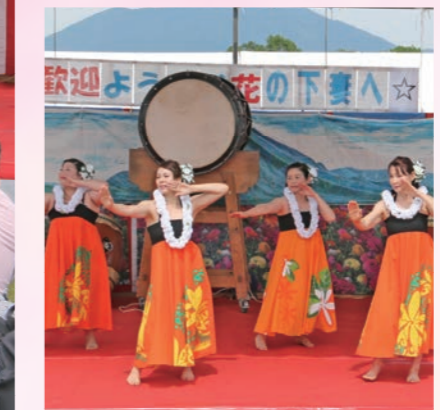
華やかなフラダンスで魅了する市民ステージ