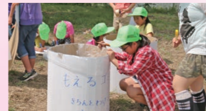
こみ箱作りなどイベントを支える大形小学校の児童