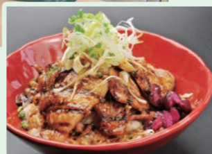
茨城県産「霜ふりハーブ豚」使用 炙り豚丼 800円(税込)

セルフサービス式のレストランです。 メインは、溶岩遠赤パワーで焼き上げる「炙り豚丼」「鶏の照焼き丼」。その他、海鮮ものやうどん等のメニューも揃っています。 営 午前10時30分～午後6時